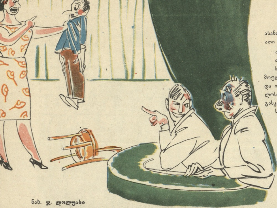
ნახ. ჯ. ლოლუასი

— რა ბუნებრივად თამაშობს კაპას ცოლს ეს მხახიობი! — ჩემი მეუღლეა, ხახლში გადაიდა რეპეტიციას.