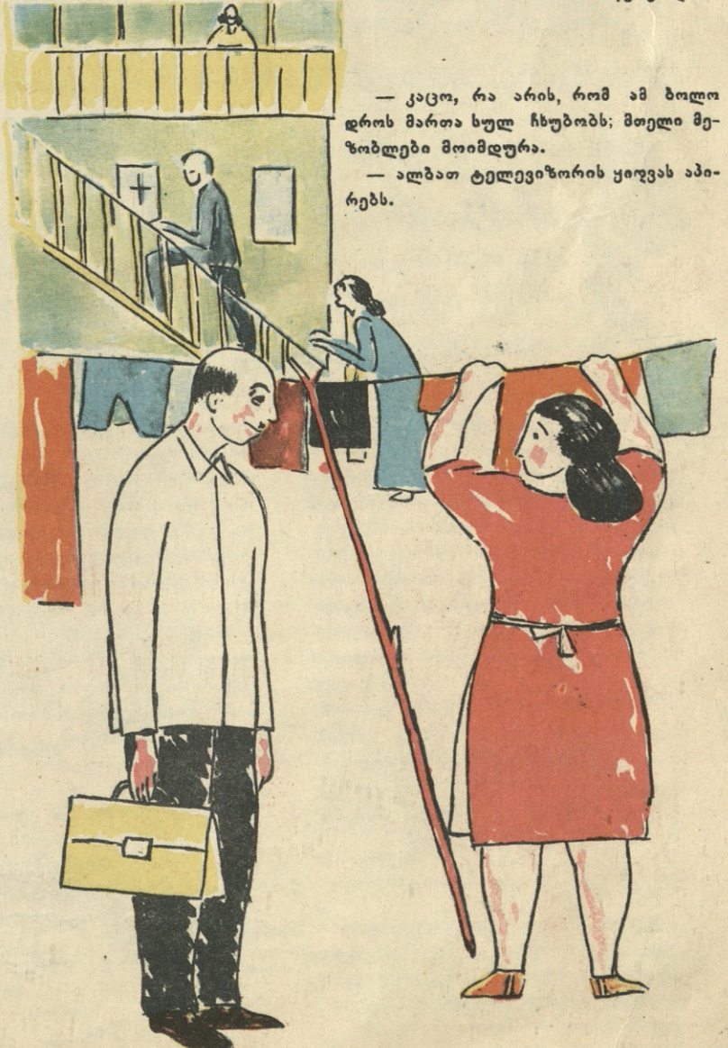
ნან. ზ. წერეთლისა.

— კაცო, რა არის, რომ ამ ბოლო დროს მართა ხულ ჩხუბობს; მთელი მეზობლები მოიმდურა. — ალბათ ტელევიზორის ყიფვას აპირებს.