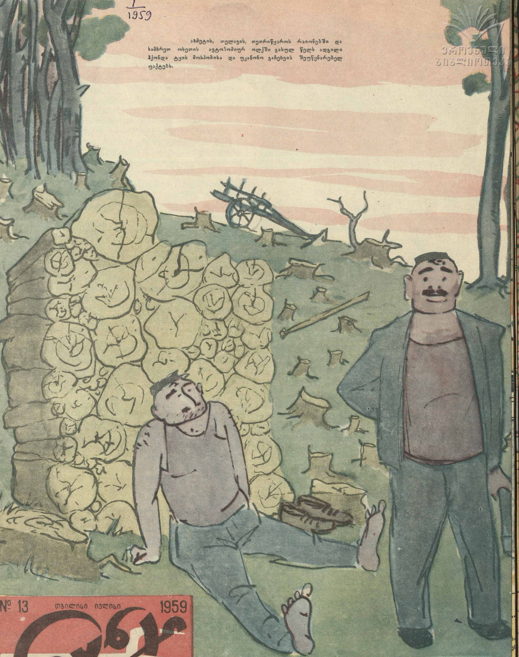
ნახ. ნ. მალაშვილისი