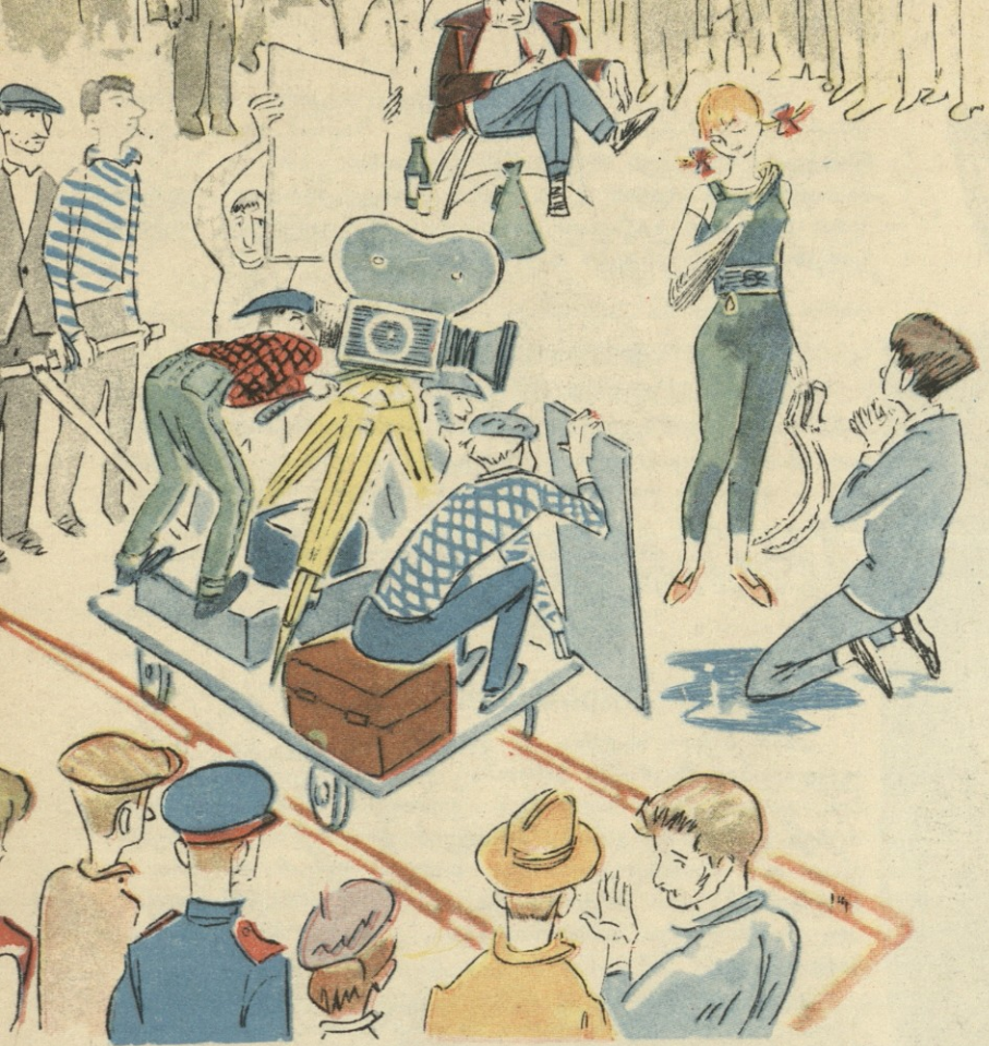
ნახ. ჯ. ლოლუა