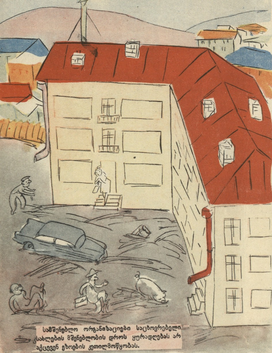
სამშენებლო ორგანიზაციები საცხოვრებელი სახლების მშენებლობის დროს ყურადღებას არ აქცევენ ეხოების კეთილმოწყობას.

კიდევ შეიძლება ამ დიალოგის გაგრძელება, მაგრამ მომხმარებელს ის უფრო აინტერესებს, სანამდე გაგრძელდება საჩუქრებისა და თბილისის ზოგიერთ სხვა მალაზიაში ამ ახალი მეთოდით ვაჭრობა და როდის დაასაჩუქრებენ იმ მუშაკებს, რომლებმაც საჩუქრების „საჩუქრებით“ გაყიდვა შემოიღეს.