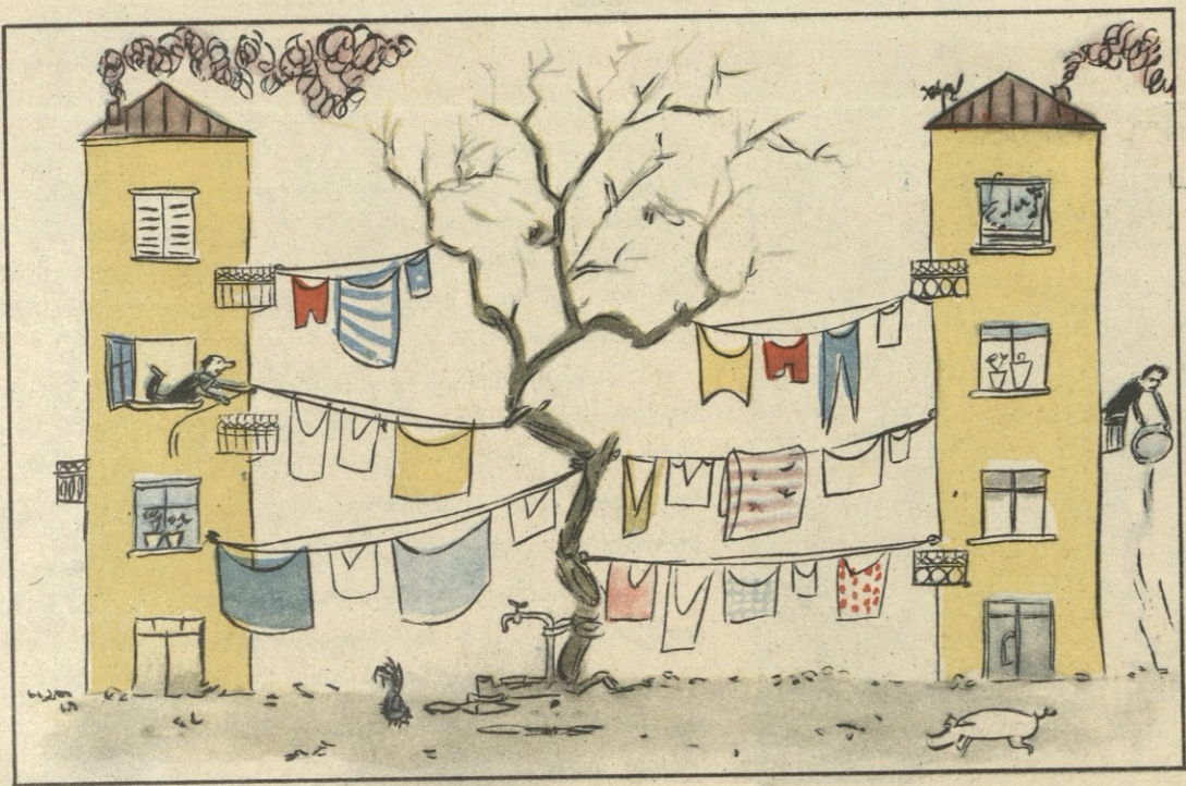
ნახ. ნ. მაღაზონიასი