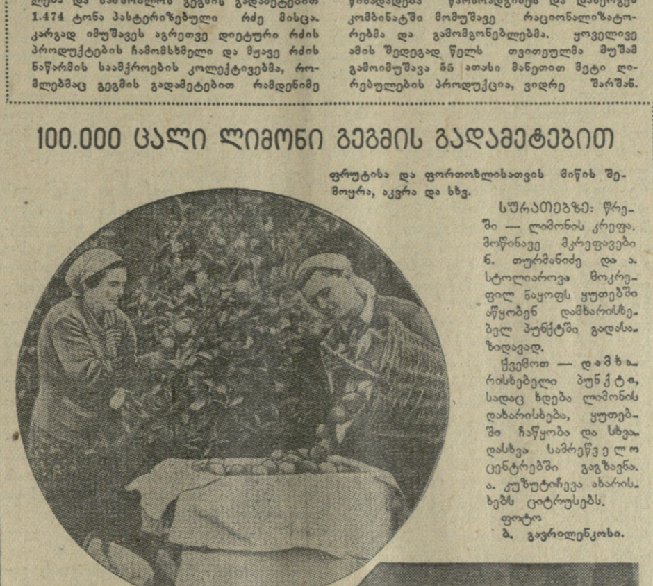
ფურცლისა და ფორთოხისათვის მიწის შემოყრა, აკრა და სხვ.