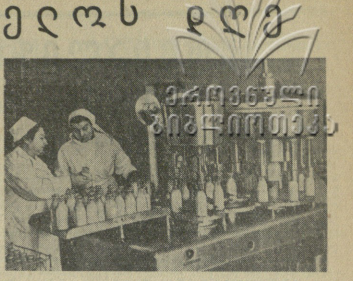
სახლითი კარგად არის მოწყობილი, უხვად მარაგდება მალაქისათვის პროდუქციით...