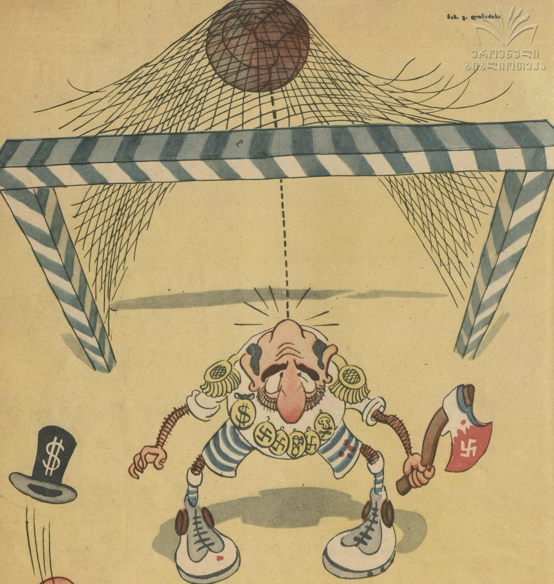
ზრანოს სპორტული ბრიუკი