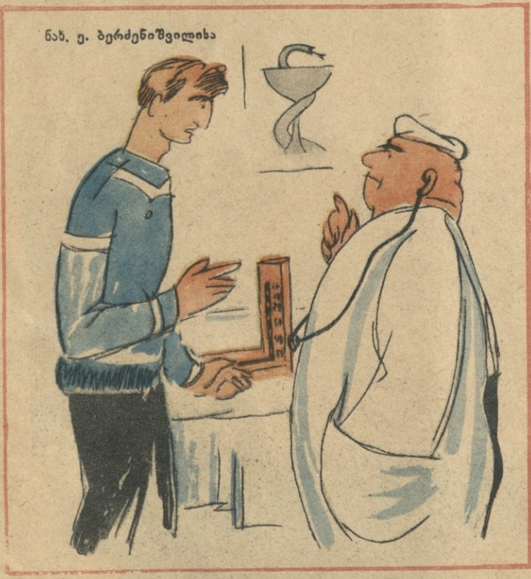
ნან. ე. ბერძენიშვილისა

— პათივცემული ექიმო... — ჯერ რა პათივი მეცით, ასე რომ მომმართავთ!