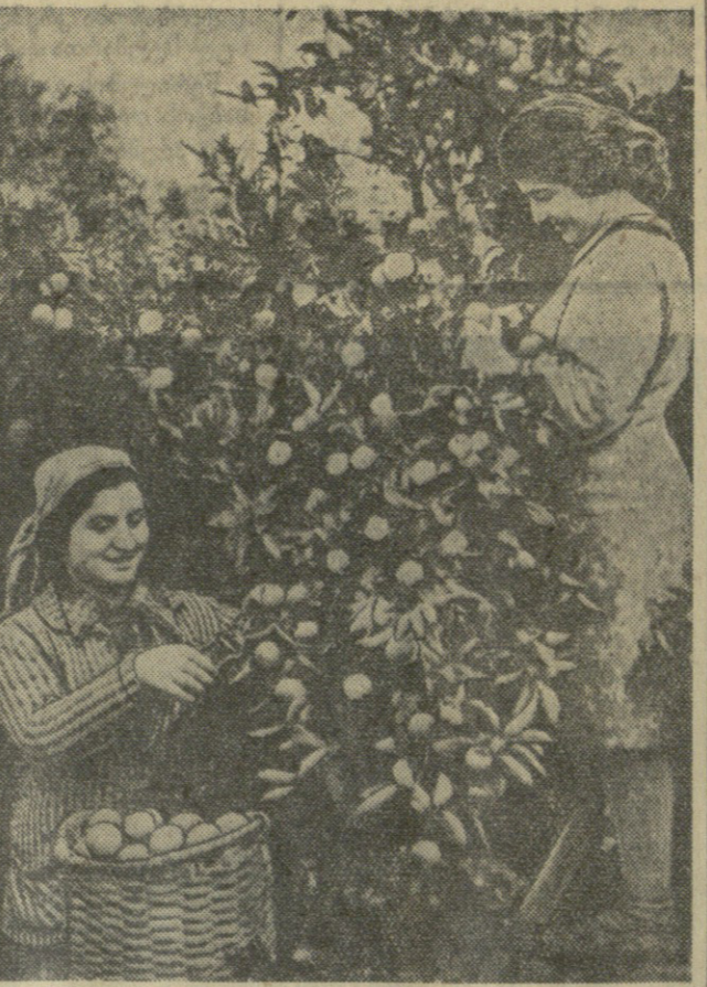
ქობულეთის რაიონის სოფელ ქობულეთის მანკარინის სახელობის კოლმეურნობის წევრია და დადგენილია შრომის დიდებული ნაყოფი გაიღო. მათ ცენტრსაველა კარგი მისაძალი მოიყვანეს...