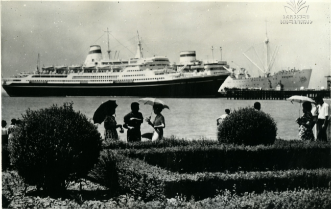
სოფლის უმჯობესი ხედი Вид на Сухумский порт