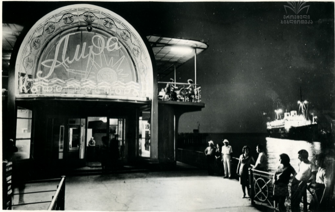
სოხუმი. კავა-კანკონიანი „ამრა“ Сухуми. Кафе-ресторан „Амра“