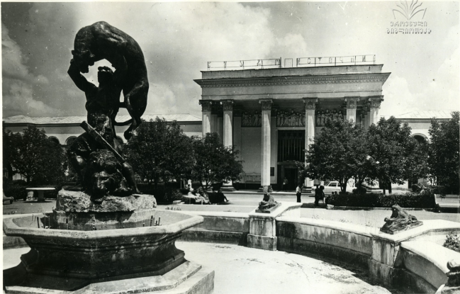
ბუაჩვავის ბუჩაკი № 6 Цхалтубო. Источник № 6