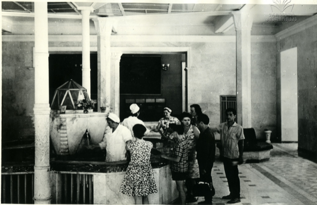
ბორჯომი. ერთ-ერთ წყაროსთან Боржоми. У одного из источников