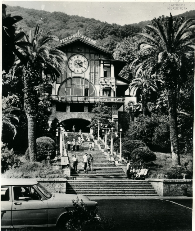
გაგრა. პანსიონატი „გაგრიში“ Гагра. Пансионат „Гагрипш“