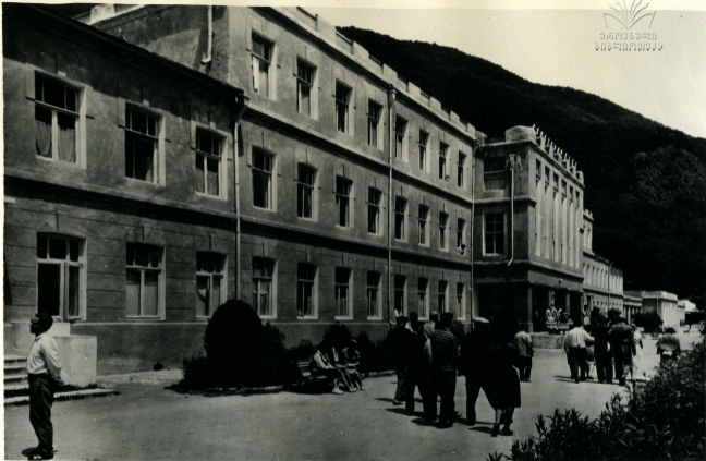
სამხრეთ ოსეთი. სანატორიანი „ძაუ“ Юго-Осетия. Санаторий „Дзау“