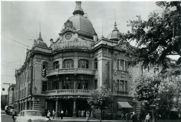
თბილისის უნივერსიტეტი Тбилисский универмаг