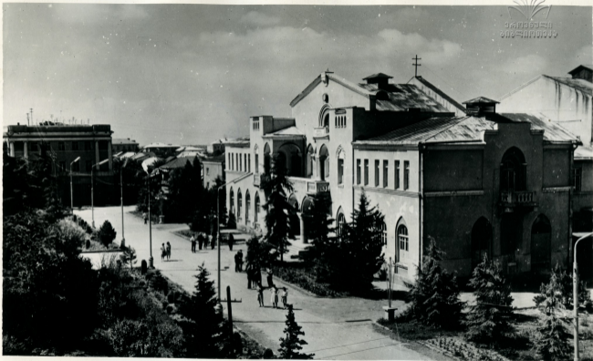
საბჭოთა ოსეთი. სენხვალის ერთ-ერთი კუთხე Юго-Осетия. Один из уголков города Цхинвали