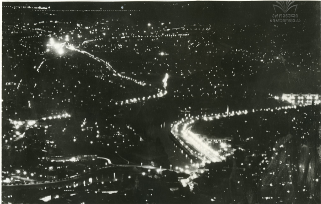
თბილისი ღამით Тбилиси ночью