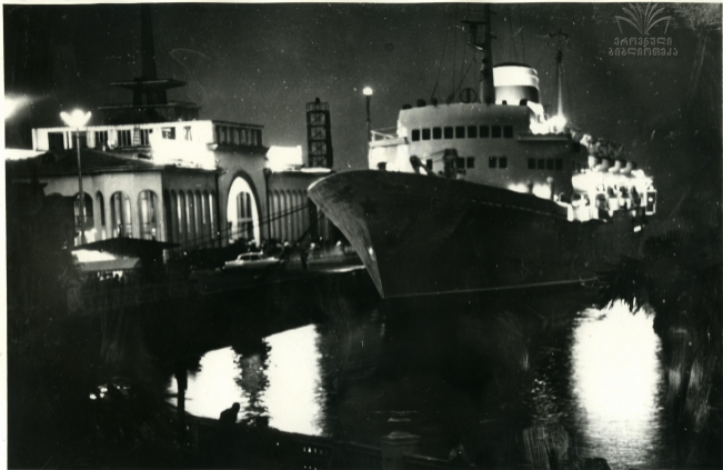
ბათუმის პორტი ღამით Батумский порт ночью