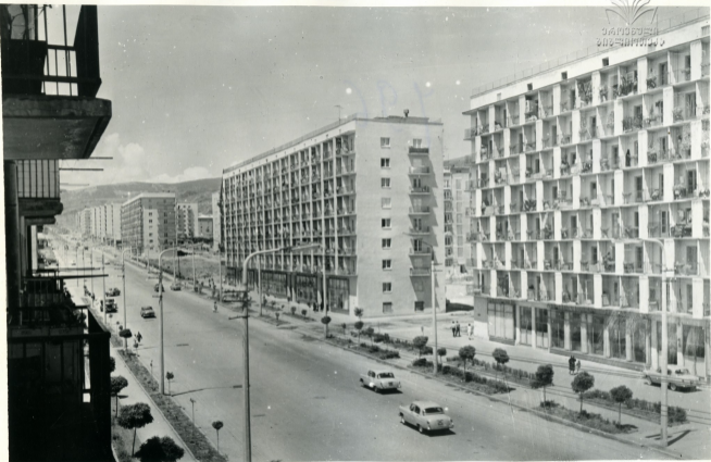
თბილისი. ვაჟა ფშაველას პროსპექტი Тбилиси. Проспект Важа Пшавела