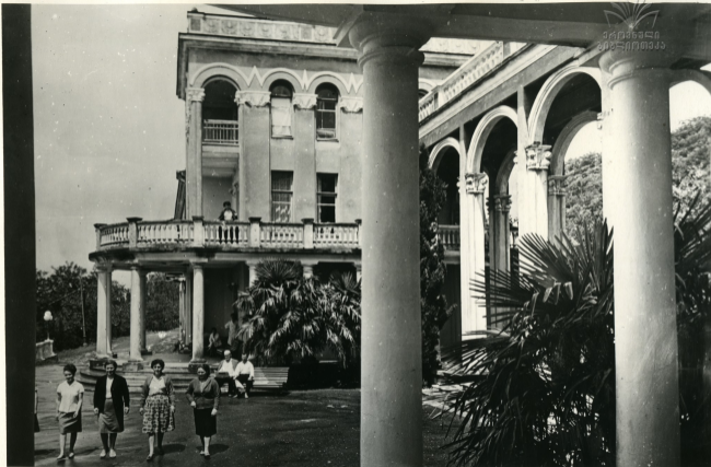
მთხეთის სასაზღვრო სასანიტორი „კოლხიდა“ Санаторий „Колхида“ в Мцхете