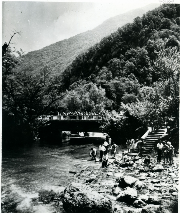
გზა ჩინაზა. ტისუჯი ჰაესთან Дорога на озеро Рица. У голубого озера