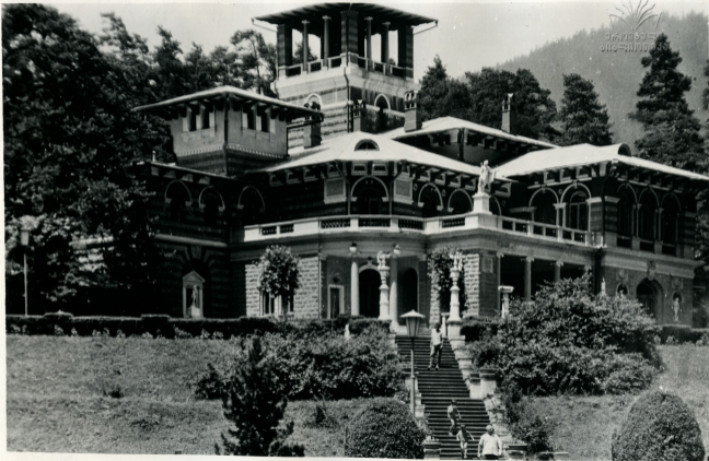
ბორჯომი. საბავშვოების ერთ-ერთი კორპუსი Боржомი. Один из корпусов санатория