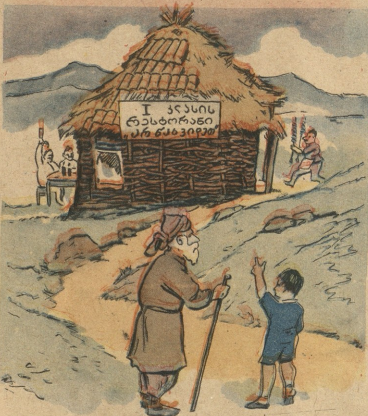
— ბაბუა, შენ რომ ამბობ, ძველად ფაცხაში ვცხოვრობდითო, მაშინაც რესტორანი იყო შიგ გახსნილი!

„შიკრიკი“? მაშ, ჩემი თანამშრომელი ყოფილა. ხშირად შემოვა ჩემს კაბინეტში, რაღაც ქაღალდებს შემომიტანს, რაღაც საქმეებს გავატან, გავგზავნი მეოთხე სართულზე, სადაც ჩვენი განყოფილების უფროსია. ჩავგზავნი მეორე სართულზე... ერიპა! თუმცა რას ვამბობ, ასეთ ანგელოსს ასე სარბენლად როგორ გავიძებნებდი!