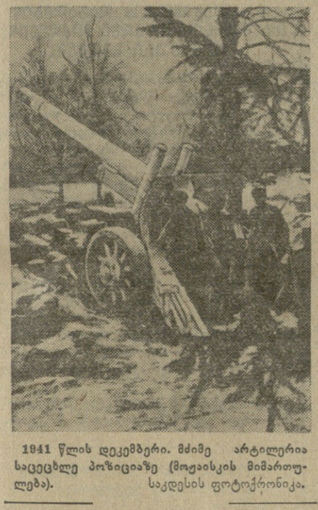
1941 წლის დეკემბერში. მძიმე არტილერიის საცდელი პოზიციები (მოკლად მინიშნულია) საცდის ფორტოქონიკა.