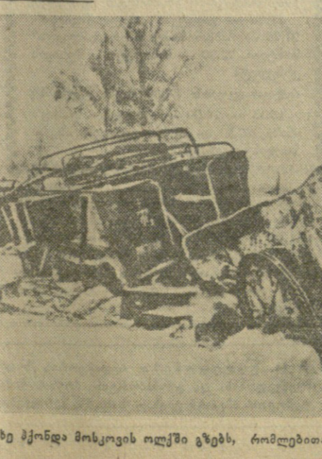
სხვა სახე ქონდა მოსკოვის ილქში ზღებს, რომლებშიც უკან იხედდნენ გერმანელები. საცდის ფორტოქონიკა.