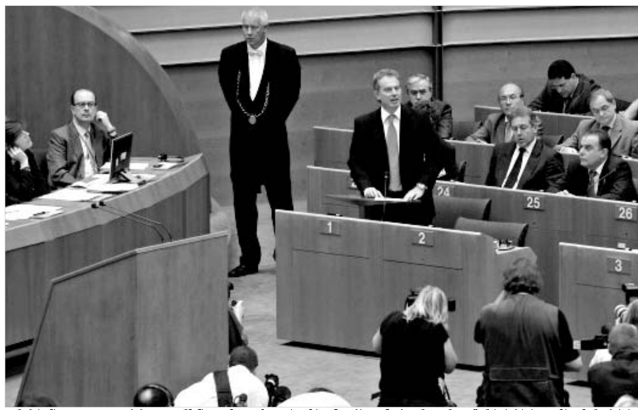
ევროპის მთლიან ცვლილებებზე გადაწყვეტილება - ამ დეკლარაციას ტონი ბლერი ევროკავშირის საბჭოს თავმჯდომარეობისას