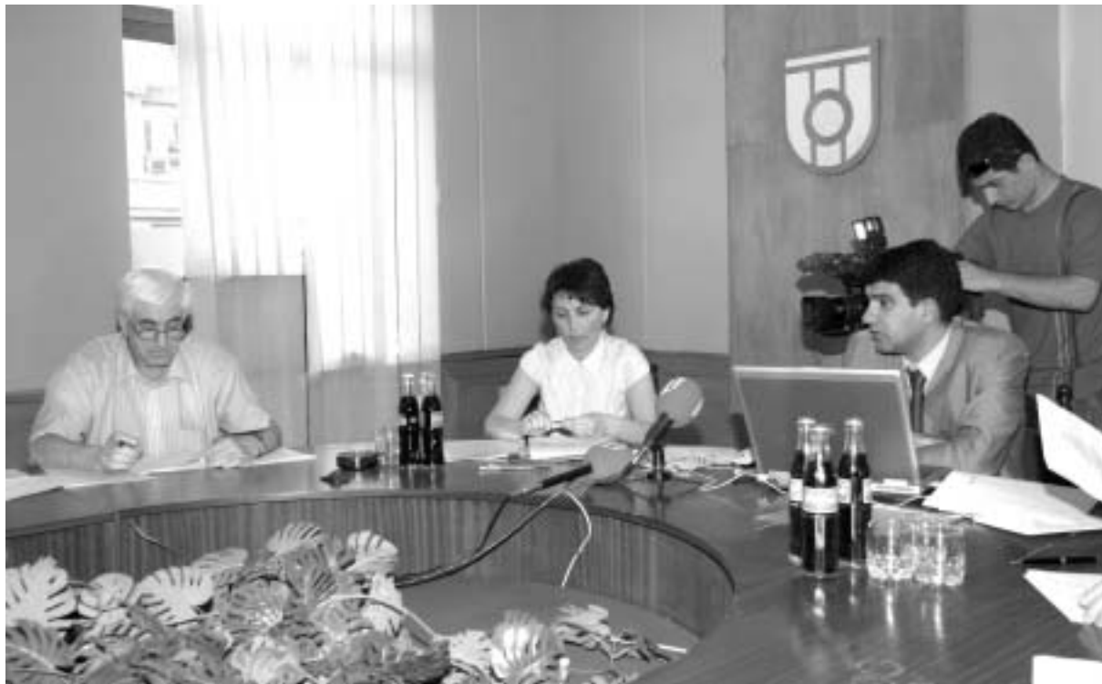
სამეურნეო საბჭო მუშაობს.

რა არის ამის მიზეზი? დაახლოებით ორი-სამი კვირის წინ პარლამენტმა მომავალი საზოგადოებრივი ტელევიზიის სამეთვალყურეო საბჭოსთვის საქართველოს პრეზიდენტის მიერ დასახელებული კანდიდატები აირჩია. კანდიდატურების უმრავლესობა, პუნებრივია, როგორც ყველა კომისიამ, საბჭოში თუ ბორდში (ყველა კრებით ადგილას, სადაც კენჭისყრით წყდება სტრატეგიული საკითხები) ერთმნიშვნელოვნად პრეზიდენტის ექვემდებარება (ბუნებრივია, უმრავლესობას ვგულისხმობ) და სამწუხაროდ დამოუკიდებელი ორგანოს არ წარმოადგინეს. აქაც, ანუ საზოგადოებრივი ტელევიზიის სამეთვალყურეო საბჭოში სწორედ საკავშირის ფაქტორები მოხდნენ, ამიტომ სამი