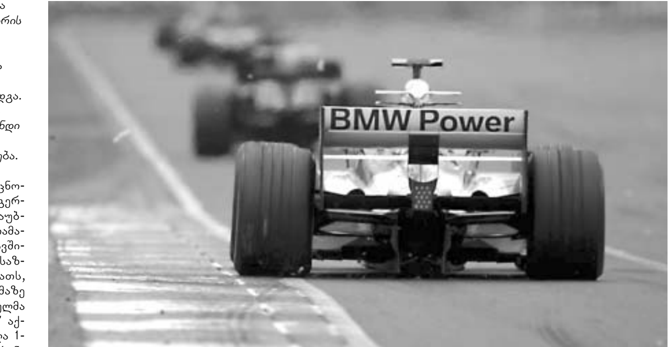
ზემ-2 "უილიამსს" ზურჯი შეაქვია.

გერმანულმა ავტოკონსტრუქტორმა BMW-მ ფორმულა 1-ის ბინადრის "ზაუბერის" საჯინიბოს შესყიდვის თაობაზე ოფიციალურად განაცხადა და სამეფო რბოლებისკენ მნიშვნელოვანი ნაბიჯი გადადგა. მომავალი სეზონიდან BMW-ს ფორმულა 1-ში საკუთარი გუნდი ეყოლება, გუნდი, რომელიც "ზაუბერთან" ერთად შეიქმნება.