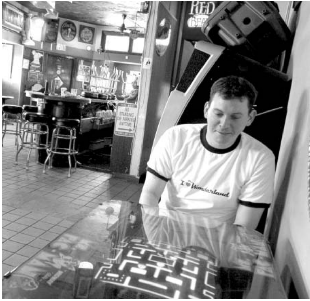
ფექ-მენი ყველგან თამაშობენ.

25 წელი... მშვენიერი ასაკია, თითქოს ბევრიც არის და წინ კიდევ რამდენია გასავალი. "ფექ-მენი" ასე ფიქრობს. დაიბა, "ფექ-მენი" სასაცილო მოჩვენებების - იჩი, ბლიტი, ფიჭი და ქლაიდის ოთხეული. ისინი წელს 25 წლის გახდნენ და, სხვა კომპიუტერული თამაშებისგან განსხვავებით, თავს მოხუცებად სულაც არ გრძნობენ. არც პოსტი-ნივჯურულ კრიზისს განიცდიან. პირიქით, 25 წლის ასაკში "ფექ-მენი" მეორედ დაიბადა და მობილური ტელეფონების საყვარელ თამაშად იქცა. წელს მას გინესის მსოფლიო რეკორდების წიგნშიც ყველა დროის ნომერ პირველ ჩეტობატის თამაშად შეიტანენ. იაკაგოს მეცნიერებისა და ინდუსტრიის მუზეუმში კი მას სექტემბრამდე გამოფენასაც მიუძღვნინან, სათაურით "თამაში დაიწყო". ზაფხულის პოლოს კი კომპანია Namco - პირველი "ფექ-მენის" დისტრიბუტორი 3-განზომილებიანი სივრცეში გაკეთებულ "ფექ-მენის" გამოუშვებს. კომპანიის გენერალური მენეჯერი სკოტ რუბინი "ფექ-მენის" დიდხანს სიცოცხლეს უსურვებს და მისი წარმატების საიდუმლოს ასე ხსნის: