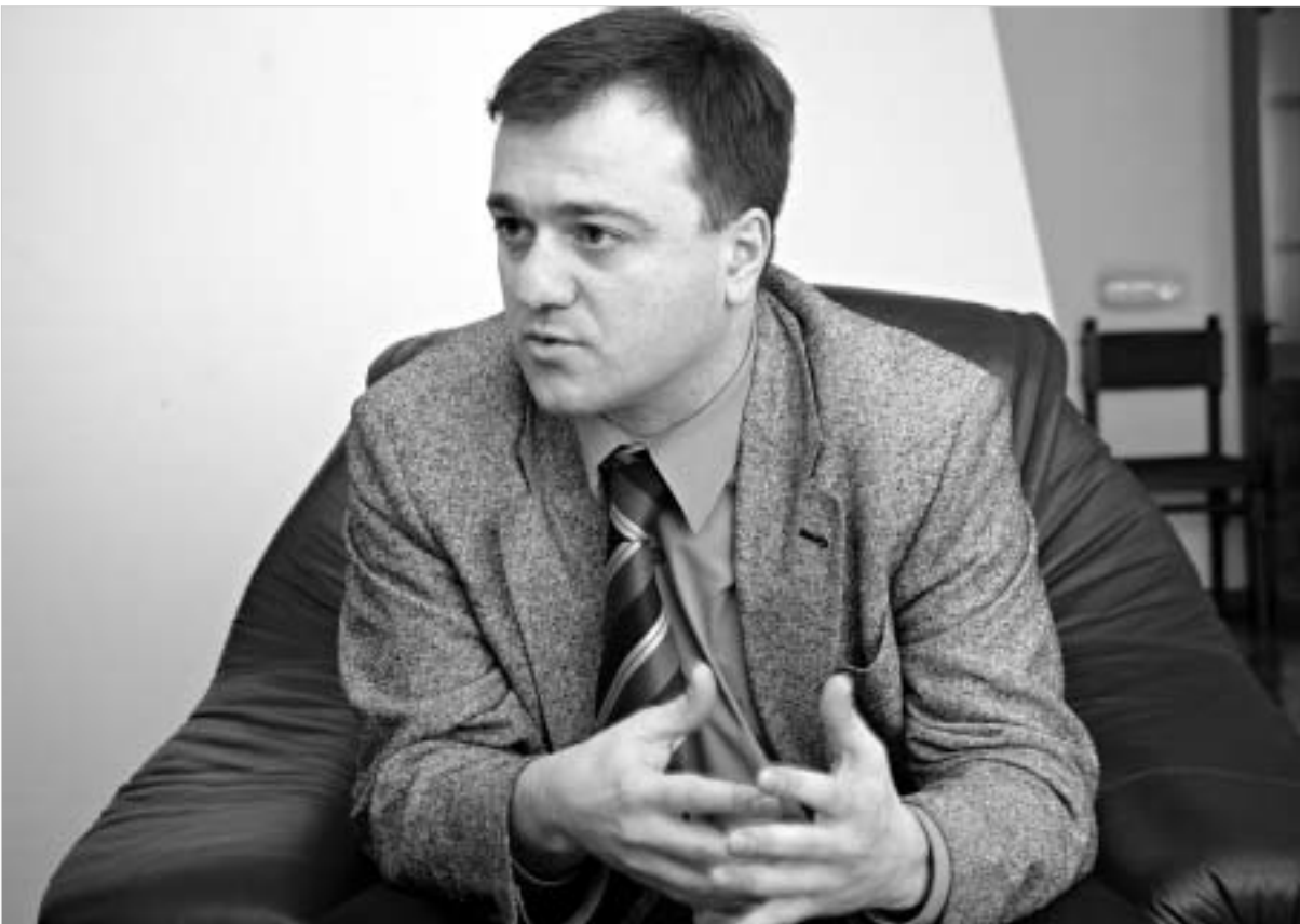
სამი ობიექტი კონკურსის საფუძველზე გაიყიდა და ორი, ყველაზე მსხვილი ობიექტი, პირდაპირი გაყიდვის გზით - "საქტელკომი" (5 მლნ

ბოლო პერიოდში პრივატიზაცია აუქციონების გზით განხორციელდა, ძირითადად, წვრილი ობიექტების გაყიდვით და პირდაპირი გაყიდვის წესით კონკურსების მიხედვით. აუქციონზე გაიყიდა 30 ობიექტი. თანხმ, რომელიც ბიუჯეტში შევიდა წვრილი ობიექტების პრივატიზაციიდან, 36-37 მლნ ლარი შეადგინა.