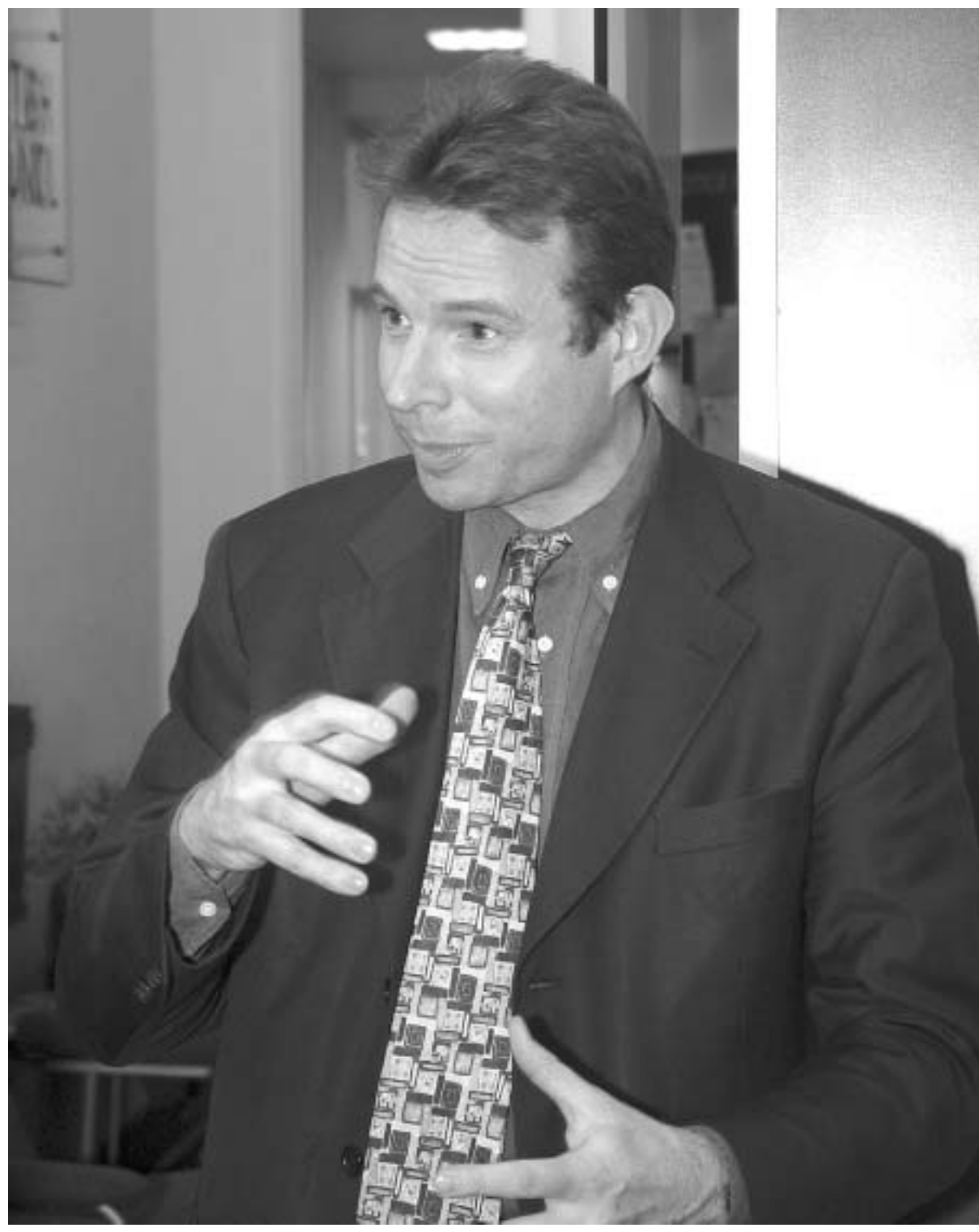
თუ საქართველოს სურს, ნამდვილად დემოკრატიულ ქვეყნად აღიქვან, თქვენ გჭირდებათ თავისუფალი მედია, მეტი პლურალიზმი, აზრის მეტი მრავალფეროვნება.

სამეზობლო, საქართველოში იცოვებ ხდება, ეს კი ნამდვილად არ არის დემოკრატიის ნაწილი. დემოკრატიული ქვეყანაში ტელევიზია ყოველთვის არ აჩვენებს პრეზიდენტის გამოსვლებს და ისინი საკუთარ თავს მისი კრიტიკის უფლებასაც აძლევენ.