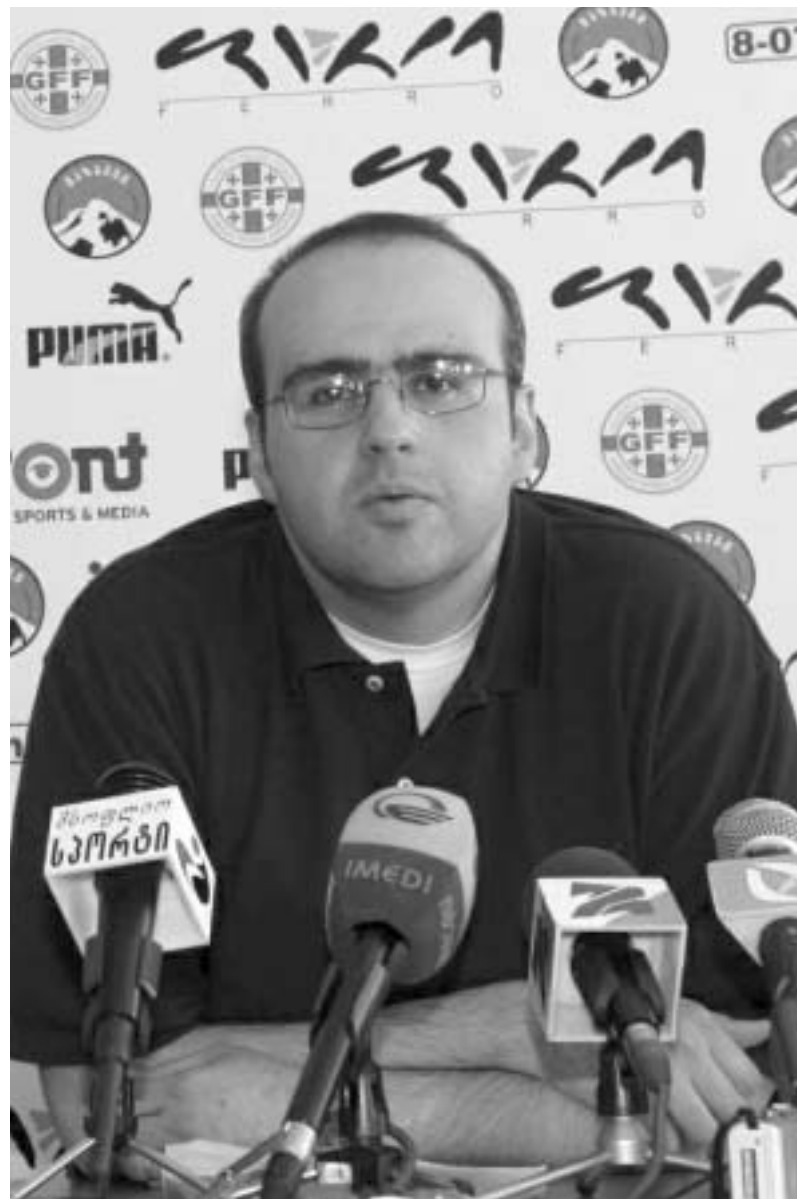
სფფ-ის პრეზიდენტი ნოდარ ახალკაცია პრესკონფერენციაზე.