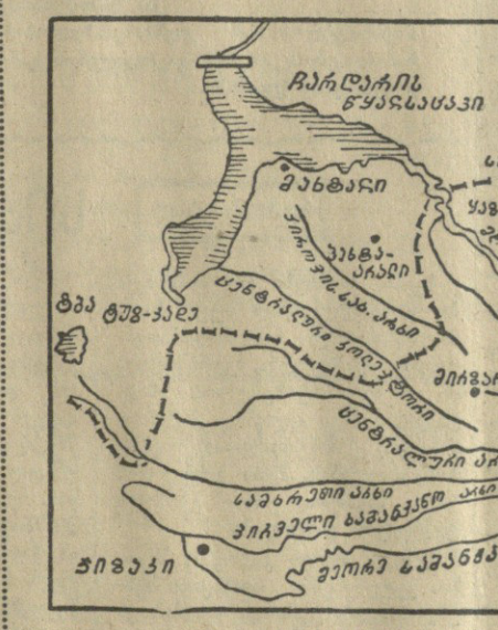
გოლანდია სტეპის მორწყვის სქემა.