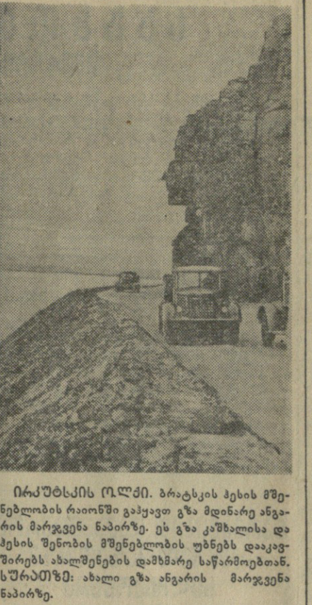
ირაუსის რკ. პრეტის ქვის მშენებლობის რაიონში გაყვანილია გზის მანქანა...