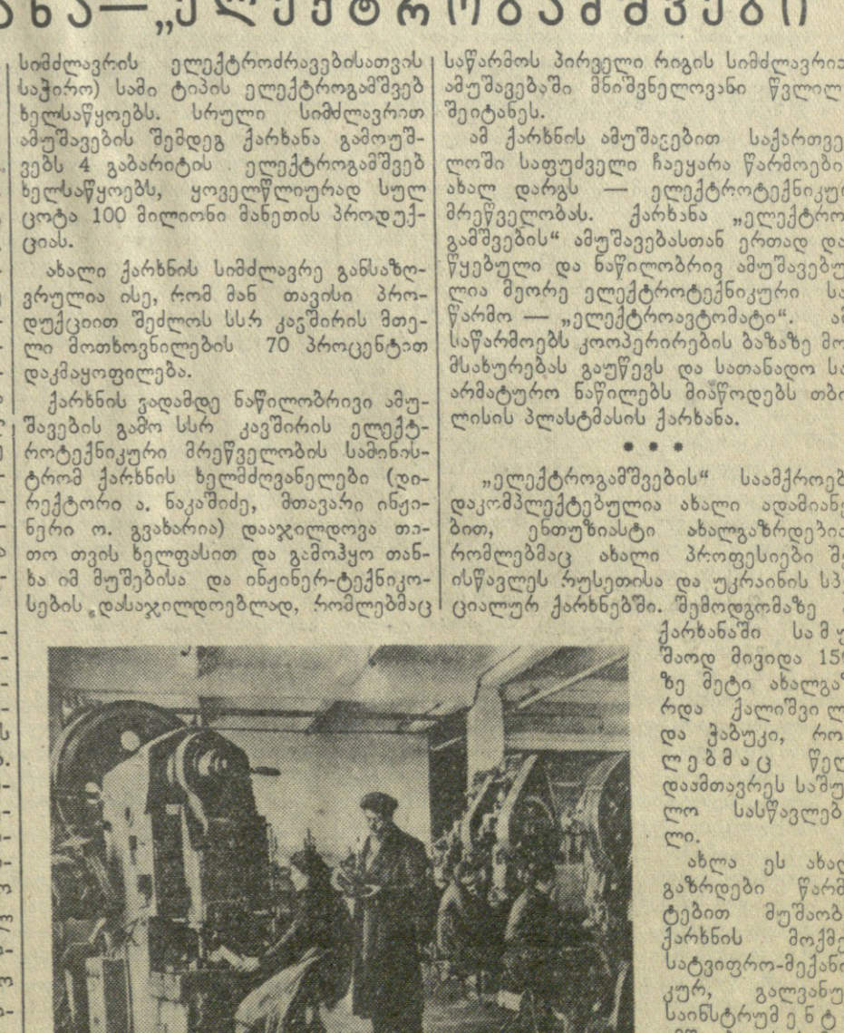
სურათში: სატვირთო სააქროს ხელი, წინა კლანჭი უფროსი ოსტატი გ. ვარაძის მიერ...