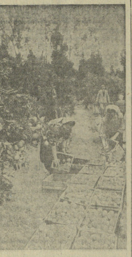
უპარის ასრ. კომპლექსურნიშებულება და საბჭოთა მეურნეობებში მიმდინარეობს ცენტრების...