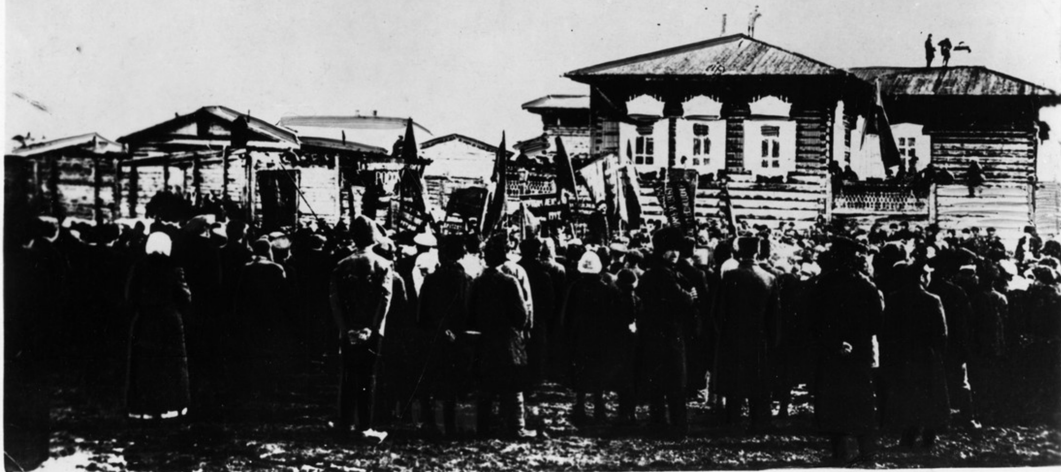
Якутская тюрьма, якутская ссылка, где томились многие борцы против царского самодержавия. В мае 1917 года здесь состоялся многолюдный митинг борцов за рабочее дело с участием Г. К. Орджоникидзе, Е. М. Ярославского и других ссыльных большевиков.