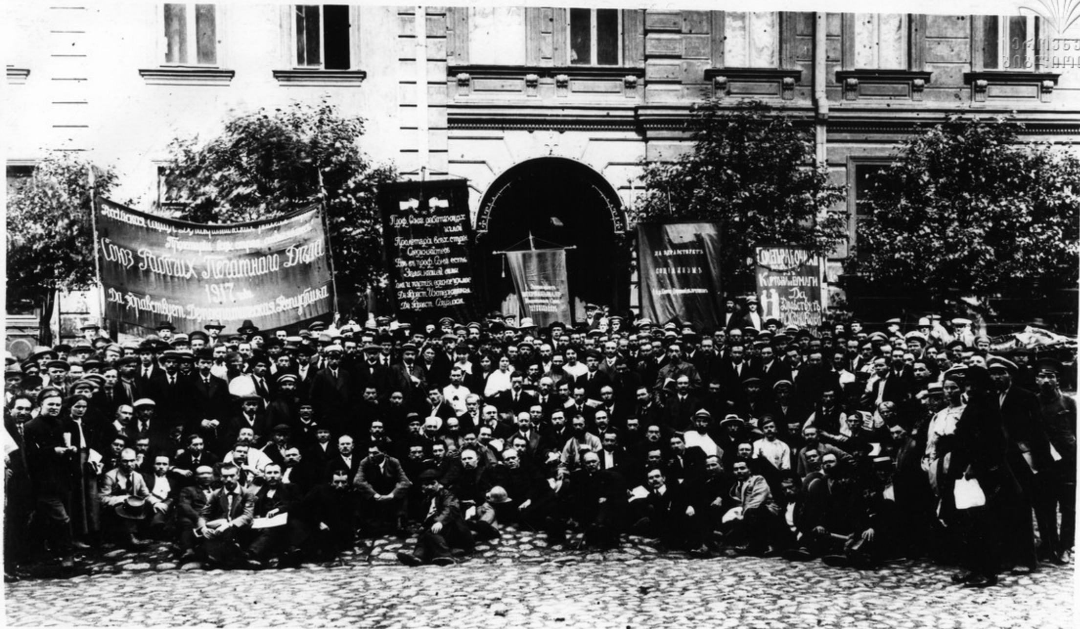
Третья Всероссийская конференция профессиональных союзов (20 – 28 июня 1917 г.) в Петрограде. Делегаты конференции представляли 1.400.000 членов профсоюзов. Были приняты решения о необходимости декретирования 8-часового рабочего дня для всех предприятий, о борьбе с безработицей, об охране женского труда и т. п. Работа конференции – одна из вех на пути усиления влияния большевиков в массах.