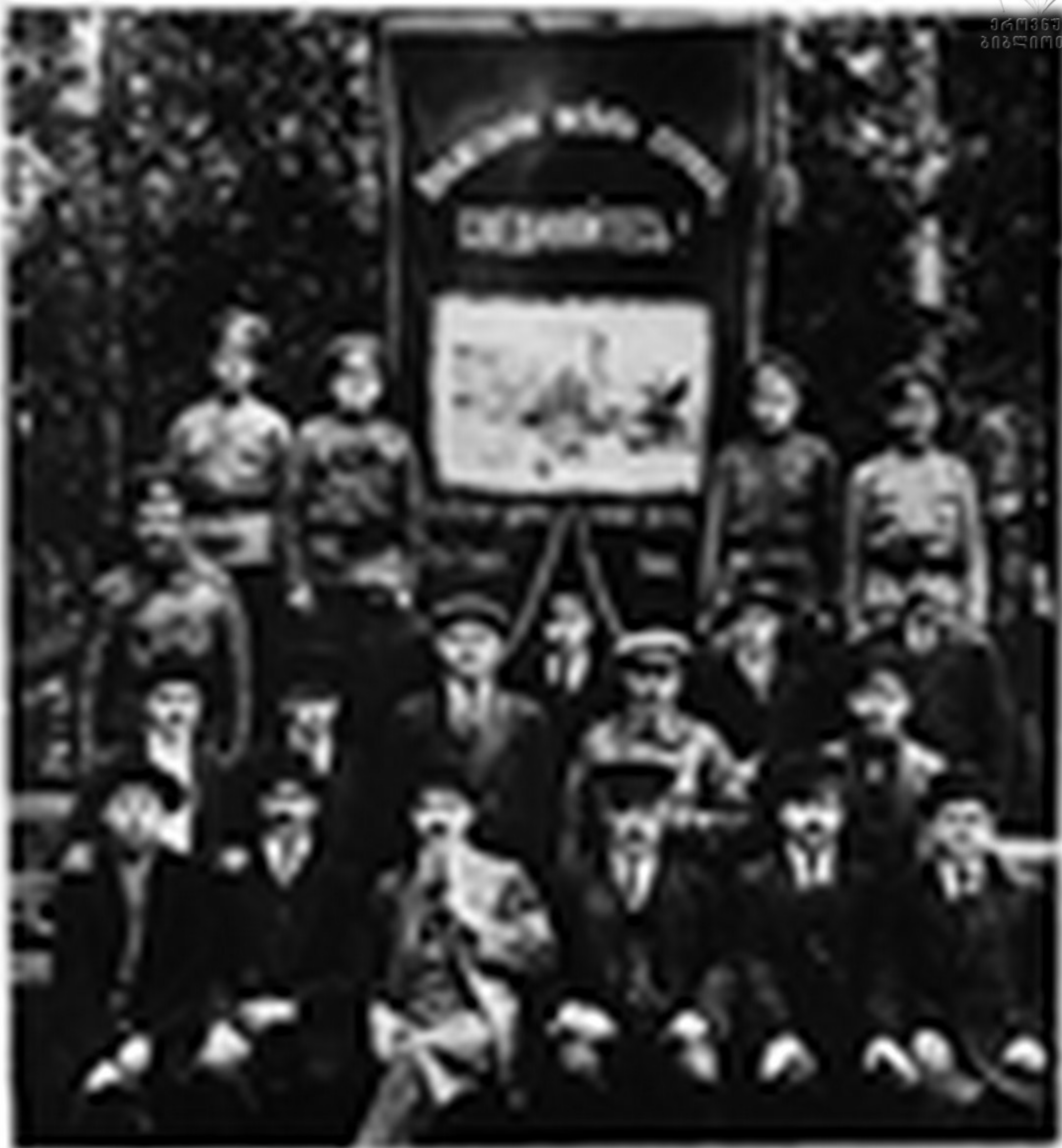
სამხალისო სკოლის ბუნების კრებულში მონაწილე ბავშვების დიდი ზღაპარითა და სიმღერით. ბუნების კრებულს ესტუმრა 2000 მკითხველი. „ბუნების კრებულს“ მონაწილე „ბუნების“ ბუნების კრებულს მონაწილე ბავშვები მონაწილეობენ, ის ბუნების კრებულს ესტუმრა. ბუნების კრებულს მონაწილეობენ, ის ბუნების კრებულს ესტუმრა, ა მონაწილეობენ.