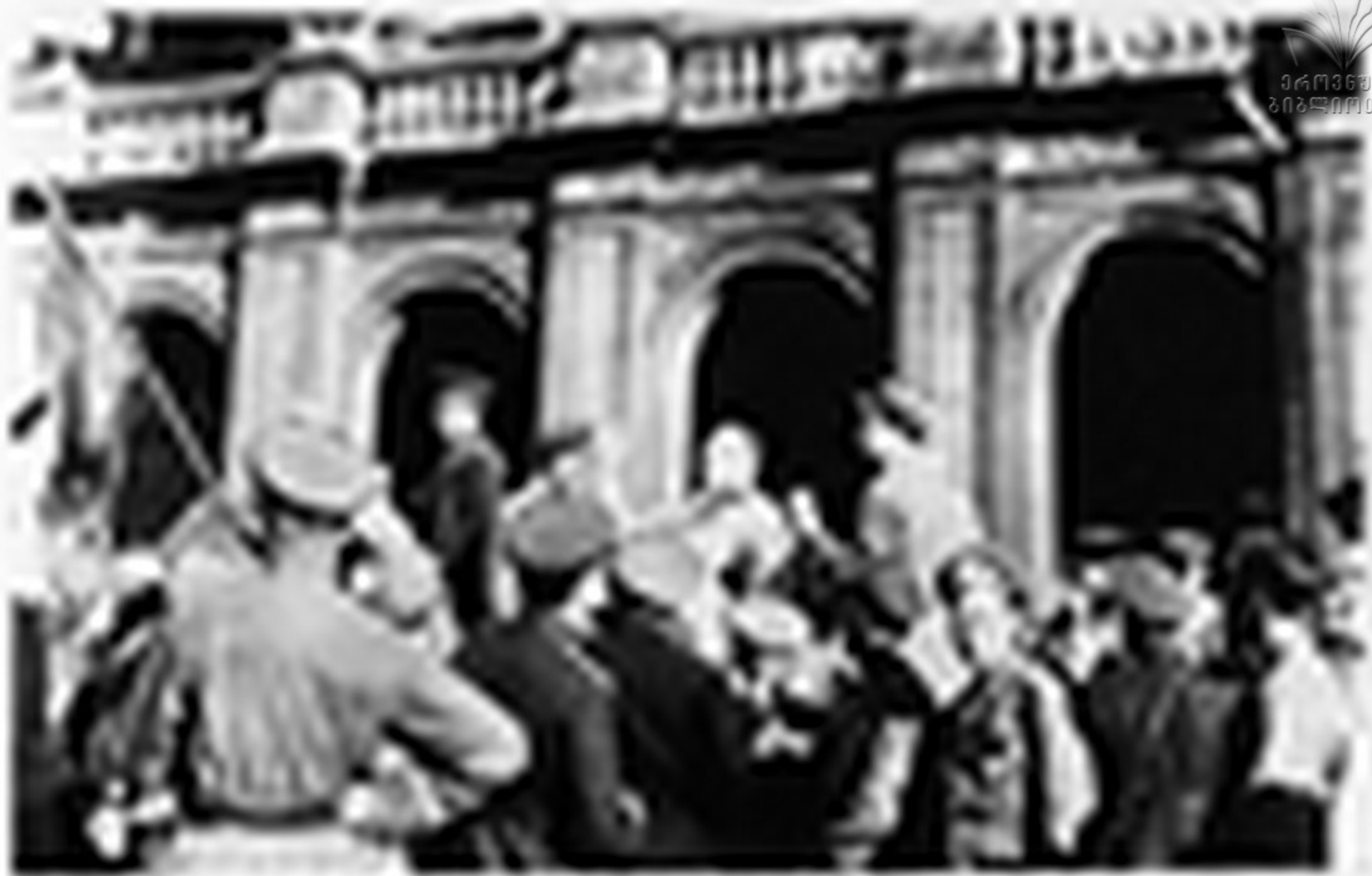
საქართველოს მხარეთმცოდნეო ინსტიტუტის მიერ მომზადებულია ქვემოთ მოხსენიებული წიგნების ბიბლიოთეკის შედგენა. წიგნების სახეები და ავტორების სახელები ქვემოთ მოხსენიებულია. თბილისი და დასრულებულია. თბილისი ბიბლიოთეკის მიერ მომზადებულია. 1919 წლის იანვარი. თბილისი ბიბლიოთეკის მიერ მომზადებულია. 1919