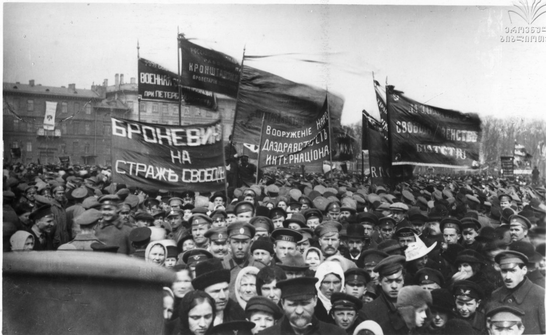
Члены Военной организации при Петроградском Комитете большевистской партии на первомайской демонстрации.