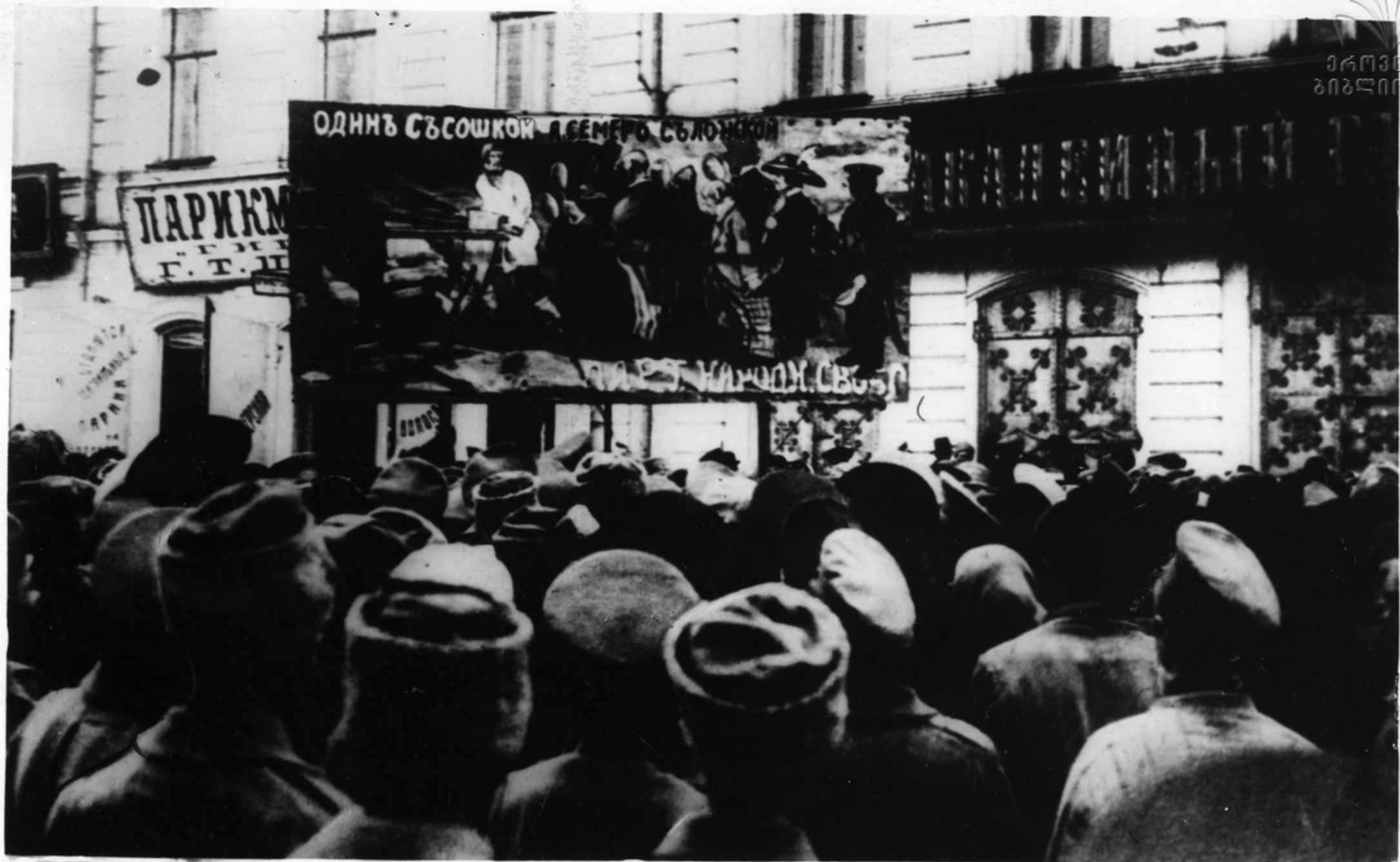
Манифестация солдат Томского гарнизона перед выборами в городскую Думу. На плакате карикатура на партию „Народной Свободы“. Какие только названия своим партиям ни давали вожди буржуазии! Однако народные массы оценивали партии по их делам. „Один с сошкой, а семеро с ложкой“ — партия „Народной Свободы“ — к такому выводу пришли солдаты.