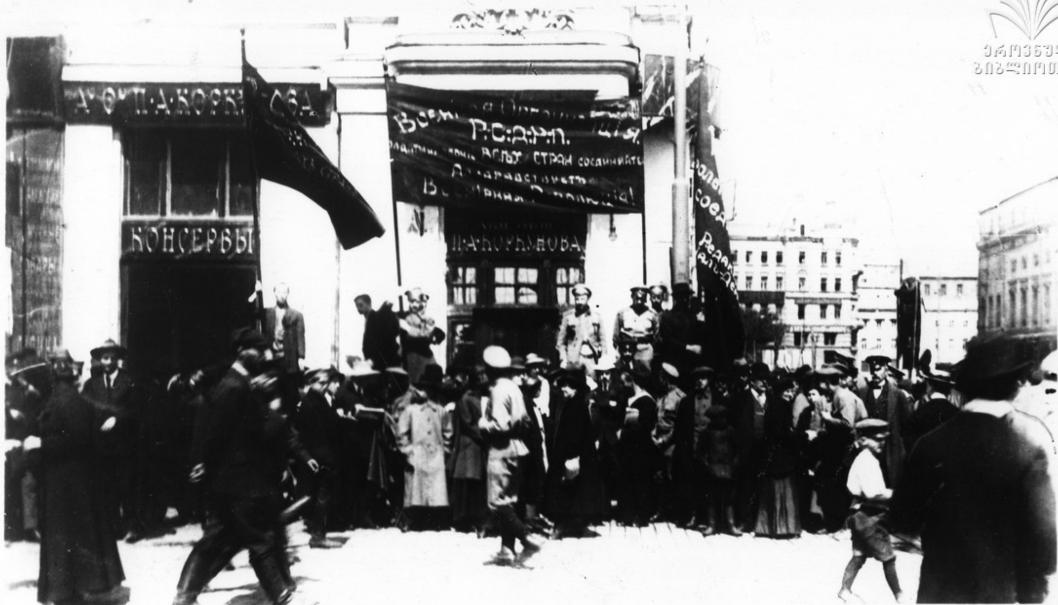
Первомайская демонстрация в Москве (угол Охотного ряда и Театральной площади). Демонстранты со знаменем Военной организации при Московском Комитете большевистской партии. На знамени лозунги: „Пролетарии всех стран, соединяйтесь!“, „Да здравствует всемирная революция!“. Справа — знамя редакции газеты „Социал-Демократ“, органа Московского Комитета РСДРП(б).