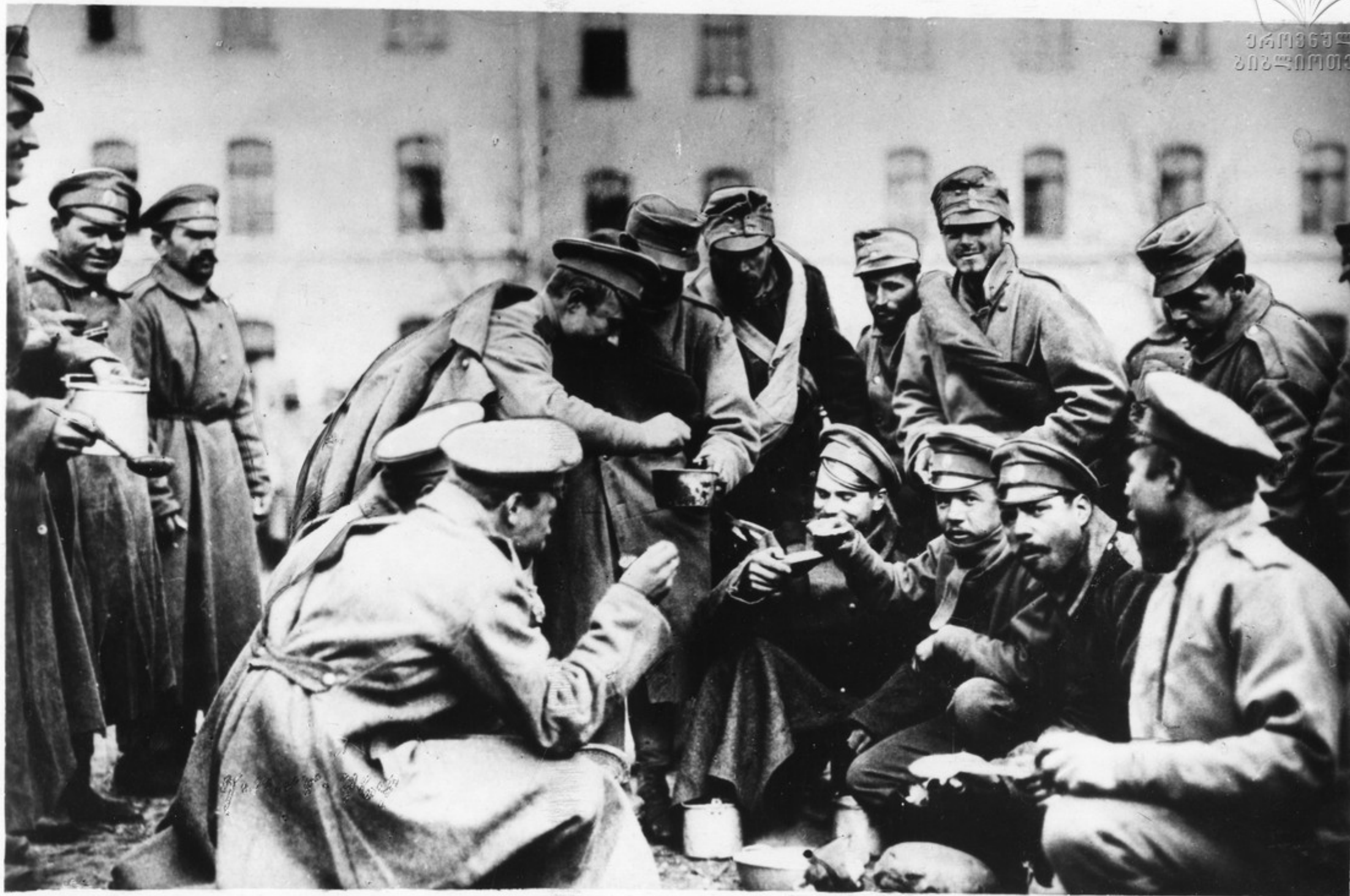
Братание на фронте солдат воюющих стран. Русские воины отливают австро-венгерским солдатам суп. Они объявили войну... братоубийственной войне.