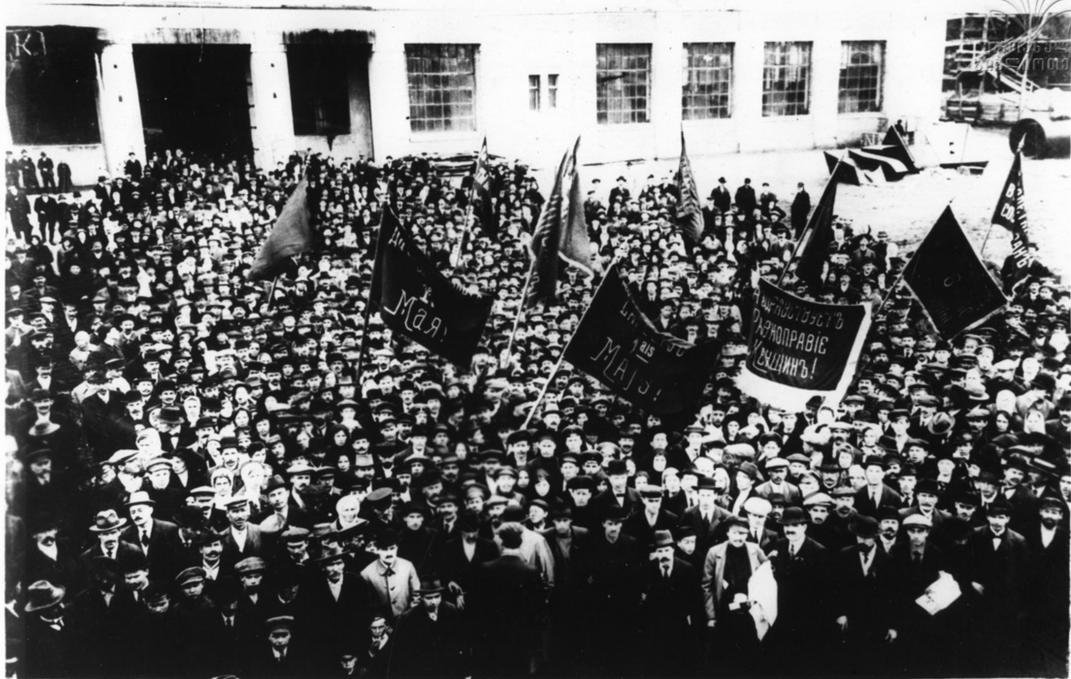
Рабочие Харьковского завода ВЭК выходят на первомайскую демонстрацию. В 1917 году трудящиеся России впервые свободно праздновали 1 Мая. В этот день во всех концах страны были проведены массовые митинги и собрания.