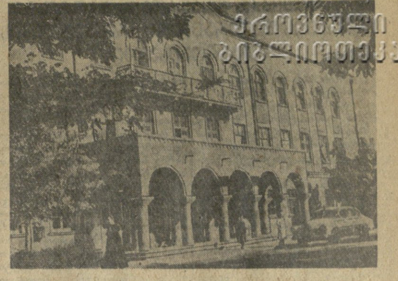
პოლიტექნიკის ახალი კორპუსი.