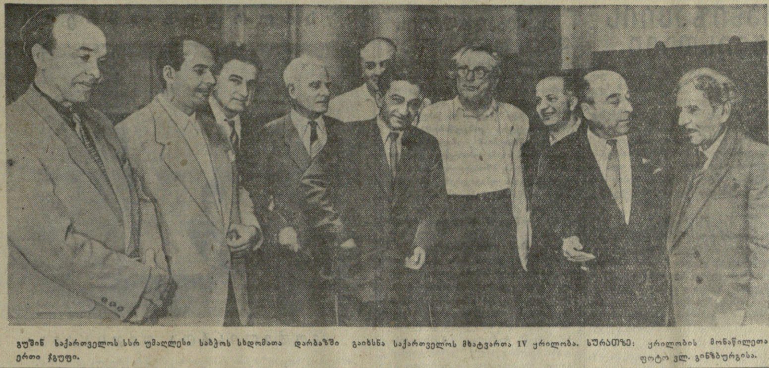
გუშინ საქართველოს სსრ უმაღლესი საბჭოს სხდომაზე დარბაზში გახიზნა საქართველოს მხატვართა IV ყრილობა. სპარტაში: კრილოვის მინაწილეთა ფოტო ვლ. ვანდურგისა.