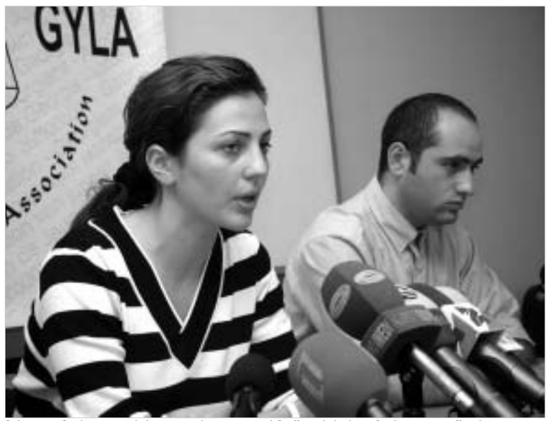
"ახალგაზრდა იურისტთა ასოციაციის" წევრების აზრით, დაუშვებელია რუსთაველის გამზირზე აყვანილი პირების სისხლის სამართლის პასუხისმგებლობა მიეცეს.

რუსთაველის პროსპექტზე მომხდარი ინციდენტის შესახებ არასამთავრობო ორგანიზაციათა მოსაზრება ორად გაიყო. ერთი ნაწილის აზრით, სპორტსმენების მიერ რუსთაველის პროსპექტის გადაკეცვას სამართალდამცველთა სწორი რეაქცია მოჰყვა, საუბარია პიკეტის დაშლაზე. მეორე ნაწილი კი მიიჩნევს, რომ ძალადობრივად ძალის დემონსტრირება მოახდინეს, მანიფესტანტების დაშლისას უფლებამოსილებას გადაამტკიცეს.