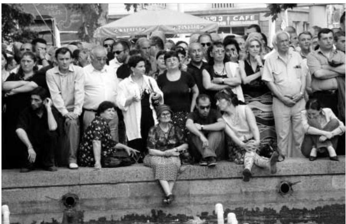
რევოლუციის შემდეგ თბილისის საზოგადოებამ პირველად 'დაქაშნიკა' გაერთიანებულ ოპოზიციის მიტინგი.