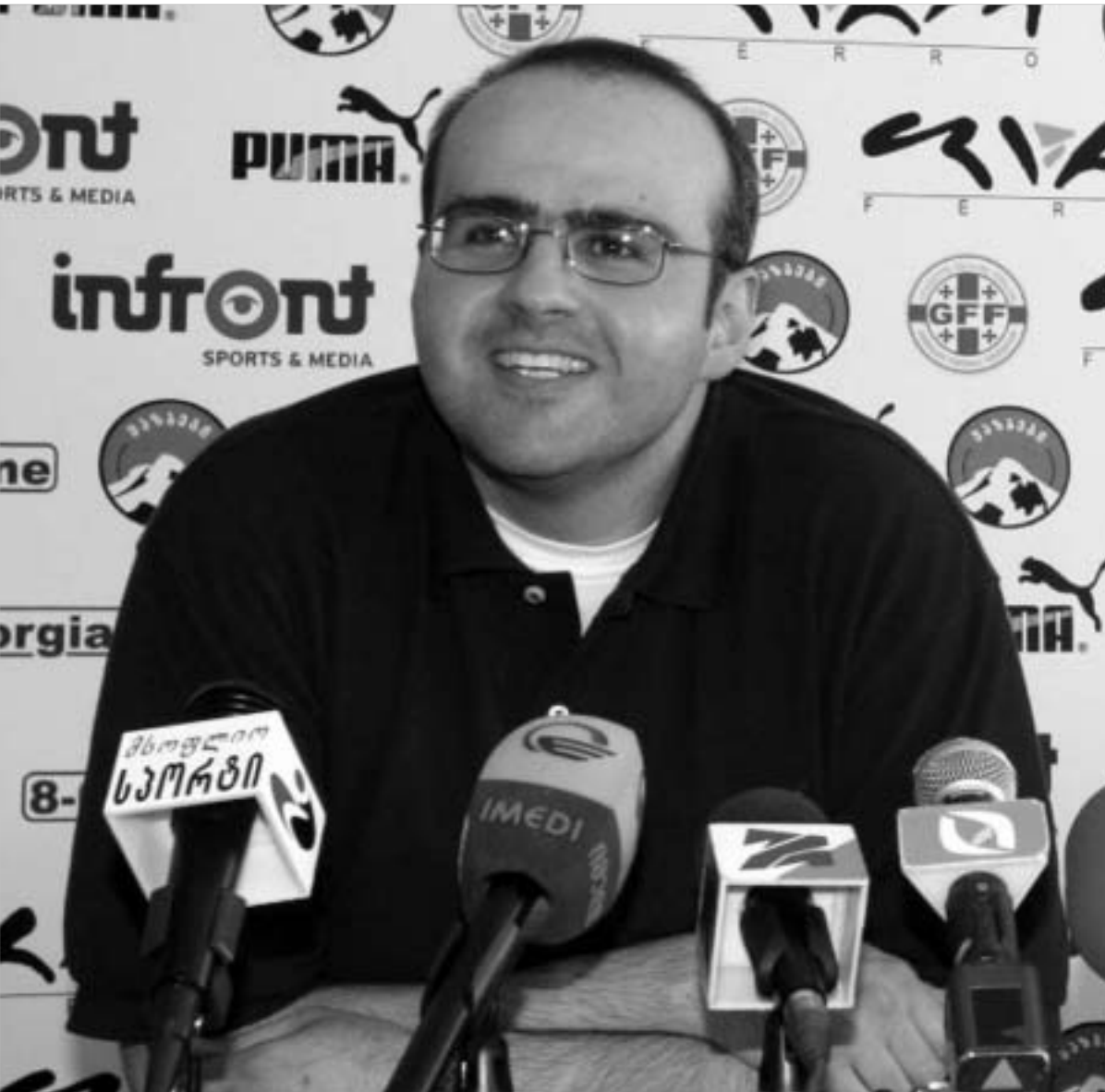
ნოდარ ახალკაცი პრეზიდენტი ლიგასთან ერთად საქართველოს ჩემპიონატის ახალ ფორმატზე შეშვას.

ზუსტად ერთ თვეში, 30 ივლისს, სტარტს აიღებს საქართველოს მე-17 ჩემპიონატი ფეხბურთში უმაღლესი ლიგის გუნდებს შორის. ჯერჯერობით ჩემპიონატის მხოლოდ დაწყების თარიღი არის ცნობილი. სხვა ყველაფერი, კერძოდ, კალენდარი, მონაწილე გუნდების რაოდენობა და ვინაობა გარკვეული არ არის. საქართველოს ფეხბურთის ფედერაციის მისი პრეზიდენტის ნოდარ ახალკაცის თანხმობით და საქართველოს ფეხბურთის პროფესიულ ლიგას ფორსმაჟორულ ვითარებაში, სულ 2-3 კვირაში მოუწევს მომავალი ჩემპიონატის რეგლამენტი-სა და მონაწილეთა რაოდენობის განსაზღვრა.