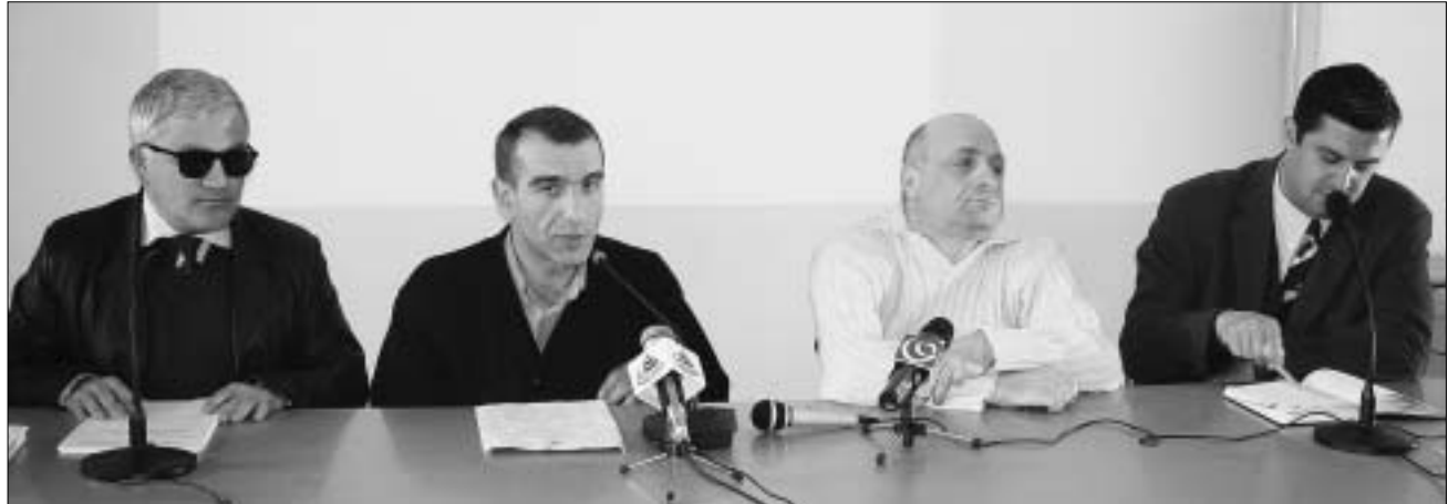
ინვალიდთა ლიგის პრეკონფერენცია ყურნალისტთა სახლში.

2002 წლის 20 ნოემბერს უზენაესმა სასამართლომ დააკმაყოფილა ინვალიდთა ლიგის სარჩელი და საავტომობილო გზების დეპარტამენტის ვალის დაბრუნება დააკისრა. დეპარტამენტში დაახლოებით ისე მოეკიდნენ ამ გადაწყვეტილებას, როგორც ლიგის საპროტესტო აქციებს მათი სამსახურის ფანჯრების 1998 წელს, ამ კონფლიქტის გარეშე - ყურადღება არ მიუქცევიათ. ეს დამოკიდებულება გაგრძელდა მანამ,