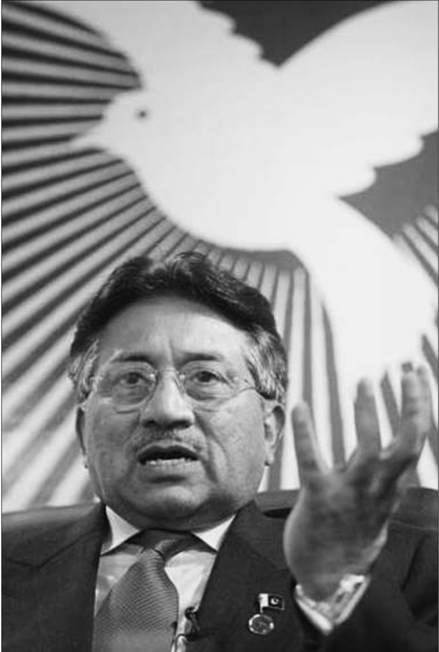
მუშარაფი, პაქისტანის პრეზიდენტი

ტულებმა შიშობენ, რომ ქვეყანა იმავე გზას, შესაძლოა, ძალიან მალე დაადგეს, განსაკუთრებით, თუ ისლამისტური პარტიები ანტიამერიკული განწყობის გამოყენებას საკუთარი ძალაუფლების გასაფართოებლად მოახერხებენ.