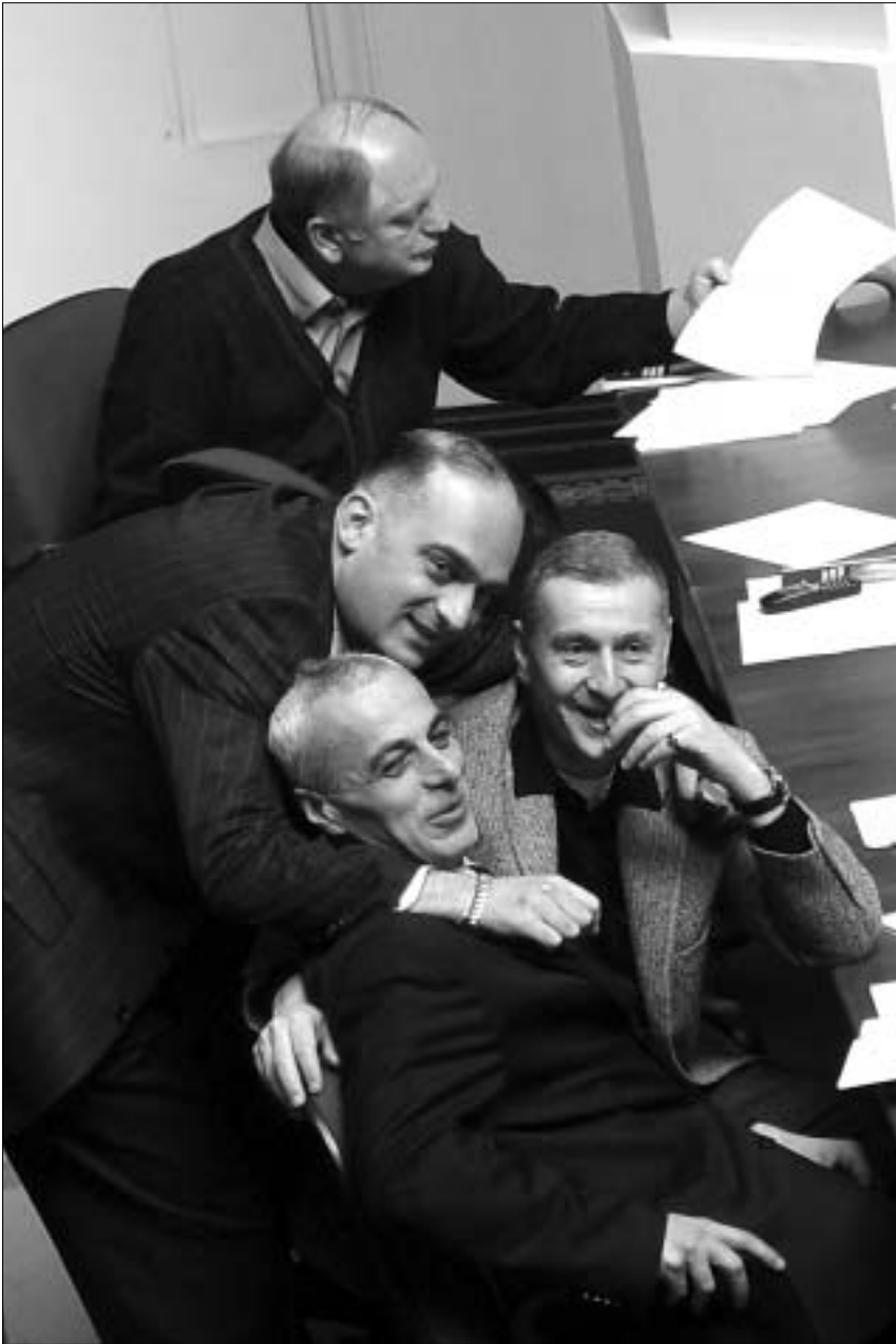
მშობი ერთად ჩავენერთი სეზ-ის მხარდამჭერთა საიში.

მაგრამ, როდესაც საქმე სეზ-ს ეხება, "აღორძინების" წევრებს რაიმე კომპრომისზე სიტყვის გაგონებაც არ უნდათ. მათ ისიც კი აღიზიანებთ, რომ უშუაღესი აღმასრულებელი ხელისუფლება კანონპროექტის განხილვის აგდებულად ეკიდება: სახელმწიფო მინისტრმა გუშინ პარლამენტში მოსვლა არ იწება და საკანონმდებლო ორგანოს თავისი დასაკრკნა წერილობით აახლა. მთავრობის პირ-