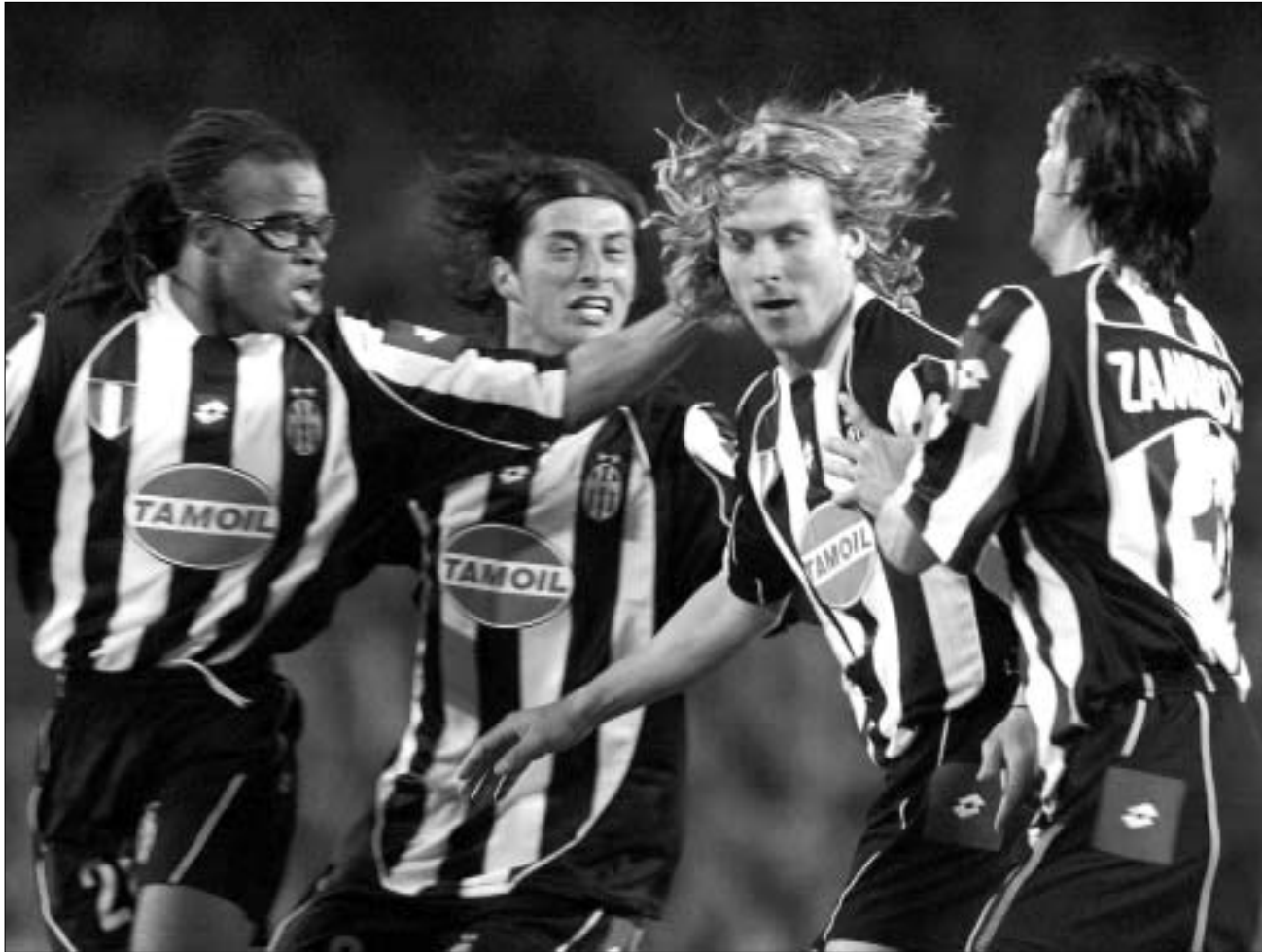
პაველ ნედვედმა იუვენტუსის გამარჯვებას დასაბამი მისცა

ბარსელონა - იუვენტუსი 1:2 (1:1) ვალენსია - ინტერი 2:1 (0:1)