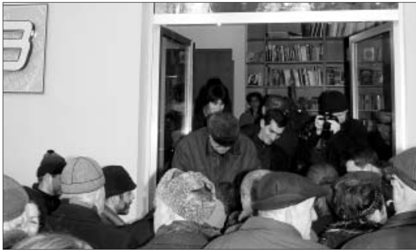
"პარნასში" მწერლები გამყიდველების როლში მოგვევლინებიან.