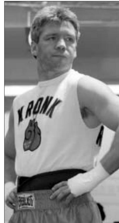
თვითონ კი ჩემპიონის ქამარი მიორგო

ოთ და თავი ვიზმართლოთო. იმ შემთხვევაში, თუ საბჭო გაკორტრებულად გამოცხადდა, მაშინ ის როკიჯანის მიმართ დაეკლიანებისგან ავტომატურად გათავისუფლდება. ამასთან, თურიდული პირის სტატუსსაც შეინარყუნებს და ორთავბობლებს გამართვის უფლებასაც. ახლა კი რა ხდება? რიი ჯონსმა, ჯერ იყო და, ყველას თავგზა აუზუნია და როკიჯანი და საბჭოს მამები ერთმანეთს წაპკიდა, ახლა და, ისევე მძიმე წონაშია. მას შემდეგ, რაც 1 მარტს ისტორიულ დაპირისპირებაში რიი ჯონსმა მასზე ზომა-წონით აღმატებულ, ანუ მიიმენონოსან ჯონ რუისის ასოციაციის ჩემპიონის ქამარი ააწივა, მიორენდნენ, რომ ჯონსის საქციელი ერთჯერადი იქნებოდა. თუმცა, ყოველი შემთხვევისთვის, მოსაფიქრებლად დრო მისცეს (ვადა 15 აპრილს ამოიწურა. - რედ). საბჭო კი, საკუთარ ოურისტთა ბედივლოთობის წყალობით, არცთუ სახარბიელო მდგომარეობაში აღმოჩნდა. ისტორია იმით გაგრძელდა, რომ კრივის მსოფლიო საბჭო, რომელსაც მექსიკაში დაუღია ბიზა, გაკორტრებს პროცედურა ნაშინწყო. ჯერჯერობით WBC-ის ოურისტები საბუტუნთ იქვეებიან - იქნებ რამე ხელმასაჭიდი ვიპოვე-