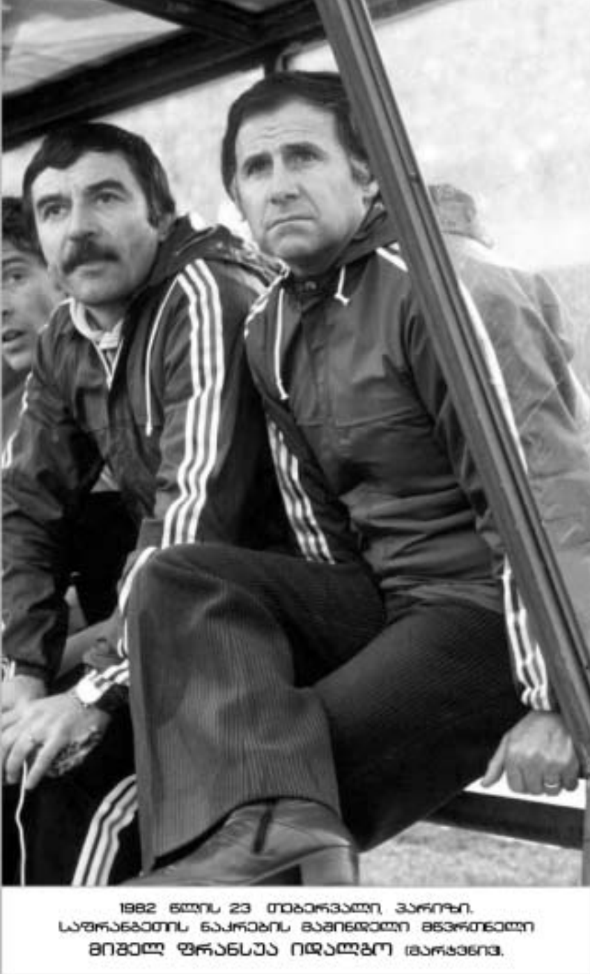
1982 წლის 23 თებერვლი კაროი. საზარდათს ნაკრახის გაიწვილი მწვრთნელი რომელიც დღევანდელი მატჩის შესახებ საუბრობს.