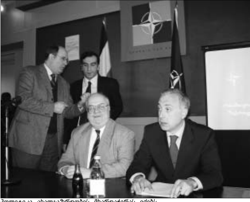
პოლიტიკა ახალგაზრდობის მხარდაჭერას ეძებს.

“ახალი მემარჯვენიების” ლიდერი ვერც ქვეყნის საზინაო პოლიტიკ-