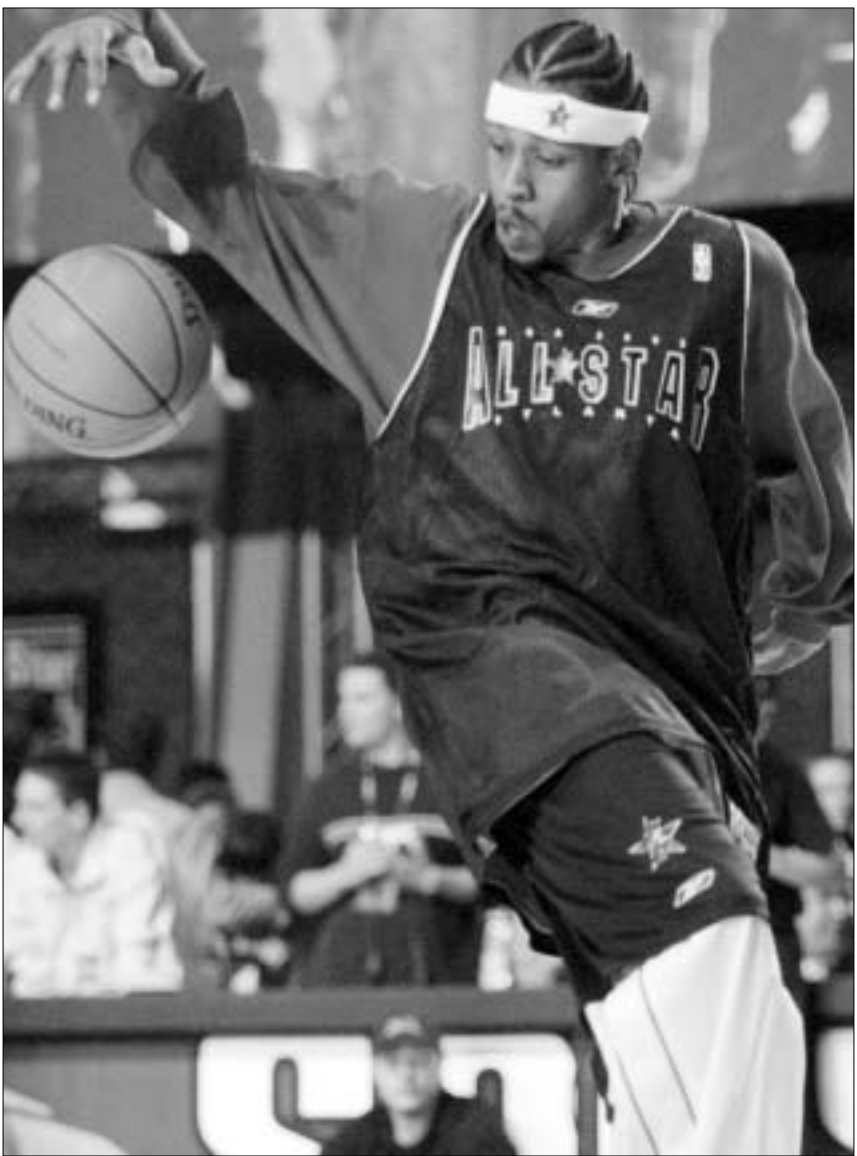
ალენ აივერსონმა პირადი რეკორდი დაამყარა

ნიუ-ჯერსი - მილუკი 109:96 არა მგონია, რომ "ნიუ-ჯერსი ნეთსი" სიხარულით შეხვდა "მილუკი ბაქსთან" დაპირისპირებას, მაგრამ, ფიჭვირბ, გარი პეიტონისა და დესმონდ ბეისონის მოსვლით "ბაქსს" ფერი ეცვალა. დანაკარგი რიკ ლეინის სახით, რა თქმა უნდა, შესაძინეია, მაგრამ სამაგიეროდ ჯორჯ კარლს შემადგენლობით ვარირების მეტი საშუალება მიუცა. პეიტონმა და კსეი-სამ დაცვაში ერთ-ერთ საუკეთესო ტანდემს ქმნიან, ხოლო თავდასხმაში შთამბეჭქდავად გამოიყურება მესონ-ტომას-