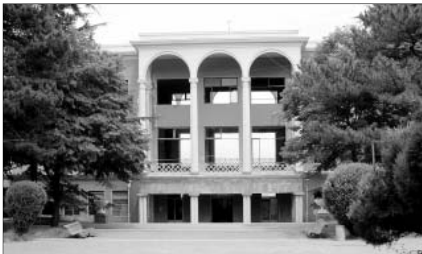
დღის მთავარი მოვლენა. დღეს საღამოს აქ "საბას" ჭილდოებს გადასცემენ.