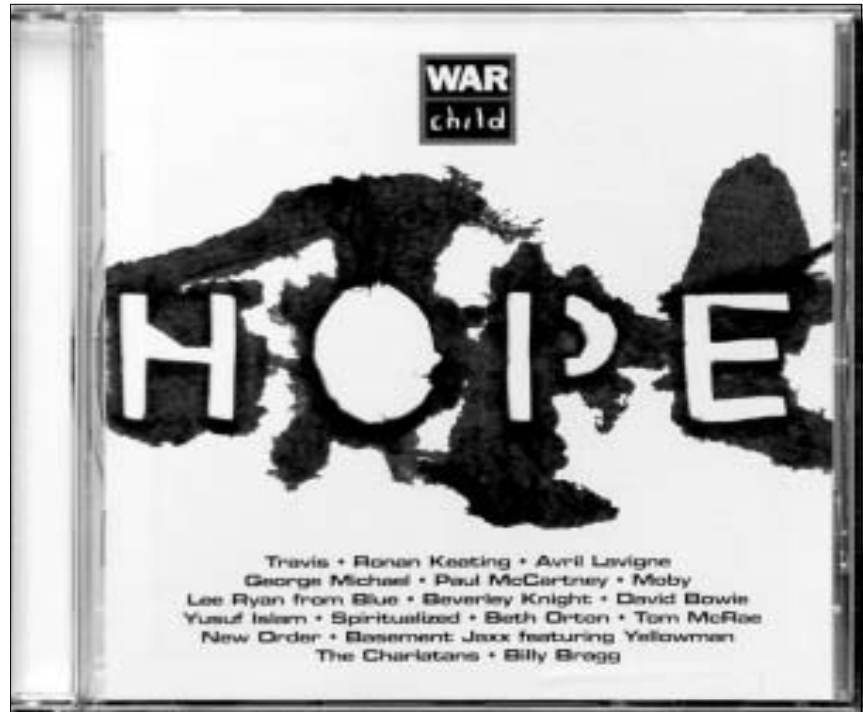
ახალი დისკის გარეკანი

ერაყის ომის ახალგაზრდა მსხვერპლთა დასახმარებლად პოლ მაკარტნიმ, დევიდ ბოვიმ და ჯორჯ მაიკლმა ახალი ერთობლივი კომპაქტ-დისკი გამოუშვეს. ბრიტანული მედიები იუნცება, რომ შემოსავალი, რომელსაც ეს ჩანანერი, "იმედი" მოიტანს, საქველმოქმედო ორგანიზაცია "ომის ბავშვებს" გადაეცემა. ეს ორგანიზაცია ამჟამად ნაზირიჯაში დანგრეული ობოლთა თავშესაფრის აღდგენას გეგმავს. "ომის ბავშვების" მონა-