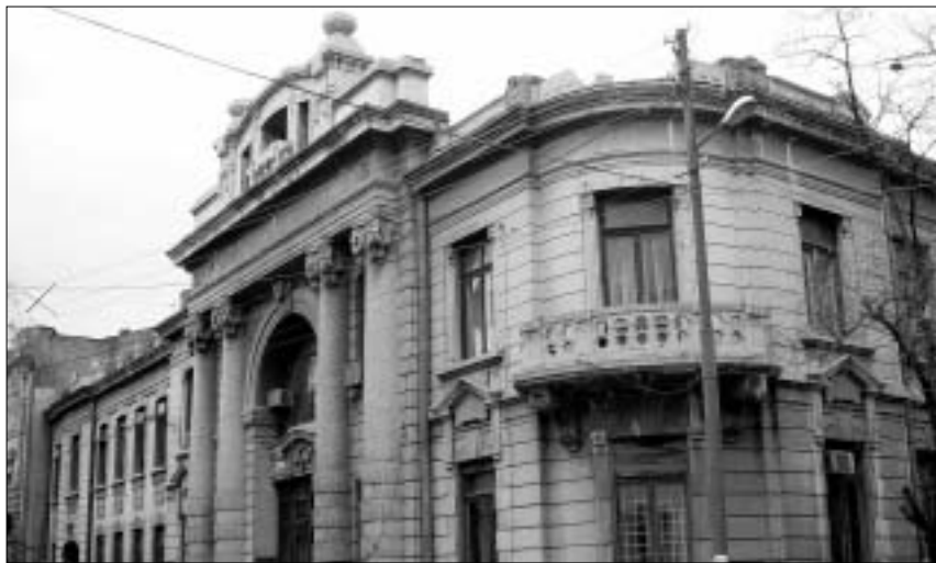
დიდი ფასდაკლება ეროვნული ბიბლიოთეკის წინ (13-დან 17-საათამდე).