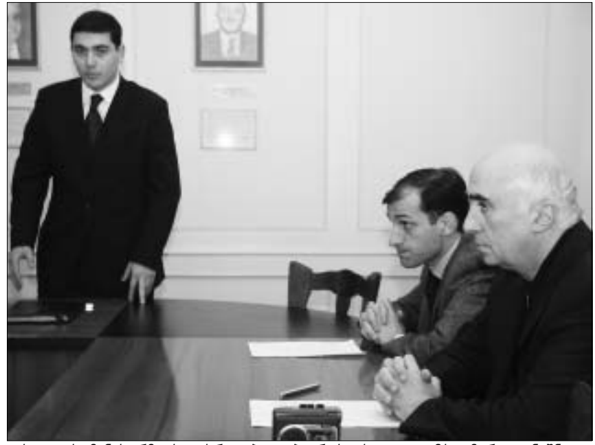
იუსტიციის მინისტრმა სააღსრულებლო ბიუროს ახალი თავმჯდომარე დანიშნა.