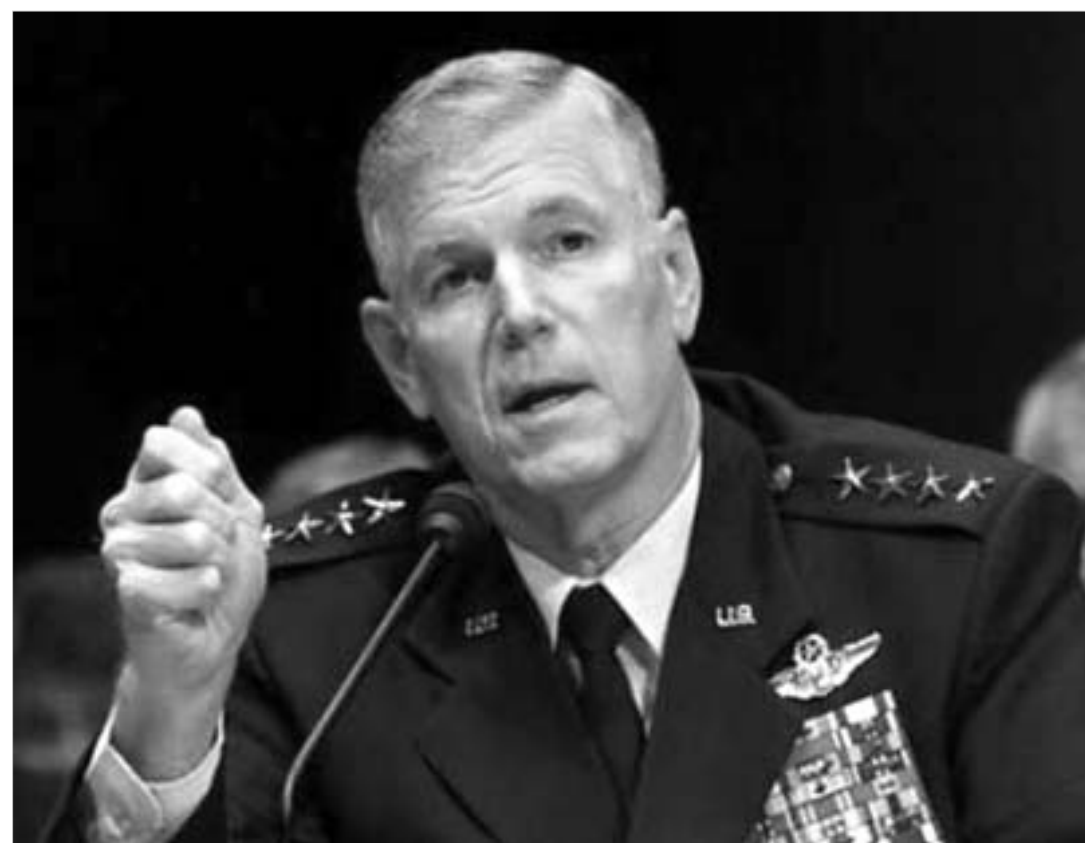
გენერალი მიერსი: ცენტრალურ აზიაში სტაბილურობისთვის ამერიკელი სამხედროების ყოფნა აუცილებელია