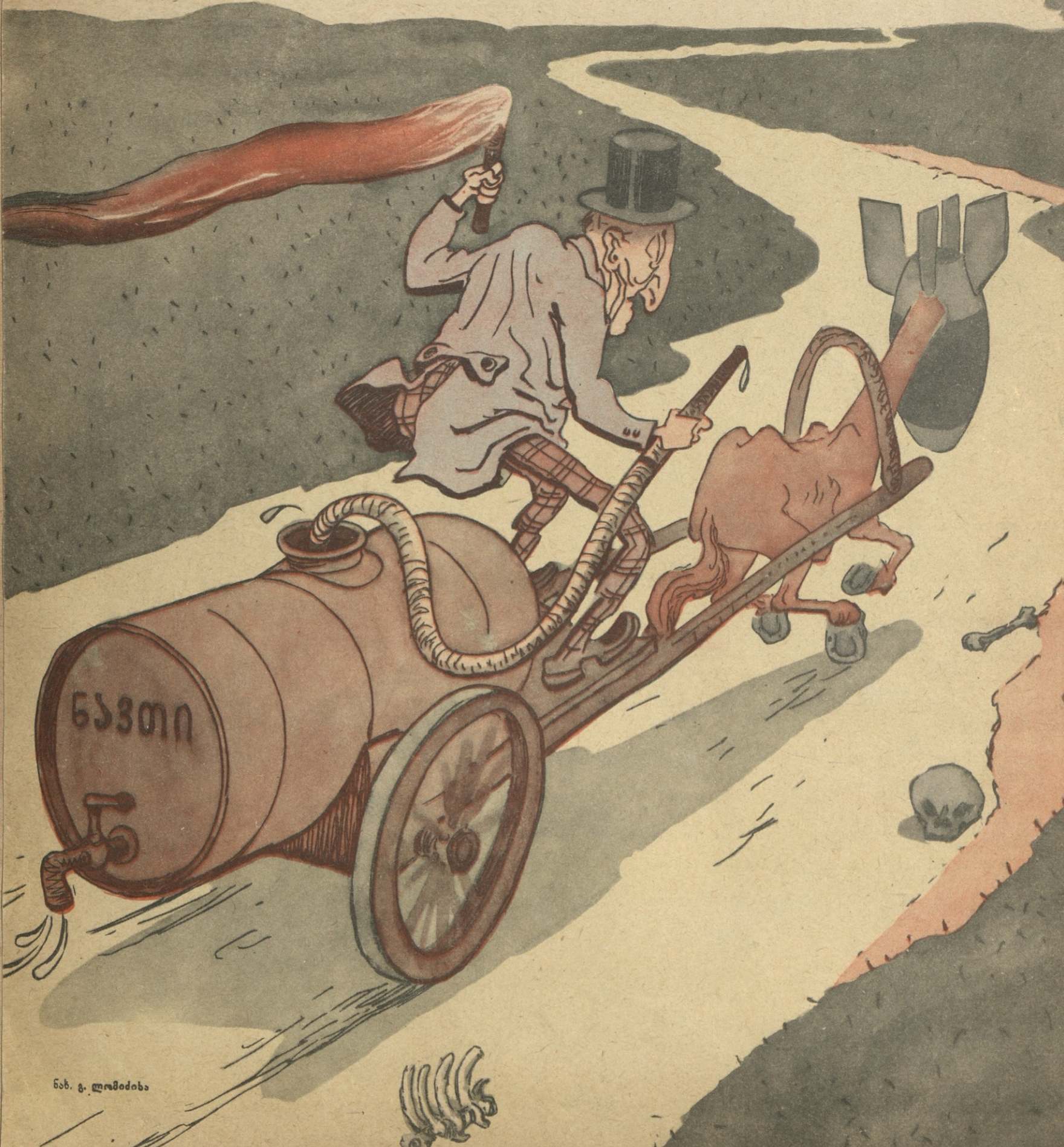
ნახ. გ. ლომიძისა