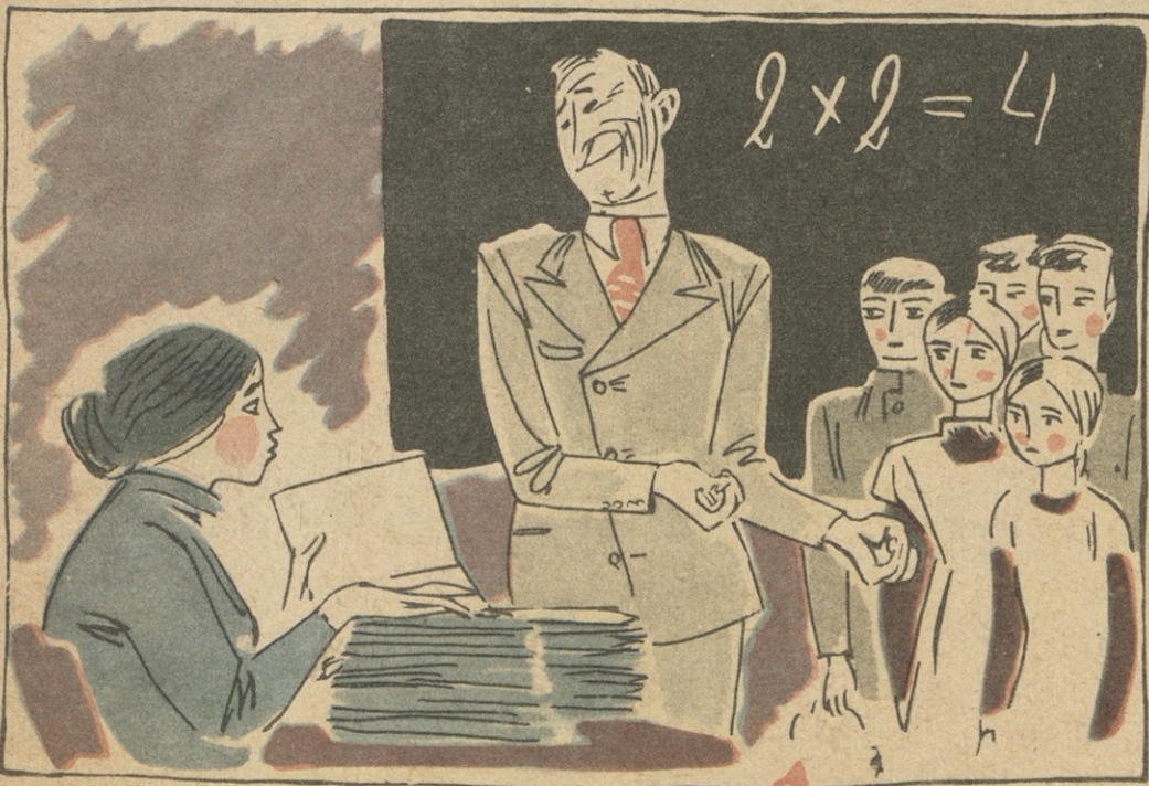
— თქვენი მოსწავლეების ნაწერებში ბევრი შეცდომაა, არ უხწორებთ? — რაფრა არ ვუხწორებე, მარა ესმითყე?