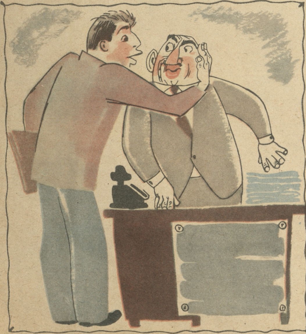
— კი, მაგრამ, რატომ მაფარებ ყურზე ხელს? — მეშინია, ბატონო, ჩემი თხოვნა მეორე ყურიდან არ გაგებაროს.