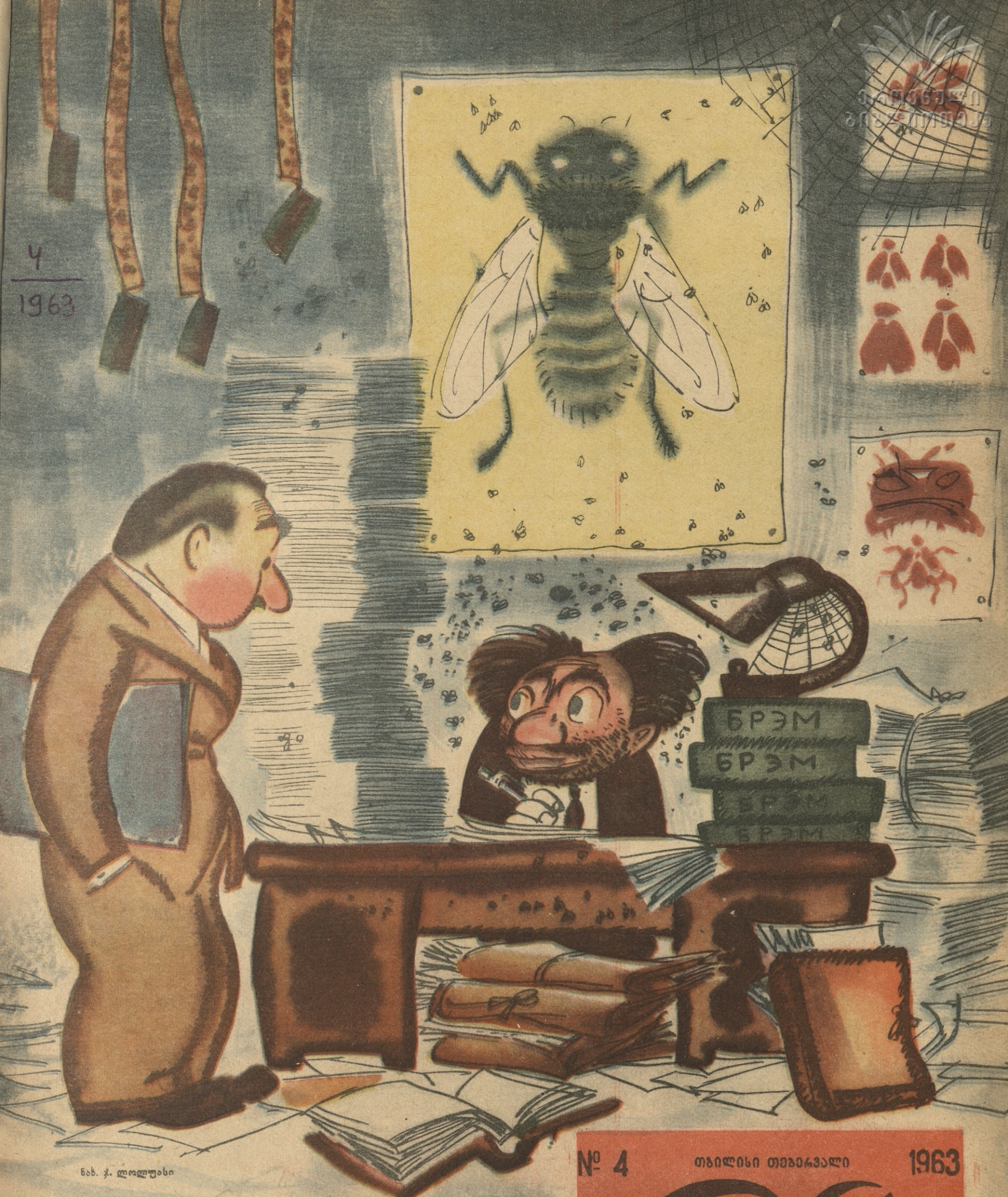
ნახ. ჯ. ლაღლუასი

— რა თემა გაქვს, კაცო, ასეთი, რომ ათ წელიწადში დი- სკრტაცია ვერ დაამთავრე! — მებად მნიშვნელოვანი — „ევითელთვალა გუჯის ზუ- ილის ზოგირათ თავისეზურებათა შესწავლის საკითხისათ- ვის!“