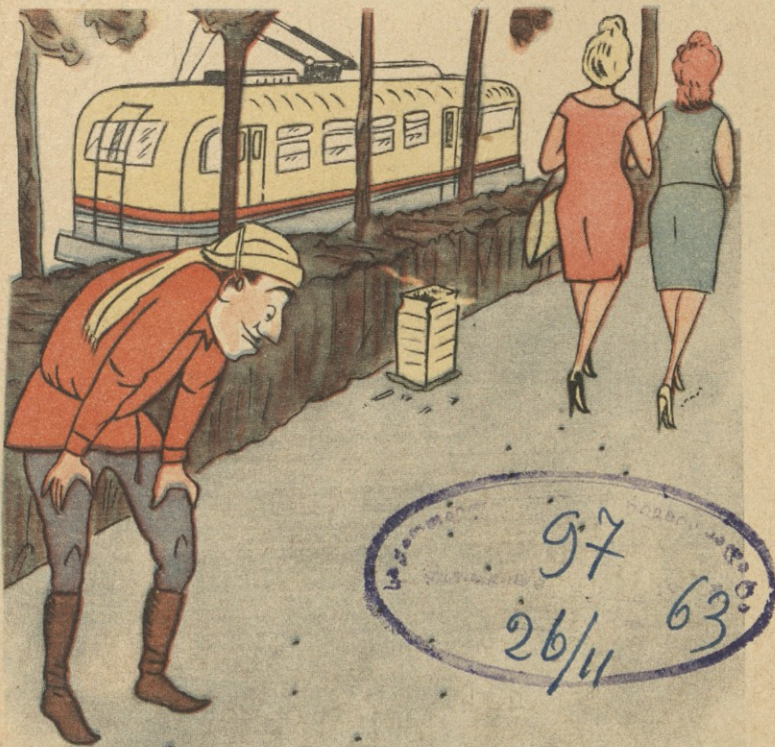
— ამ ხნის მონადირე ვარ და ასეთი ნაკვალევი ჭერ არ შემხვედრია!