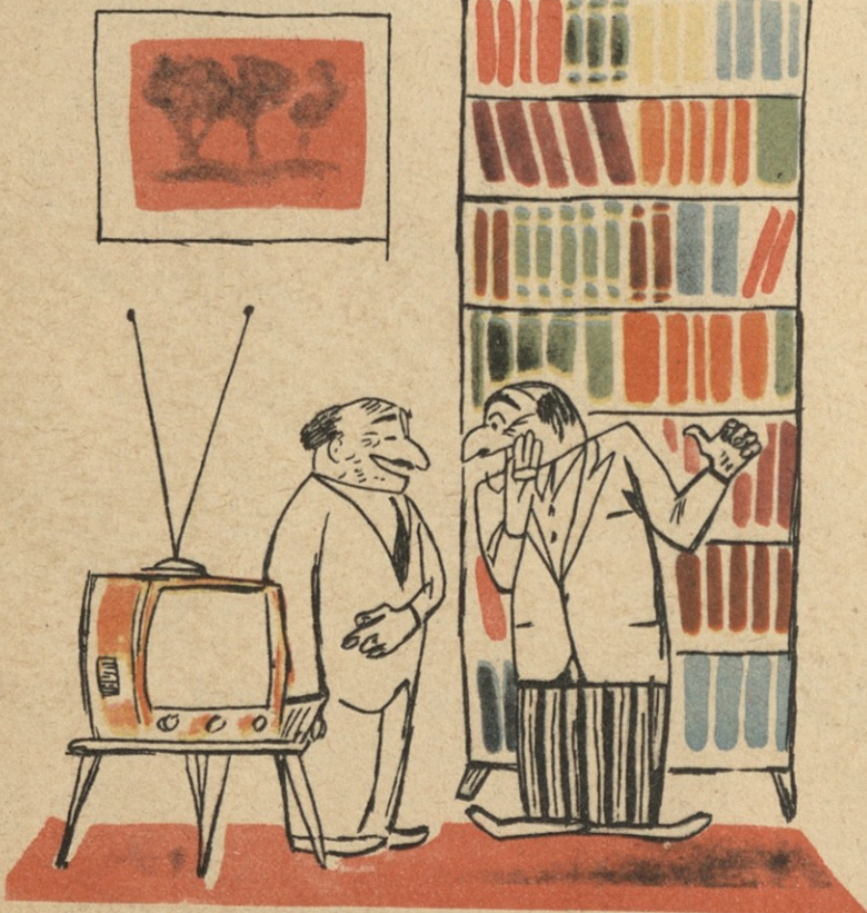
— ჩვენს ქალაქში ჭირ ტელეგადაცემები არ არის და ტელევიზორი რად გინდა? — არც წიგნების კარადა მჭირდება, მაგრამ...