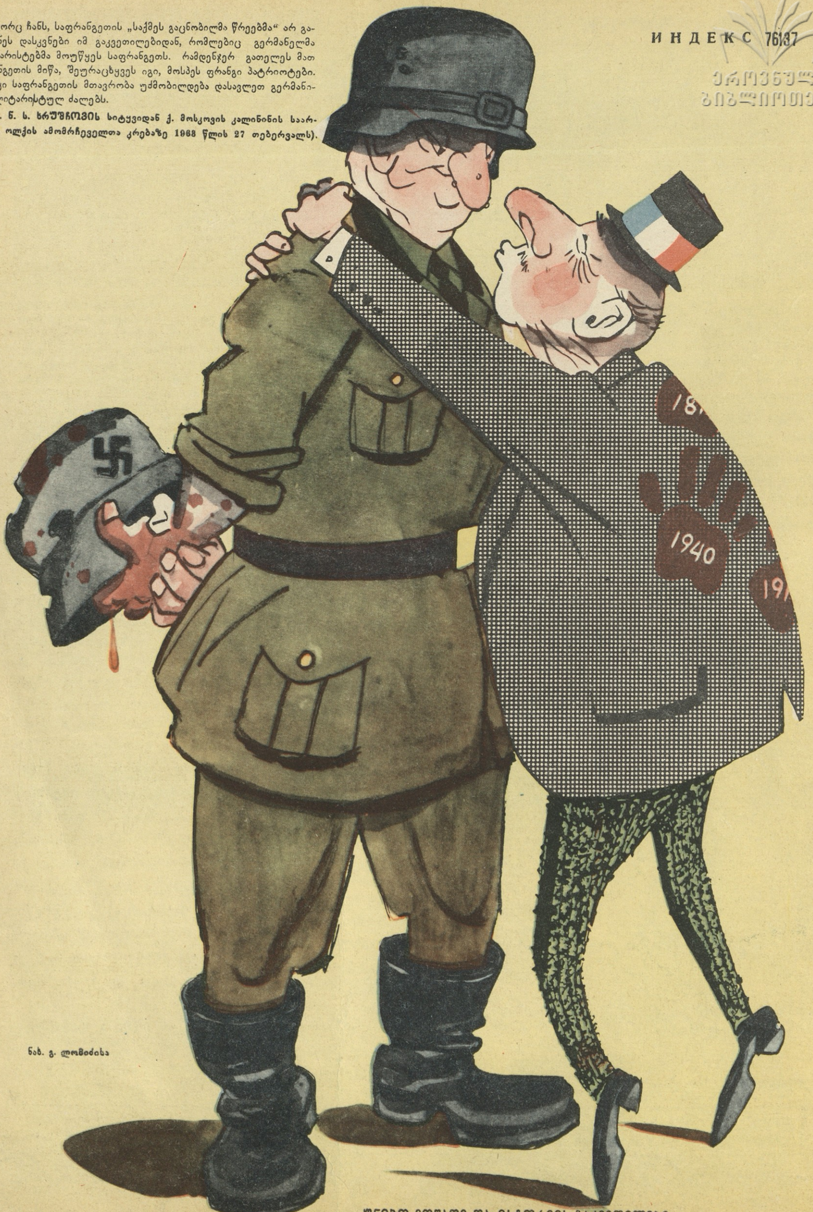
ნახ. გ. ლომიძისა

უნიკო მონაწილე და ისტორიის გაცემითილები.