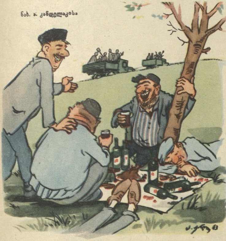
ნახ. ა. კანდელაკისა

გიერო გადაგვებადა მისთვის? შეგუდექით მგზავრები, ავტობუსს აქეთიქიდან და სამშვიდობოს გამოვართიეთ, მეტი რა გზა გვქონდა. ცოტა შევისვენეთ, გული მოვიბრუნეთ და ისევ ავტობუსში დავიკავეთ ჩვენი ადგილები. ახლა იმის იმედი გვაქვს, რომ ნიანგი მაინც მოგვცემს რჩევადარიგებას და გვეტყვის, ამ ზაფხულშიც შარშანდელივით მოგვიწევს ფანჯრებდაკეტილ ავტობუსში ჯდომა და გზის გასწვრივ გათხრილი ორმოების შიშით ცქერა? იქნებ ჩვენც დაგვეხმარონ, როგორც ახალბედა ქალაქელებს და პატარა ქვაფენილები მაინც მიუმატონ ავჭალის ვიწრო ქუჩებს, რომ მოსახლეობას საშუალება ჰქონდეს მასზე სიარულის. ჩვენ კი თქვენი იმედით ვცოცხლობთ, ჩვენო ნიანგო.