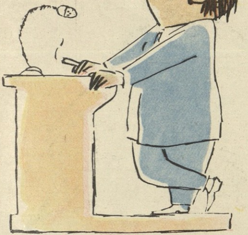
ამნაირი კაცის ქვეყნად არაფერი გვიკვირს რა, სულ ლაყბობად ჩაეთვალა, რაც კრებაზე იკისრა.

საქართველოს საბჭოთა საზოგადოებრივი ტელევიზია