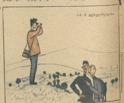
ნახ. 2. დურღლიშვილი