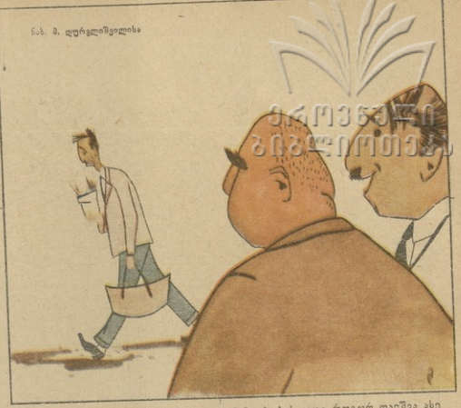
საეკორეგლი. ასეთი თანაშლებობის ცაცო როგორ დურემა ასე დაბლა? — რა ქანს, ნადლა ადინაიენ მუკვი!