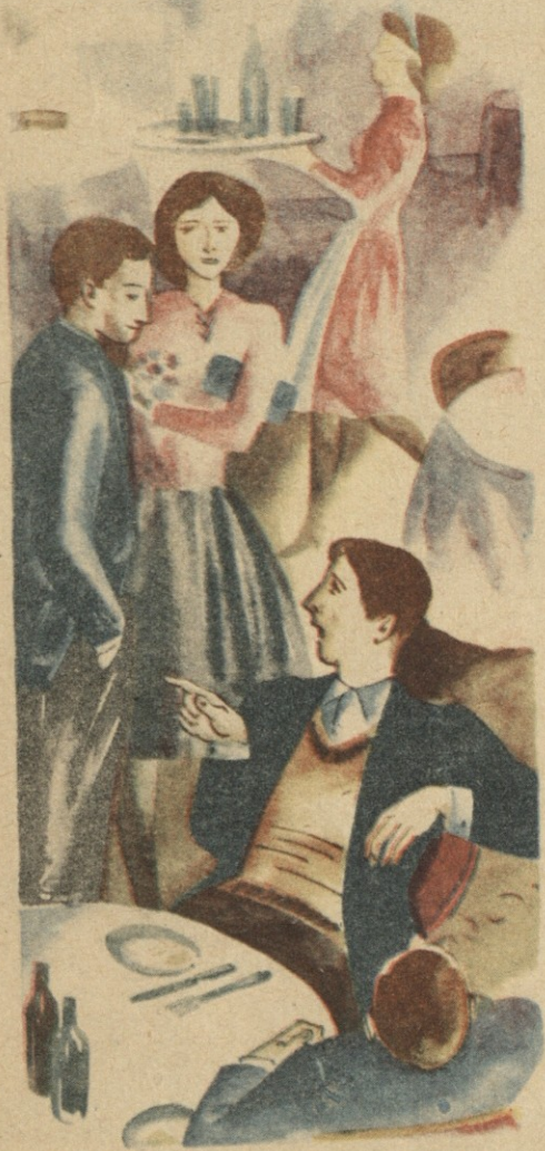
სან. ზ. ფორჩხიძის

— მისაღები გამოცდები ჩასაბარებელი გაქვს და რატომ არ მეცადინებო? — ვმეცადინებო რომელია, დღეღამე დავეძებ მასწავლებელს, რომელიც მომამზადებს, „ჩაგაბარებ“ და გამოცდებსაც ის ჩაიბარებს ინსტიტუტში!