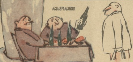
— ამ დღინს მოღონ ნ მოხირი რაიმე აწერია? — მადამი, ბატონო, რეაინარი დღინა არსულთ!