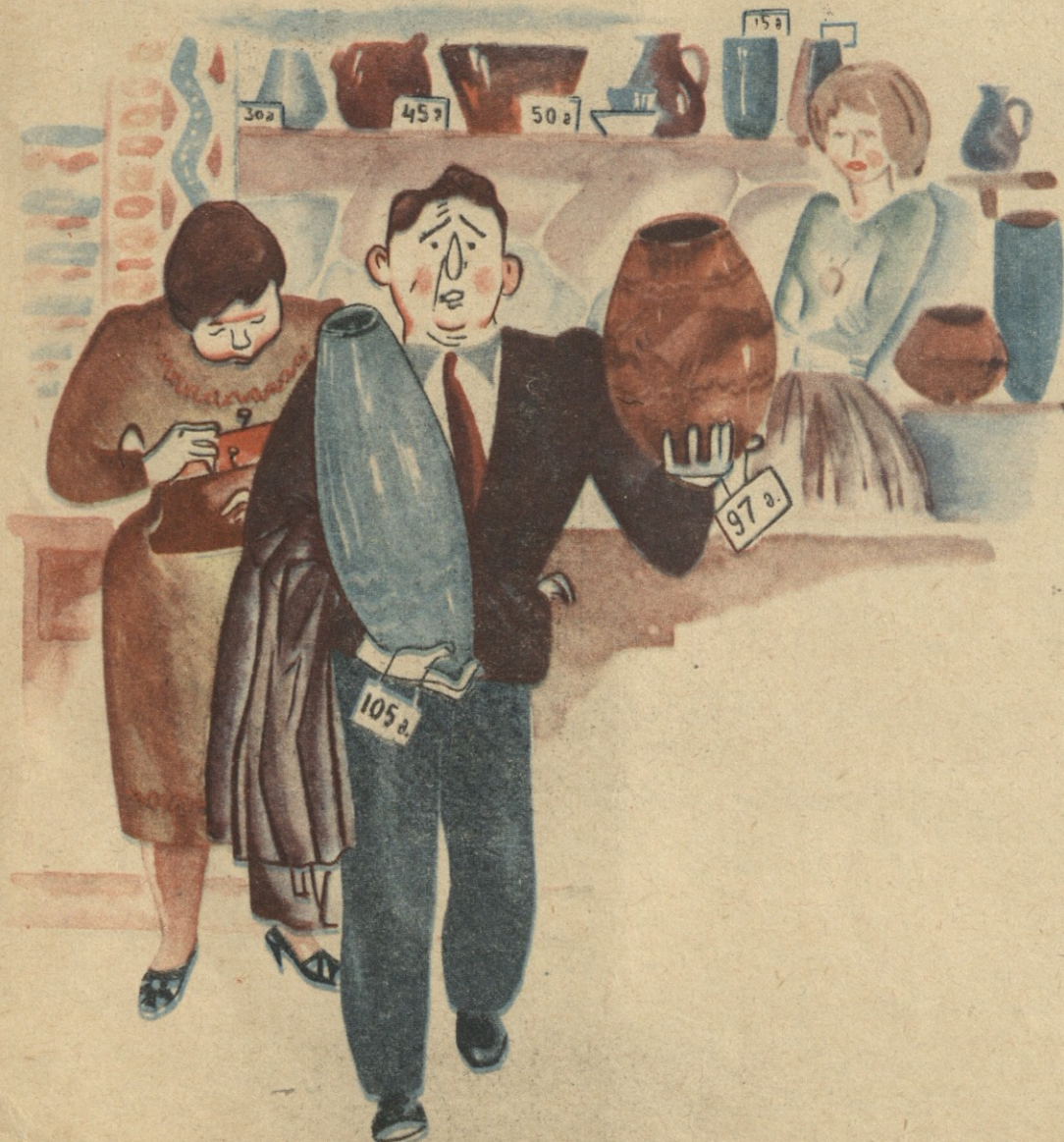
— ორი ქოთან ვიყიდე, ვაი, ვაი!