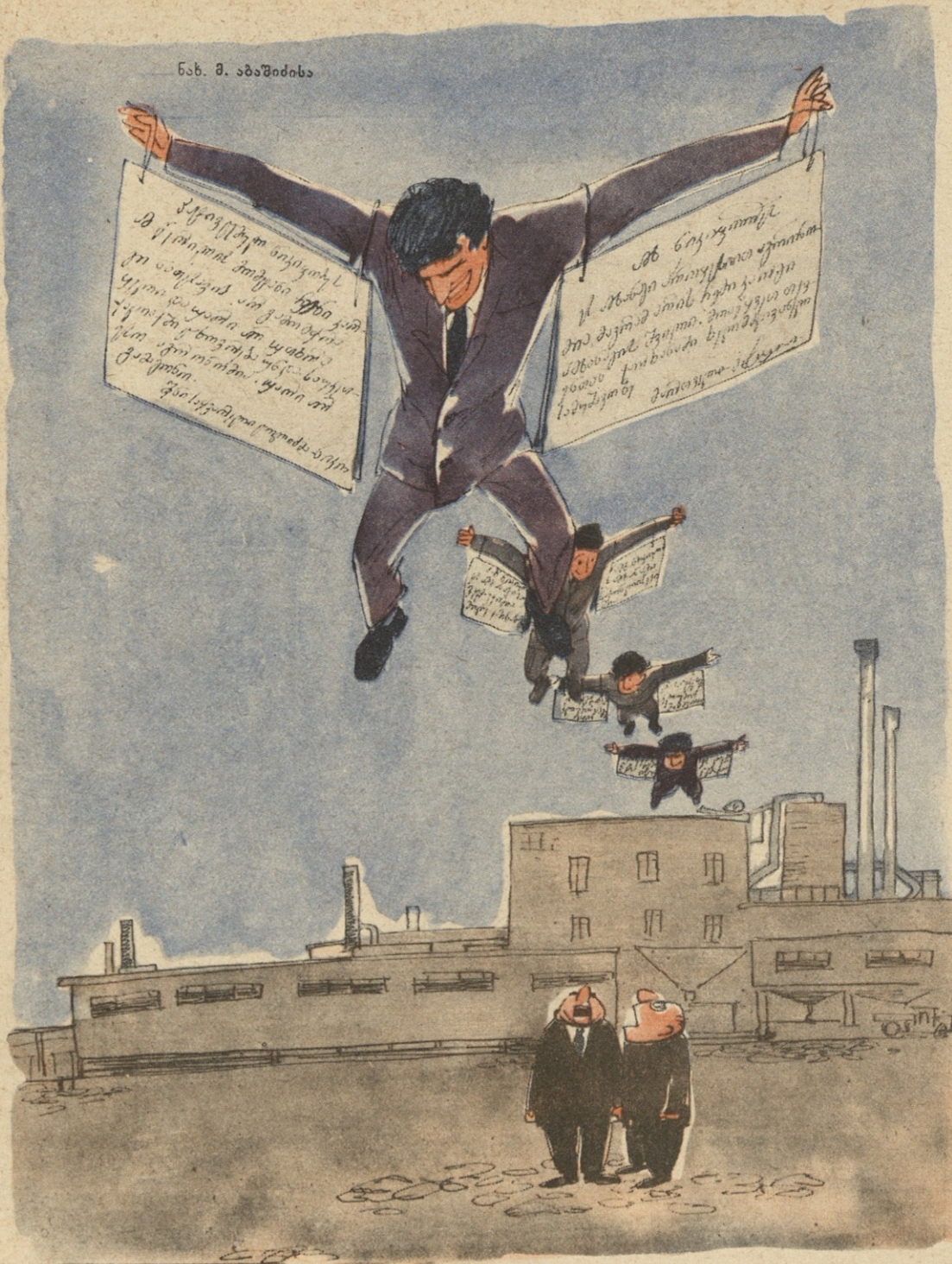
— შეხედე ამ ფრენიებს, ისეთი ძლიერი „ფრთები“ აქვთ, რომ რაიონიდან გადმოფრინდნენ!