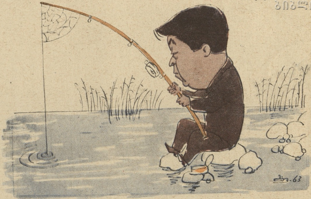
Клюет?! Не клюет?!