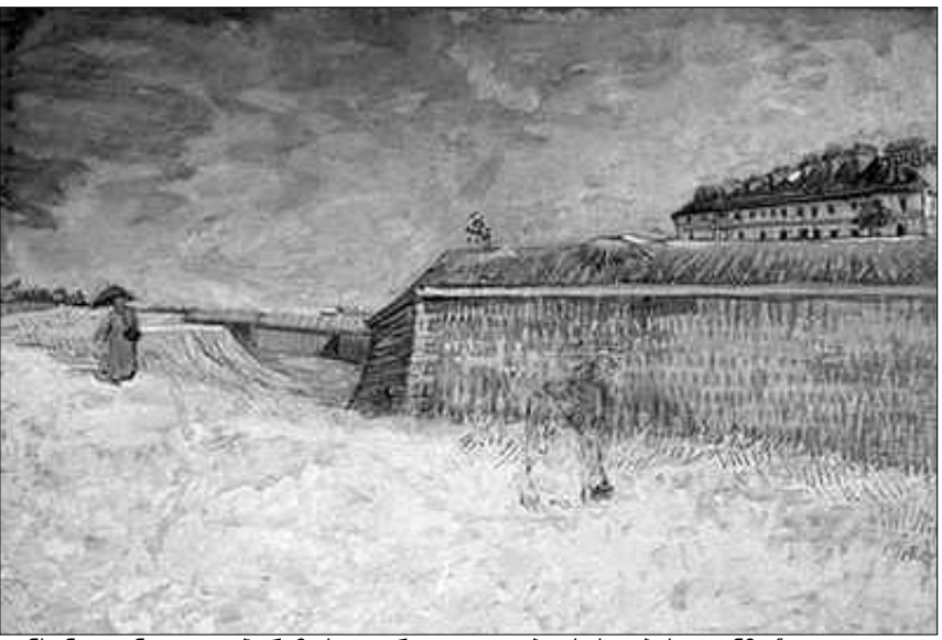
ვინსენტ ვან გოგი „პარიზის ფორტიფიკაციები სახლების ფონზე“

BBC-ს ცნობით, მანჩესტერის მუზეუმიდან, Whitworth Art Gallery-დან მოპარული ვან გოგის, პიკასოს და გოგენის ნამუშევრები პოლიციამ აღმოაჩინა.