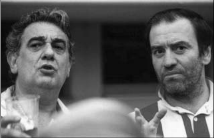
პლასიდო დომინგოსთან ერთად

იმ ურთიერთობებით, რომელიც „მეტის“ ორკესტრთან და გუნდთან დაუმყარდა. ამასწინათ განაცხადა, რომ მათთან მუშაობისას „არაფერს განიცდის დიდი, ძალიან დიდი კმაყოფილება გრძნობდა“. გერგიევს სამომავლოდ ზრანდიოზული გეგმები აქვს – მსოფლიოს ნაკლებად ცნობილი რუსული ოპერები და მარისის მომღერლების ახალი თაობა უნდა გააცნოს. ივლისში „მეტის“ სცენაზე რუსული ოპერის სამკვირიანი ფესტივალი გაიმართება, დაიდგმება პროკოფიევის „სემიონ კოტკოვი“ – პირველად „მეტის“ სცენაზე. შესრულებენ ვერდის „მაკბეტსაც“.