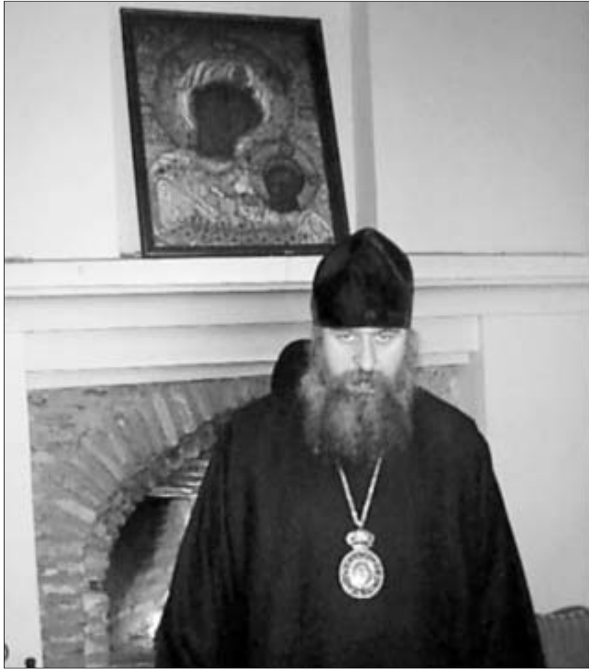
ცხუმ-აფხაზეთის მიტროპოლიტი დანიელ

ორიოდე წლის წინათ ვაზისუბანში ხმა ვავარდა, ადამიანს ღმრთისმშობელი გამოცხადებდაო. როგორც ამბობდნენ, ერთ-ერთ მანდილოსანს ჰქონდა ივერიის ყოვლადწმინდა ღმრთისმშობლის ხატის ხილვა. იმ დღიდან მოყოლებული ვაზისუბნელები და არა მარტო ისინი აღნიშნულ ადგილზე, სადაც ჯვარი იმთავითვე აღმართეს, სისტემატურად დადიან სალოცავად. ახლა კი გადაწყდა, რომ მახათას მთაზე ივერიის ყოვლადწმინდა ღმრთისმშობლის სახელობის ტაძარი და მამათა მონასტერი აშენდება.