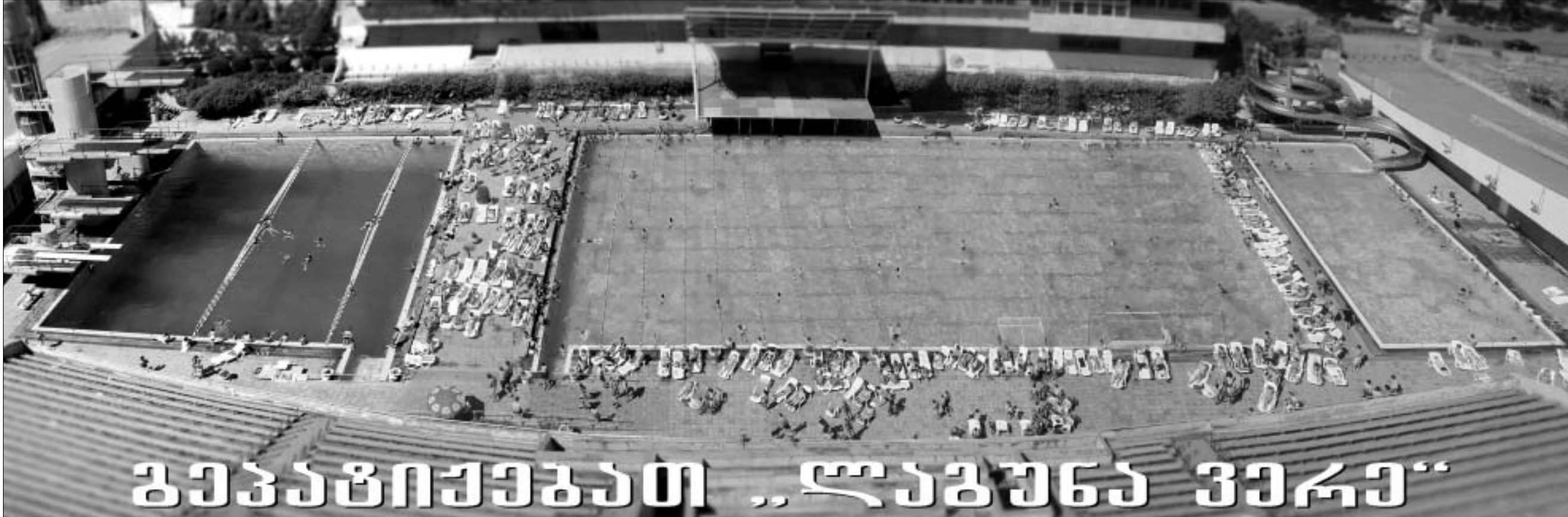
გეგმაპროექტით „ლაგუნა ვიკი“

ნახევარფინალი: ანდრე აგასი (აშშ, 1) - იურჯენ მელცერი (ავსტრია) 6:4, 6:1 ენდი როდიკი (აშშ, 2) - ოლივიე მიუტი (საფრანგეთი) 4:6, 6:1, 6:2 ფინალი: ანდრე აგასი (აშშ, 1) - ენდი როდიკი (აშშ, 2) 3:6, 6:3, 6:4