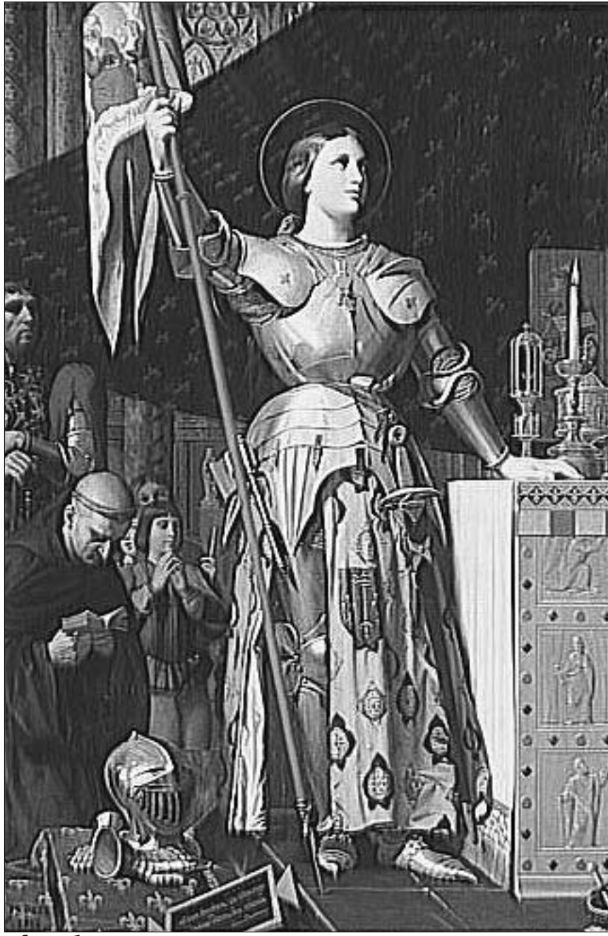
ყანა და რკი

1429 წლის 6 მარტს პატარა ყანა შინონის ციხე-სიმაგრეში, მეფესთან გამოცხადდა, და მოახსენა, რაც ზეციურმა მფარველებმა მოახსენეს: ის, ყანა, ღმერთს რჩეულია, ამიტომ ორღეანის ალყა სწორედ მან უნდა გაარღვიოს, და მანვე უნდა მიაბრძანოს მეფე რეიმსში, ფრანგი მეფეების მეფედ კურთხევის ადგილას. რეიმსის ტაძარში მიღწევას განსაკუთრებული მნიშვნელობა ჰქონდა, რად-