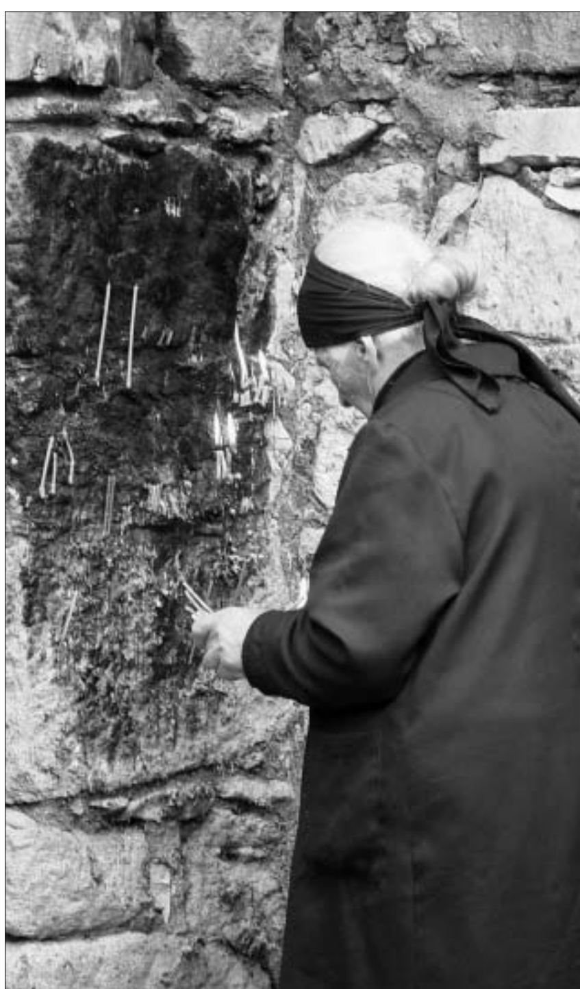
საჩხერის რაიონი, სოფელი ჩიხა. ღვთისმშობლის ეკლესია.