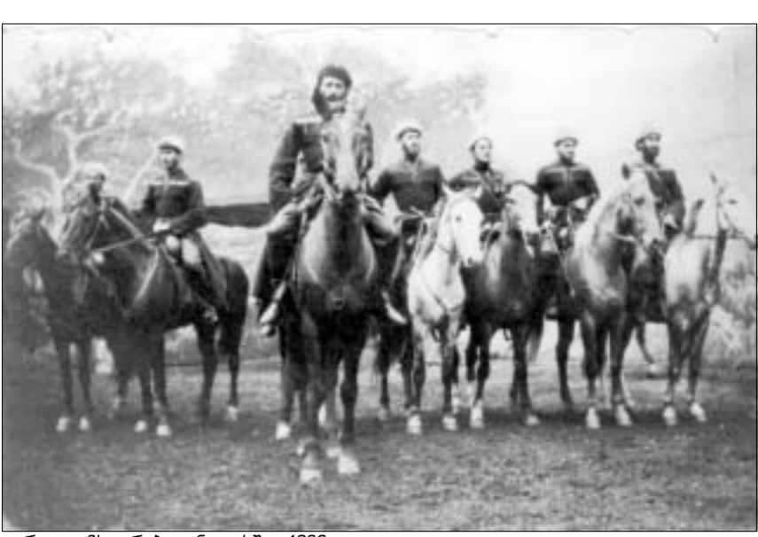
ბურული მხედრები ინგლისში, 1892.

ულ მოუმი გამოდიოდნენ და რომელითაც “კაზაკები” სახელი მოიხსენიებდნენ, რუსები კი არ ყოფილან, არამედ საქართველოდან ჩასული მხედრები.