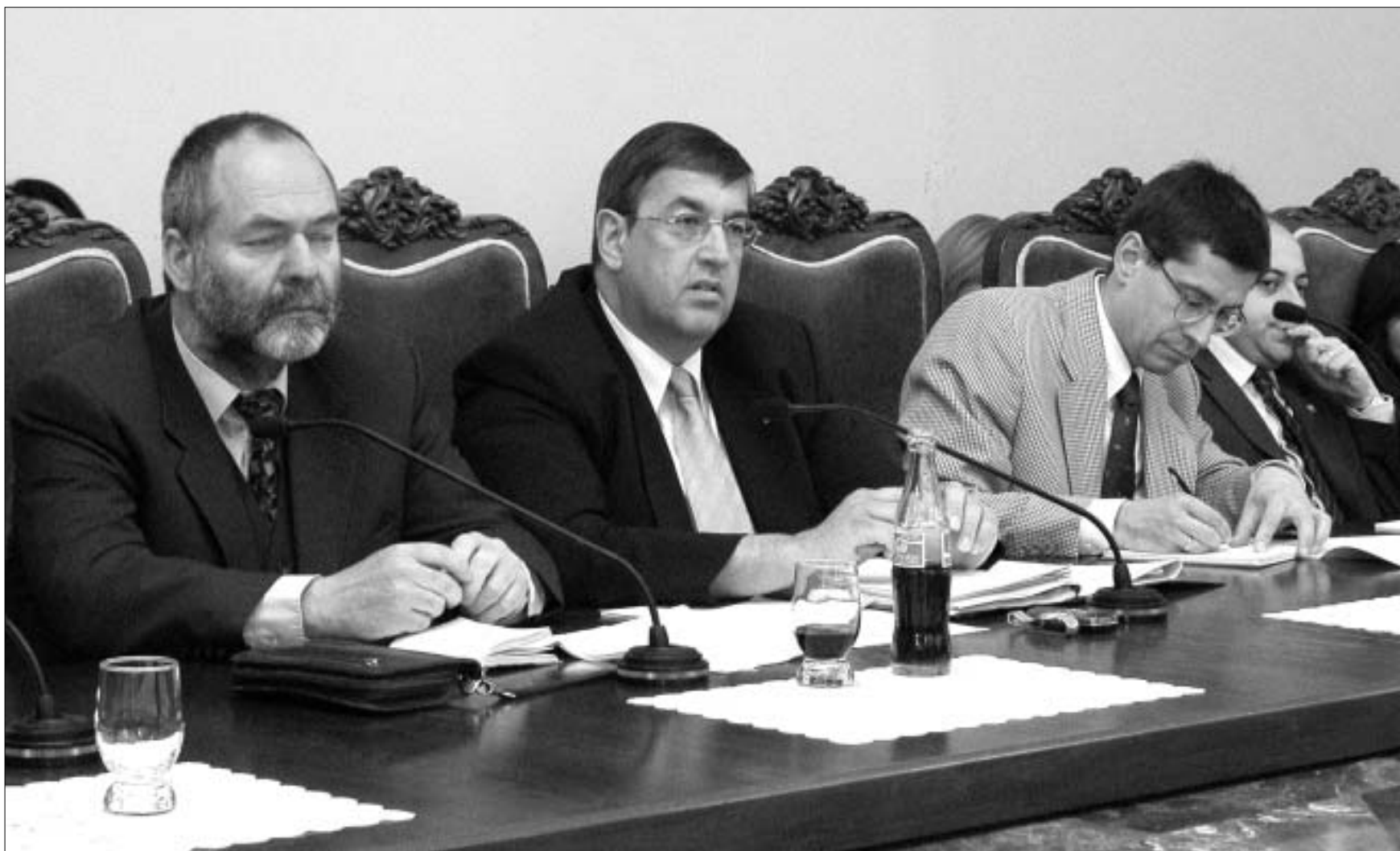
მარკუს შეკელი (მარცხნივ) და ნატო-ს საპარლამენტო დელეგაცია.