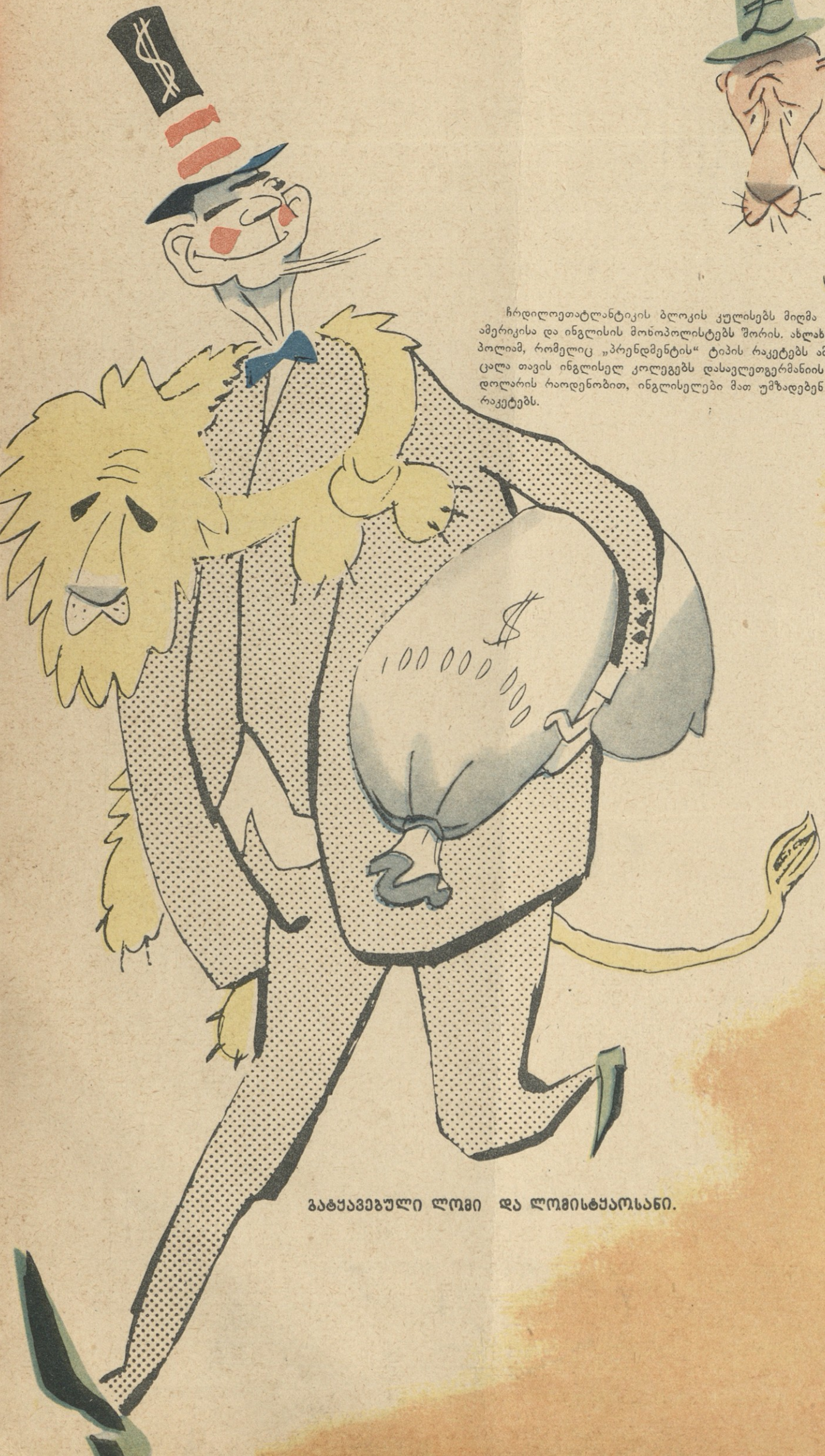
გატყავებული ლომი და ლომისტყაოსანი.

ჩრდილოატლანტიკის ბლოკის კულისებს მიღმა მიმდინარეობს ბრძოლა ამერიკისა და ინგლისის მონოპოლისტებს შორის. ახლახან ამერიკის ერთმა მონოპოლიამ, რომელიც „პრენდმენტის“ ტიპის რაკეტებს ამზადებს, ხელიდან გამოა-ცალა თავის ინგლისელ კოლეგებს დასავლეთგერმანიის შეკვეთა 100 მილიონი დოლარის რაოდენობით, ინგლისელები მათ უმზადებენ „ბლიუ დოკერის“ ტიპის რაკეტებს.