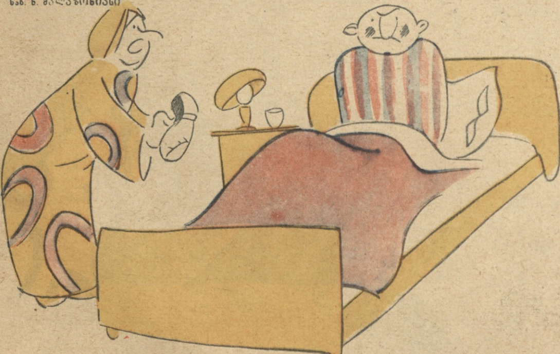
ნახ. ნ. მაღალაონიანი

— რა არის, კაცო, ფეხსაცმელზე რომ არცერთმა ტყავმა არ გაგიძლო? — ხაკვირველია, სულ ლოგინში ვგორაობ და ფეხსაცმელს რა ხეცვ?! კ. ხუციშვილი