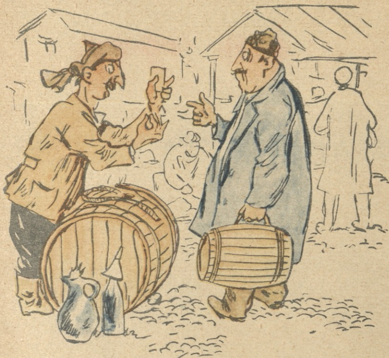
— რას უწუნებ, ბატონო, ამ ღვინოს, დადუღება ვერ მოასწრო და ცოტა ტკბილი დარჩა.