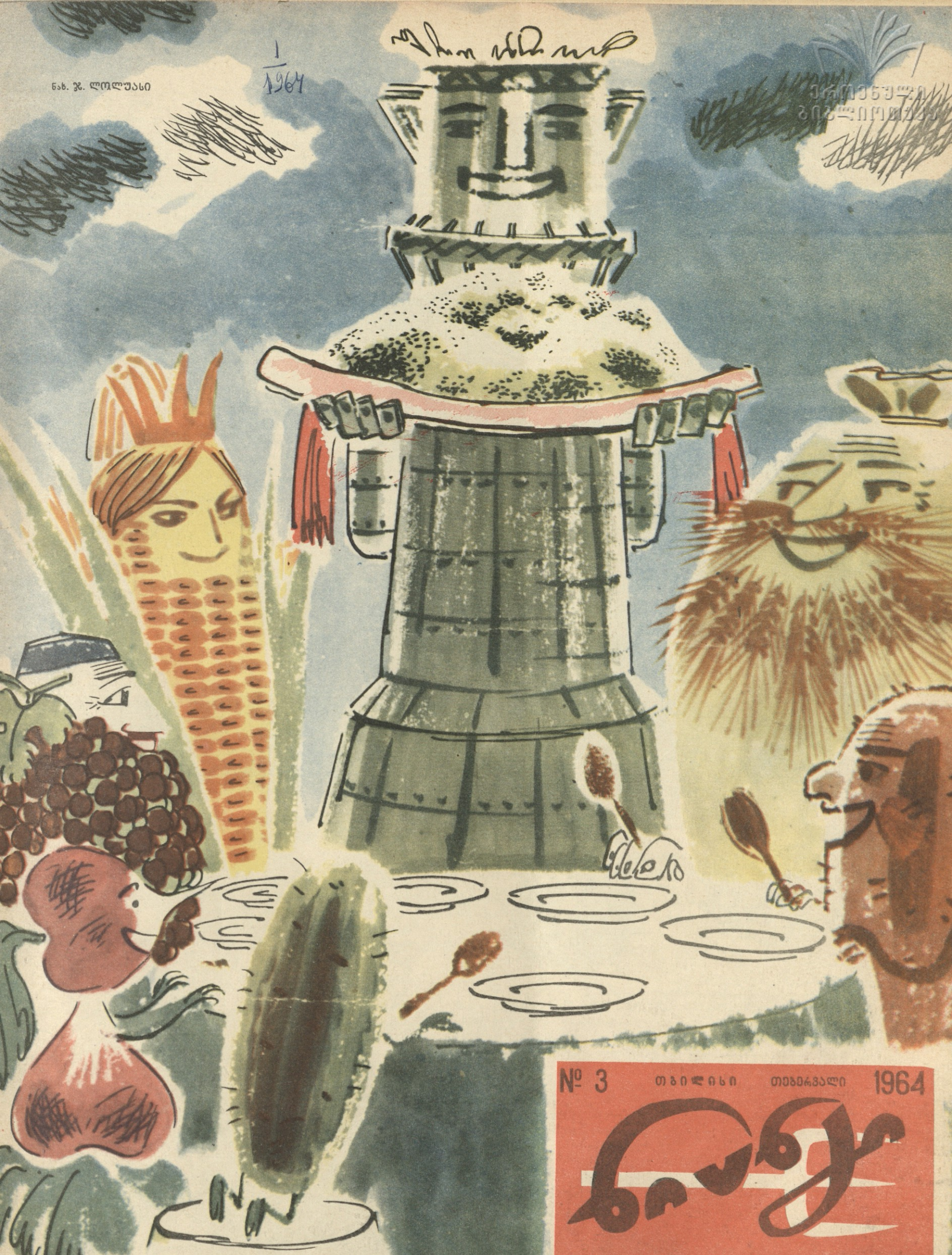
მასკინძელმა, როგორც ჟისი, მოიხადა თავის ვალი., ახლა სიტყვა სტუმრებზეა — მოვცენ უხვი მოსავალი.