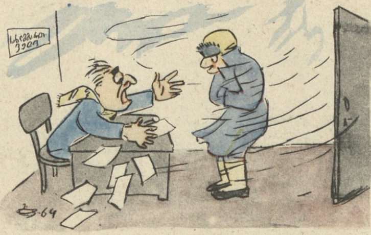
ანხ. გ. შირცხალაშასი

— კარი მოხურეთ, თქვენ სახლს კარი არა აქვს? — სწორედ მაგისათვის მოვედი თქვენთან!