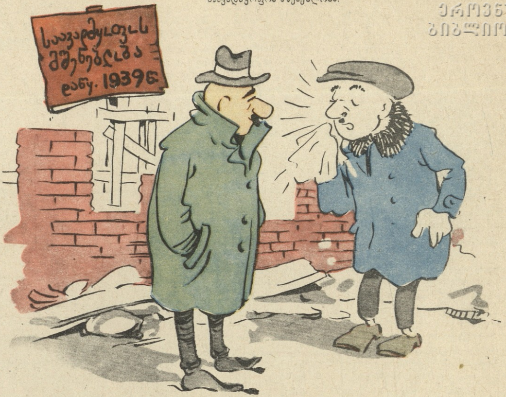
— იცოცხლეთ და არაფერი გეტკინოთ ჩვენი საავადმყოფოს დამთავრებამდე!