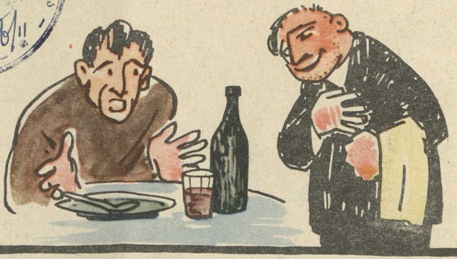
— ლა გინდათ, ბატონო, საცივრის ციგნი, ლა ალ მოგეწონათ?! — შე კაცო, ხაშში გექნა ჩლიქები, აქ რომ ენას იჩლიქავ!