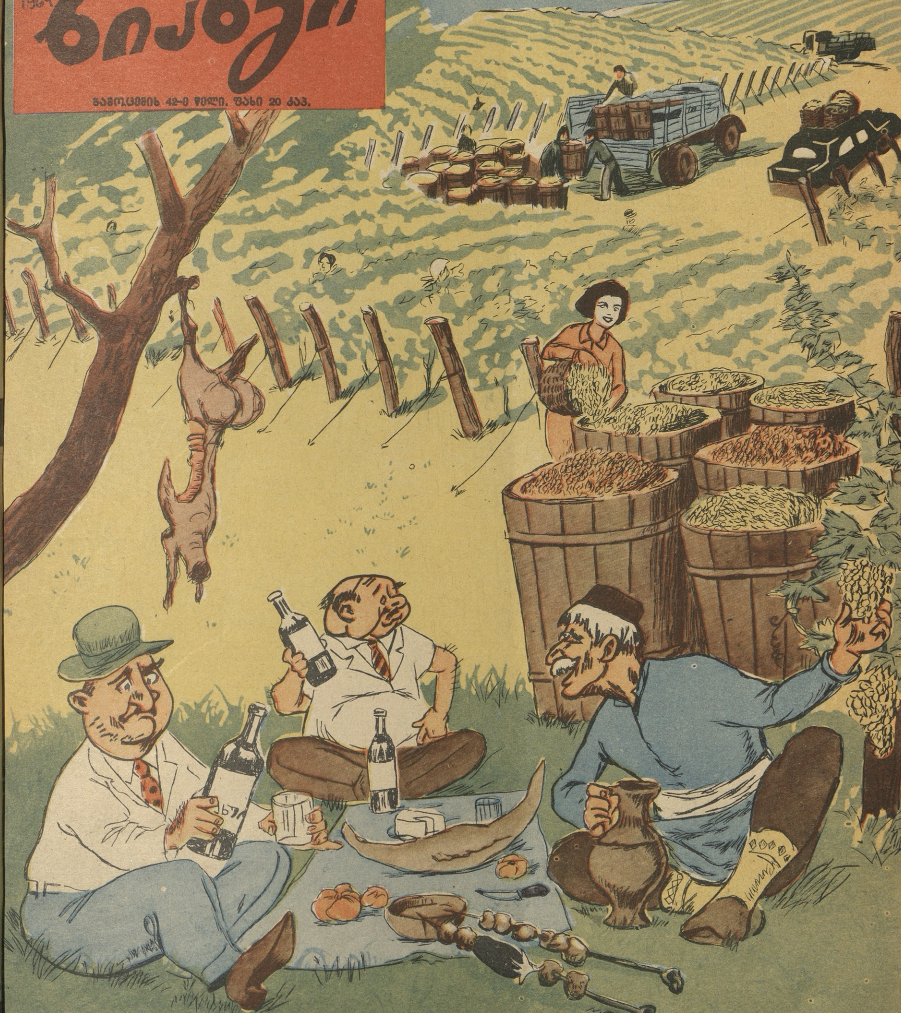
— კარგია, უვილოსან, რომ რთველის დროს მანძი ჩამოღობათ, თორემ ნათესავეებსა და მეგობრებს დავკარგავდი!