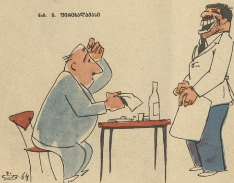
ნა. ნ. შინადალბასი

— ეს რა არის, კაცო, ერთი სამად მინდვარიზე? — თქვენ არ მითხარათ: „ამა შენ იცი თუ კარგად მამეგვოს!“