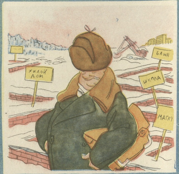
— ჩვენ მხოლოდ ფუნდამენტალურად ვაშენებთ!