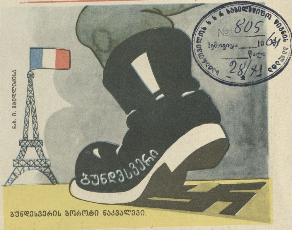
ბუნდესვერის გოროტი ნაკვალავი.