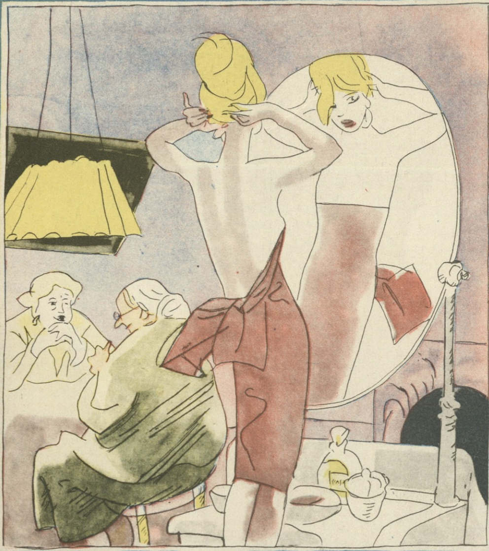
— უფნ ხომ გახსოვს როგორ გაიარა ჩვენმა ახალგაზრდობამ: უიფოვლები და მფიცრები ვიყავით... ჰოდა, ახლა გოგომა მაინც ჩაიცვას რიბინად...