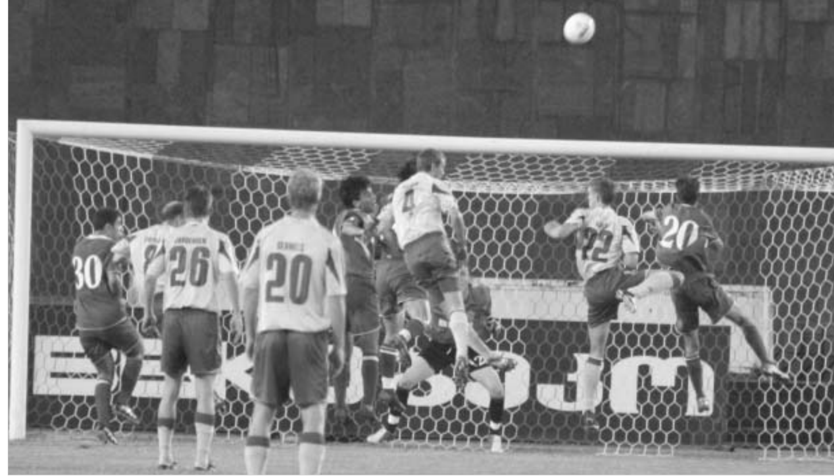
დინამოშ საპერო ორთაბრძოლები ძირითადად ნაყო.