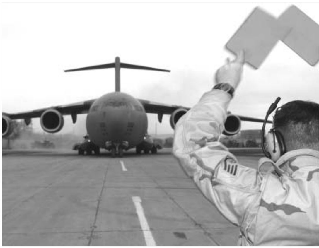
ამერიკელ ჯარისკაცებს "მანას"-ის დატოვება ჭარ არ მოუწევთ.