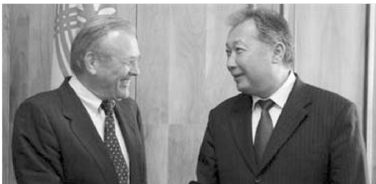
ყირგიზეთი არ არის ერთადერთი ქვეყანა ამ რეგიონში. სადაც ოფიციალურ ვაშინგტონს სამხედრო ბაზა აქვს.

აშშ-მ ყირგიზეთისა და უზბეკეთში სამხედრო ბაზების განთავსება ავღანეთში თალიბების რეჟიმის წინააღმდეგ ბრძოლის დაწყების წინ გადაწყვიტა, რაც მას მოხერხებულ საავიაციო პლაცდარმს შეუქმნიდა. შანსის ორგანიზაცია აშშ-ს უზ-