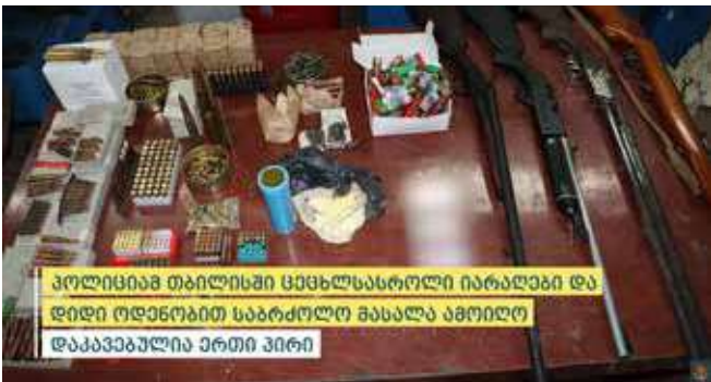
პოლიციამ თბილისში ცეცხლსასროლი იარაღები და დიდი ოდენობით საბრძოლო მასალა ამოიღო დააკავებულია ერთი პირი

ცეცხლსასროლი იარაღისა და საბრძოლო მასალის მართლსაწინააღმდეგო შექმნა-შენახვის და ტარების ფაქტებზე გამოძიება საქართველოს სისხლის სამართლის კოდექსის 236-ე მუხლის მე-3 და მე-4 ნაწილებით მიმდინარეობს.