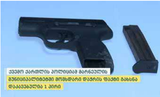
ქვემო ქართლის პოლიციამ მარნეულის მუნიციპალიტეტში მომხდარი დაჭრის ფაქტი გახსნა დააკავებულია 1 პირი

პოლიციამ დანაშაულის ჩადენის იარაღი – ცეცხლსასროლი პისტოლეტი ნივთმტკიცების სახით ამოიღეს. გამოძიება საქართველოს სისხლის სამართლის კოდექსის 120-ე და სსკ-ის 236-ე მუხლებით მიმდინარეობს, რაც ჯანმრთელობის განზრახ მსუბუქ დაზიანებასა და ცეცხლსასროლი იარაღის უკანონო შექმნა-შენახვა-ტარებას გულისხმობს.