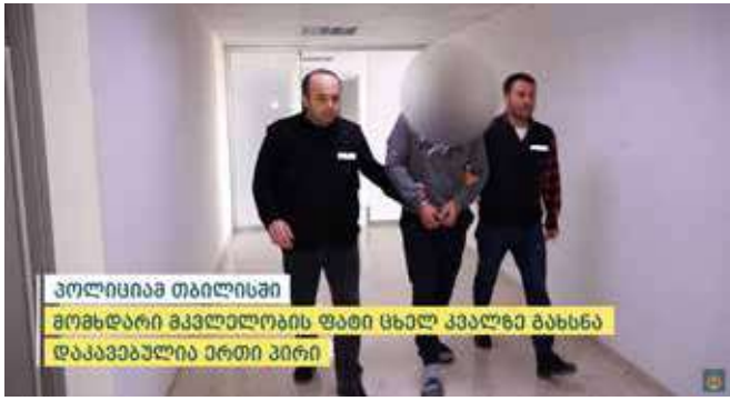
პოლიციამ თბილისში მოხდარი მკვლელობის ფაქტი ცხელ კვალზე გახსნა დააკავებულია ერთი პირი

შინაგან საქმეთა სამინისტროს თბილისის პოლიციის დეპარტამენტის თანამშრომლებმა, ჩატარებული ოპერატიულ-სამძებრო ღონისძიებებისა და საგამოძიებო მოქმედებების შედეგად, 1989 წელს დაბადებული ტ.ძ. განზრახ მკვლელობის ბრალდებით დააკავეს.