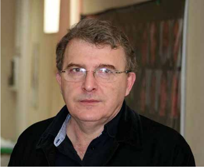
გიორგი გვანცაძე პატრიარქი

მარტის შემდეგ, საქართველოში რუსეთის მოქალაქეების დიდი რაოდენობა შემოვიდა. ყველაზე მეტი ვიზიტორი თბილისსა და ბათუმს ჰყავს. რუსეთის მოქალაქეები საქართველოს განსაკუთრებით 21 სექტემბრიდან, მას შემდეგ მოაწყდნენ, რაც ვლადიმერ პუტინმა ნაწილობრივი სამხედრო მობილიზაცია გამოაცხადა... ამასთან, საქართველოს საშუალო თუ წვრილი ბიზნესი აქტიურად იყენებს ოკუპანტი ქვეყნის ენას რუსი ტურისტების მოსაზიდად. რას მოგვითხროს რუსეთის მოქალაქეების მასობრივი შემოსვლა და რა პოლიტიკონომიკური საფრთხეები ახლავს ყოველივე ამას? – „ვერსია“ ექსპერტს კავკასიის საკითხებში, ანალიტიკოს მამუკა პრემშიძეს ესაუბრა.