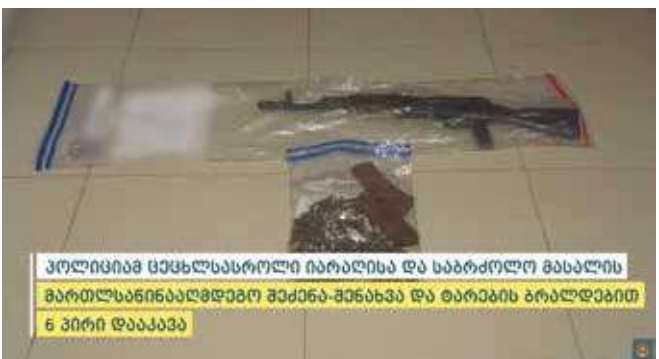
პოლიციამ ცეცხლსასროლი იარაღებსა და საბრძოლო მასალის მართლსაწინააღმდეგო შექმნა-შენახვა და ტარება დაკავებულია ექვსი პირი

შინაგან საქმეთა სამინისტროს თბილისის პოლიციის დეპარტამენტის ვაკე-საბურთალოსა და გლდანი-ნაძალადევის მთავარი სამმართველოების, სამცხე-ჯავახეთის პოლიციის დეპარტამენტის, კახეთის პოლიციის დეპარტამენტის, იმერეთის, რაჭა-ლეჩხუმისა და ქვემო სვანეთის პოლიციის დეპარტამენტისა და ცენტრალური კრიმინალური პოლიციის დეპარტამენტის თანამშრომლებმა, სხვადასხვა დროს ჩატარებული ოპერატიულ-სამძებრო ღონისძიებებისა და საგამოძიებო მოქმედებების შედეგად, უკანონო ცეცხლსასროლი იარაღები და საბრძოლო მასალა ნივთმტკიცების სახით ამოიღეს – დაკავებულია ექვსი პირი.