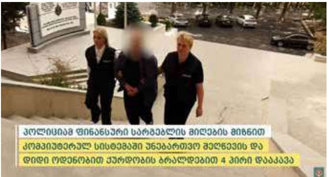
პოლიციამ ფინანსური სარგებლის მიღების მიზნით კომპიუტერულ სისტემაში უნებართვო შეღწევისა და დიდი ოდენობით ქურდობის ბრალდებით 4 პირი დააკავა

შინაგან საქმეთა სამინისტროს თბილისის პოლიციის დეპარტამენტის საგამოძიებო მთავარი სამმართველოს თანამშრომლებმა, ჩატარებული ოპერატიული ღონისძიებებისა და საგამოძიებო მოქმედებების შედეგად, მოსამართლის განჩინების საფუძველზე, ოთხი პირი – 1971 წელს დაბადებული მ.ი., 1984 წელს დაბადებული ლ.ჭ., 1983 წელს დაბადებული მ.გ. და 2002 წელს დაბადებული ს.გ. დააკავეს.