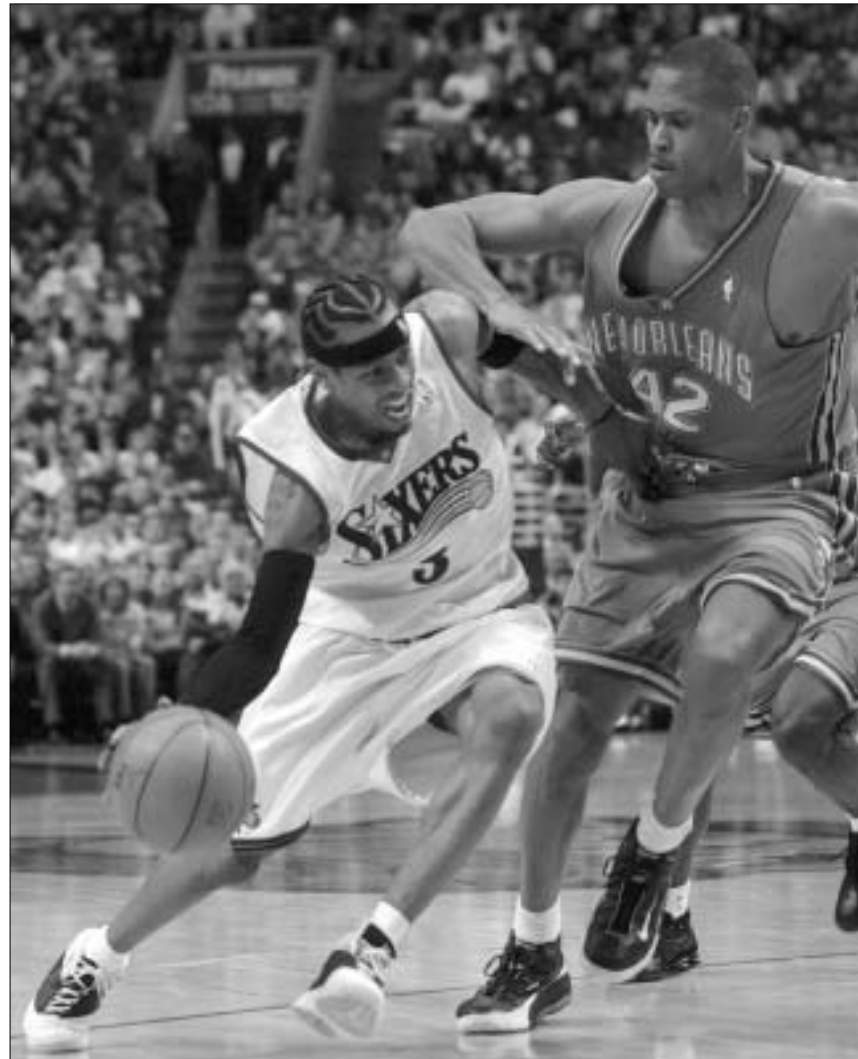
ალენ აივერსონი (მარცხნივ) საუკეთესო იყო.