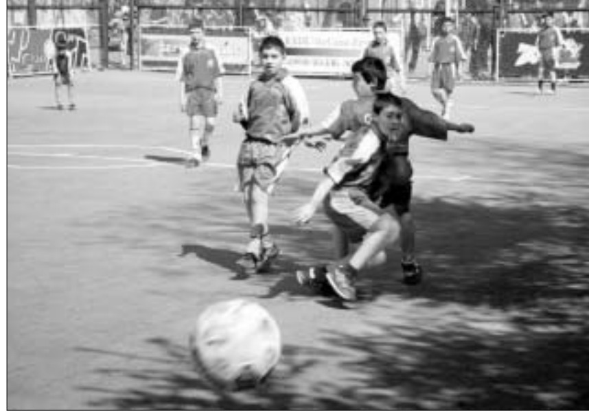
ტურნირში საბურთალოს ჩაება.

რამდენიმე დღეა, თბილისის უბნებიდან გოგო-ბიჭების თივლი-ხივილი, ჟრიახული და კიუჩის ისმის. რამდენიმე დღეა, საქართველოს სხვადასხვა რეგიონშიც ანალოგიური სურათია. რამდენიმე დღეა, საქართველოს მსგავსად, მსოფლიოს მრავალი ქვეყნის სკვერებსა და უბნებშიც განსაკუთრებული გამოცოცხლება იგრძნობა. და მაინც, რა ხდება?! პასუხი ფოქს კიდსშია - ფეხბურთის მსოფლიო ჩემპიონატის შესარჩევ ტურნირებში. ეს გახლავთ ტურნირი, რომელიც მოყვარულ გუნდებს შორის პოლანდიაში ფინალურ ეტაპზე გასამგზავრებელ საგზურს იძლევა.