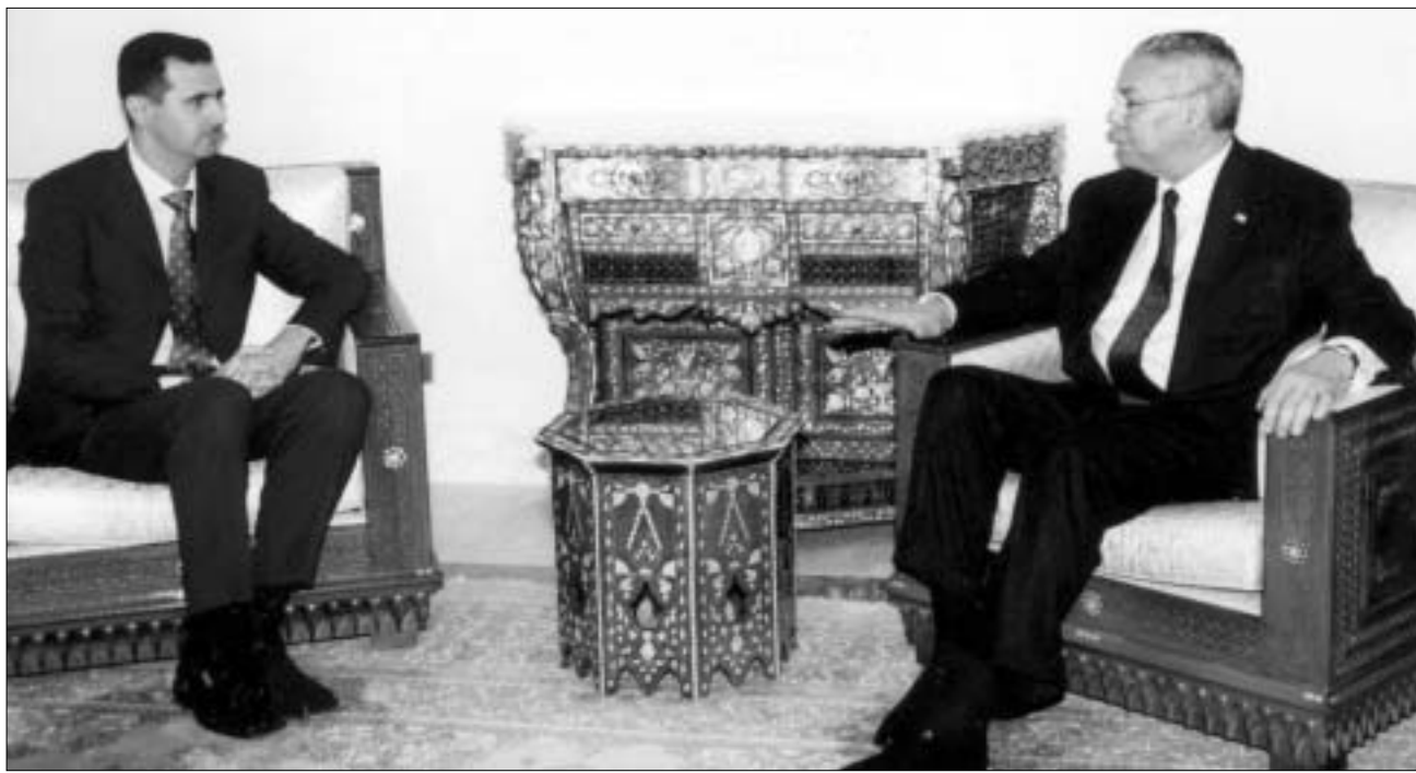
სახელმწიფო მდივანი კოლინ პაუელის და სირიის პრეზიდენტი ალ-ასადის შეხვედრა.

“მე სირიის პრეზიდენტთან ქვეყანაში მოქმედი ზოგიერთი ორგანიზაციის საქმიანობასა და მასობრივი განადგურების იარაღთან დაკავშირებულ ზოგიერთ საკითხს გა-