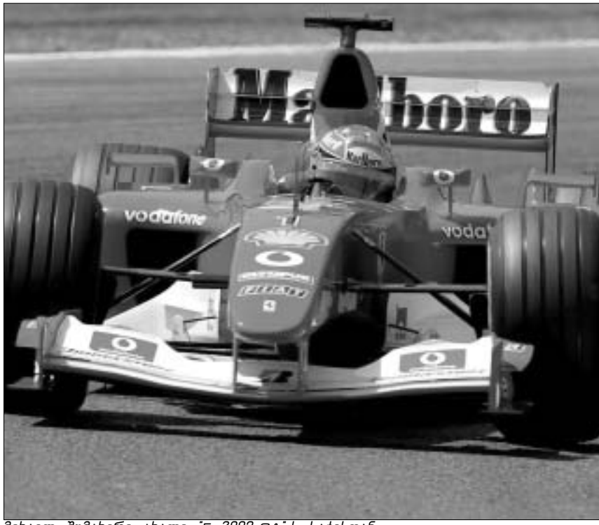
მიხეილ შუმახერი ახალი 'F 2003-GA'-ს სატესტოს.

დღეს თბილისის დროით 17.00 საათზე ბარსელონის "კატალუნიას" ტრასაზე სტარტს აიღებს ესპანეთის გრან-პრი. გუშინ კი საკვალიფიკაციო რბოლები გაიმართა. საუკეთესო შედეგი აჩვენეს "ფერარის" პილოტებმა მიხეილ შუმახერმა და რუბენს ბარიკელომ. ისინი შესაბამისად სტატრზე პირველ-მეორე ადგილებს გაინაწილეს. მესამე პოზიციაზე კი ესპანელთა მთავარი იმედი ფერნანდო ალონზო ("რენო") იქნება, რომელიც საუკეთესო იყო თავისუფალ პრაქტიკაში. კვალიფიკაციის შემდეგ მიხეილ შუმახერმა კიდევ ერთხელ მიუძღვნა ქათინაური ახალ "ფერარი 2003"-ს. "ახალ ბოლიდზე თავს უაღრესად კომფორტულად ვგრძნობდი. სასიამოვნო იჯდე ახალ მანქანაზე, რომელიც ჩვენი მოლოდინს აშორებდა" - განაცხადა მსოფლიოს ხუთეზის ჩემპიონმა. რუბენს ბარიკელოსა და ჟან ტოდტის აზრით კი "F 2003-GA"