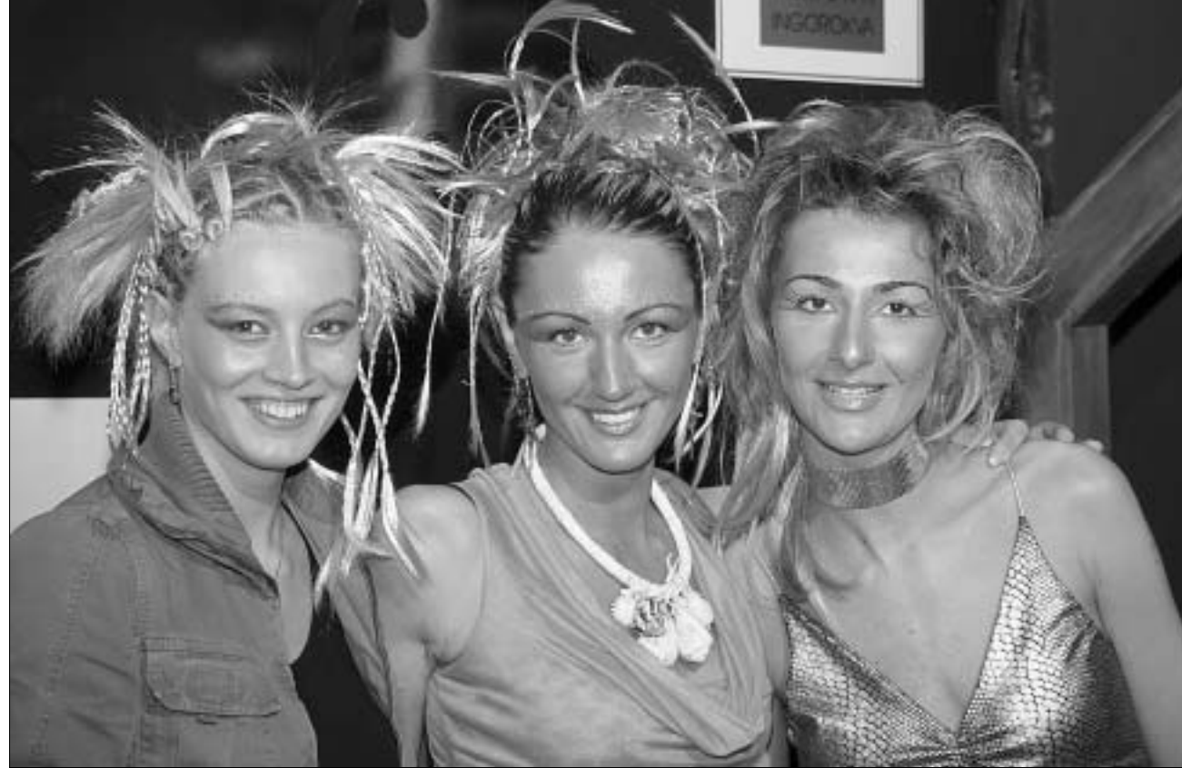
თბილისური FTV-ს მონაწილეები.