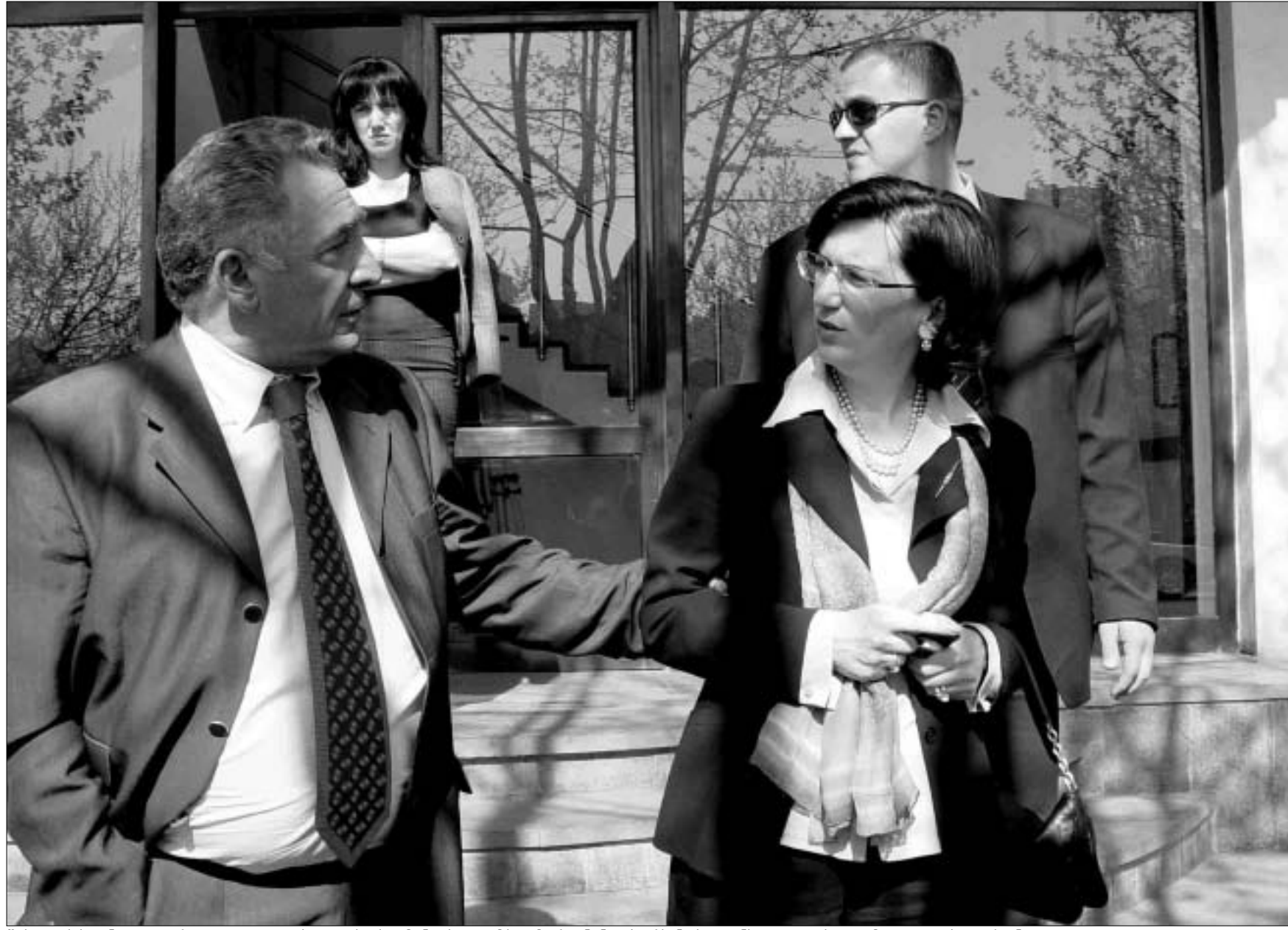
შეხვედრის ინიციატორი გოგი თოფაძე და პარლამენტის თავმჯდომარე ნინო ბურჯანაძე კონსულტაციებით კმაყოფილები არიან.