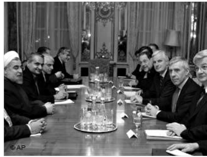
ბირთვული პროგრამის განახლება უკვე ორი წლის განმავლობაში მიმდინარე მოლაპარაკებებს აზრს დაუკარგავს.

ევროკავშირმა პარასკევს თეირანს ბირთვული პროგრამისთან დაკავშირებული კრიზისის მოგვარების შესახებ წინადადებათა ახალი პაკეტი წარუდგინა. დეტალები ჯერჯერობით არ ხმაურდება. თუმცა, როგორც სააგენტო "როიტერსი" ირანულ წყაროზე დაყრდნობით იუწყება, "ევროპულმა სამუშაომა" (დიდი ბრიტანეთი, საფრანგეთი, გერმანია) ისლამურ რესპუბლიკას მის ტერიტორიაზე ცენტრალური აზიიდან ევროპაში ნავთობის და გაზის ძირითადი სატრანსპორტო გზის გაყვანა შესთავაზა. ამის სანაცვლოდ, ევროპის კავშირი თეირანისგან ბირთვული პროგრამის გაყენის მოთხოვნას