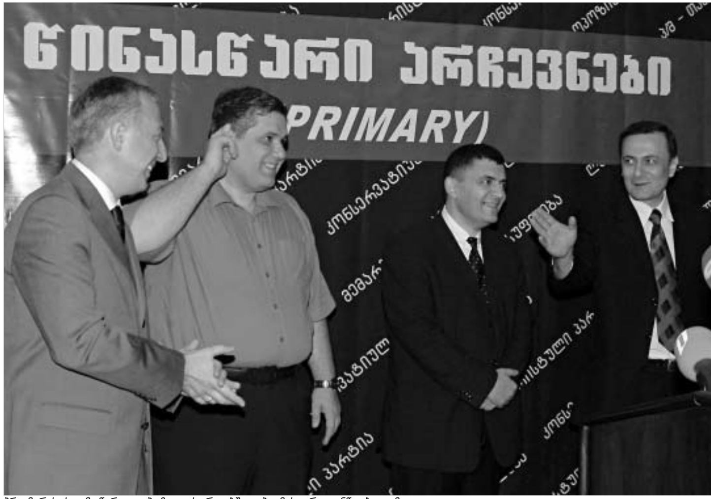
პრაიმერის ხელმძღვანელი ოპოზიციის რიგებში ოპტიმისტური განწყობა გამოვლენა

ოპოზიციური პარტიებს შორის გაფორმებული შეთანხმების თანახმად, 1 ოქტომბერს საქართველოს ხუთ საარჩევნო ოლქში შუალედურ საპარლამენტო არჩევნებზე "მემარჯვენეების", "ლეიბორისტების", "კონსერვატორებისა" და "თავისუფლების" საერთო კანდიდატები უნდა წარდგენ. თუმცა, შეთანხმების თანახმად, პარტიები ცესკო-ში თავიანთ კანდიდატებს მაინც ცალკე-ცალკე დაარეგისტრირებენ, რომლებზეც შემდგომში საკუთარი კანდიდატურები პრაიმერში გამარჯვებულთა სასარგებლოდ უნდა მოხსნან.