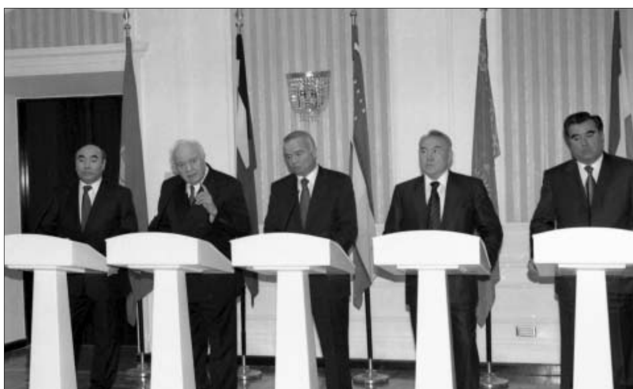
პრეზიდენტების ერთობლივი პრესკონფერენცია.