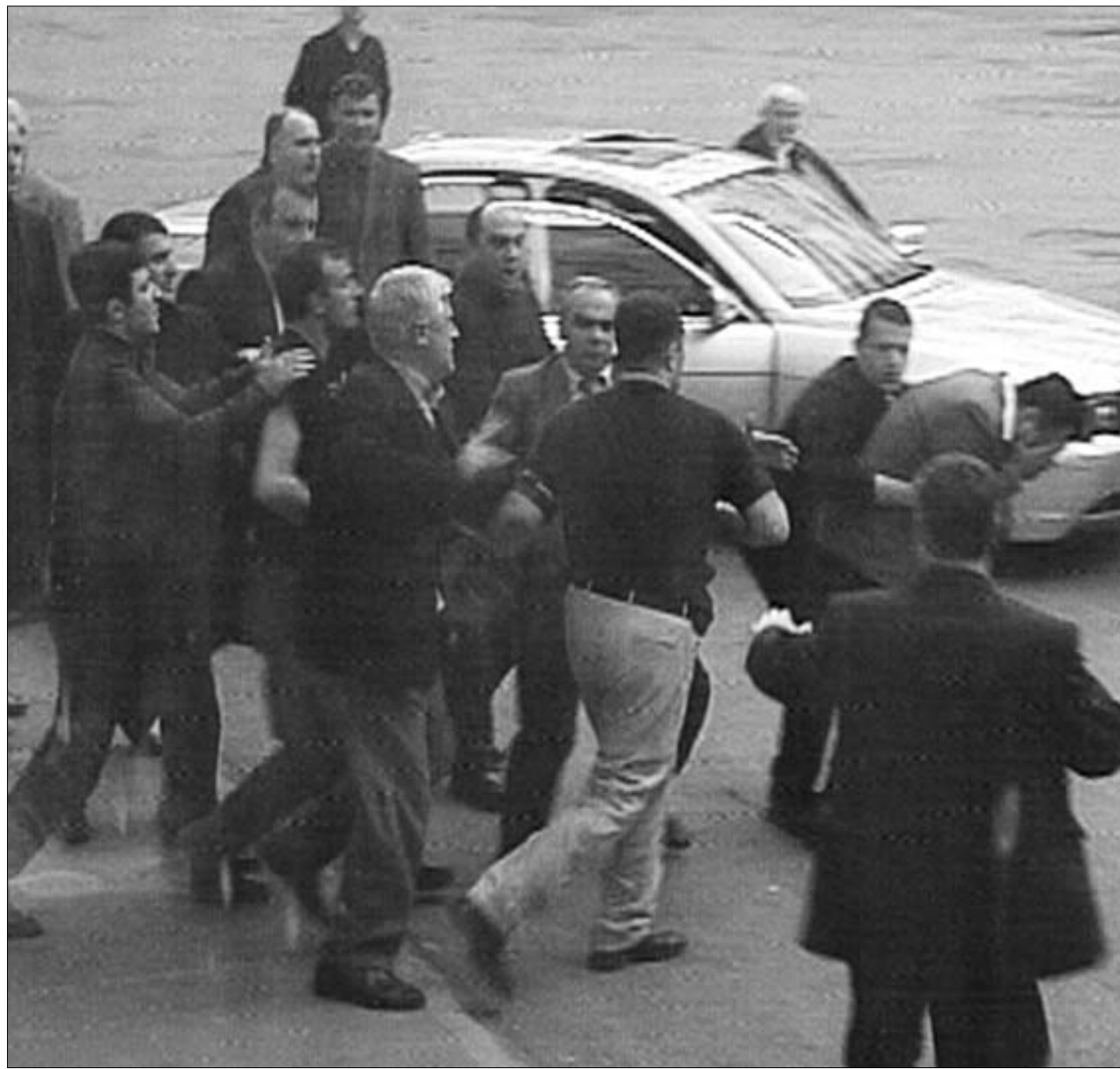
ჩუბი პარლამენტის ეზოში.