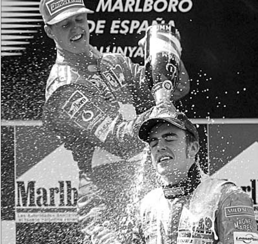
მიხაელ შუმახერი და ფერნანდო ალონსო პოდიუმზე

საპატიო წრე განსაკუთრებული გამოდგა. ესპანეთის ყველა კუთხიდან ჩამოსული 96 ათასი ფანატი ჩემს წარმატებას აღნიშნავდა. ყველა ბე- დნიერი და კმაყოფილი ჩანდა. ჩემი თანამაგაბელი სპორტის- იმ სახეობებს ადევნებენ თვალყურს, რომელშიც ესპანელები მონაწილეობენ. მისი მონაწილეობის გრან-პრის შემდეგ (მაშინ ალონსომ მესამე ადგილი დაიკავა. - რედ.) ესპანეთში სამეფო რბოლები- სადმი ინტერესმა იმატა“, - რბოლის დასრულების შემდეგ ემოციური ჩან- და ალონსო.