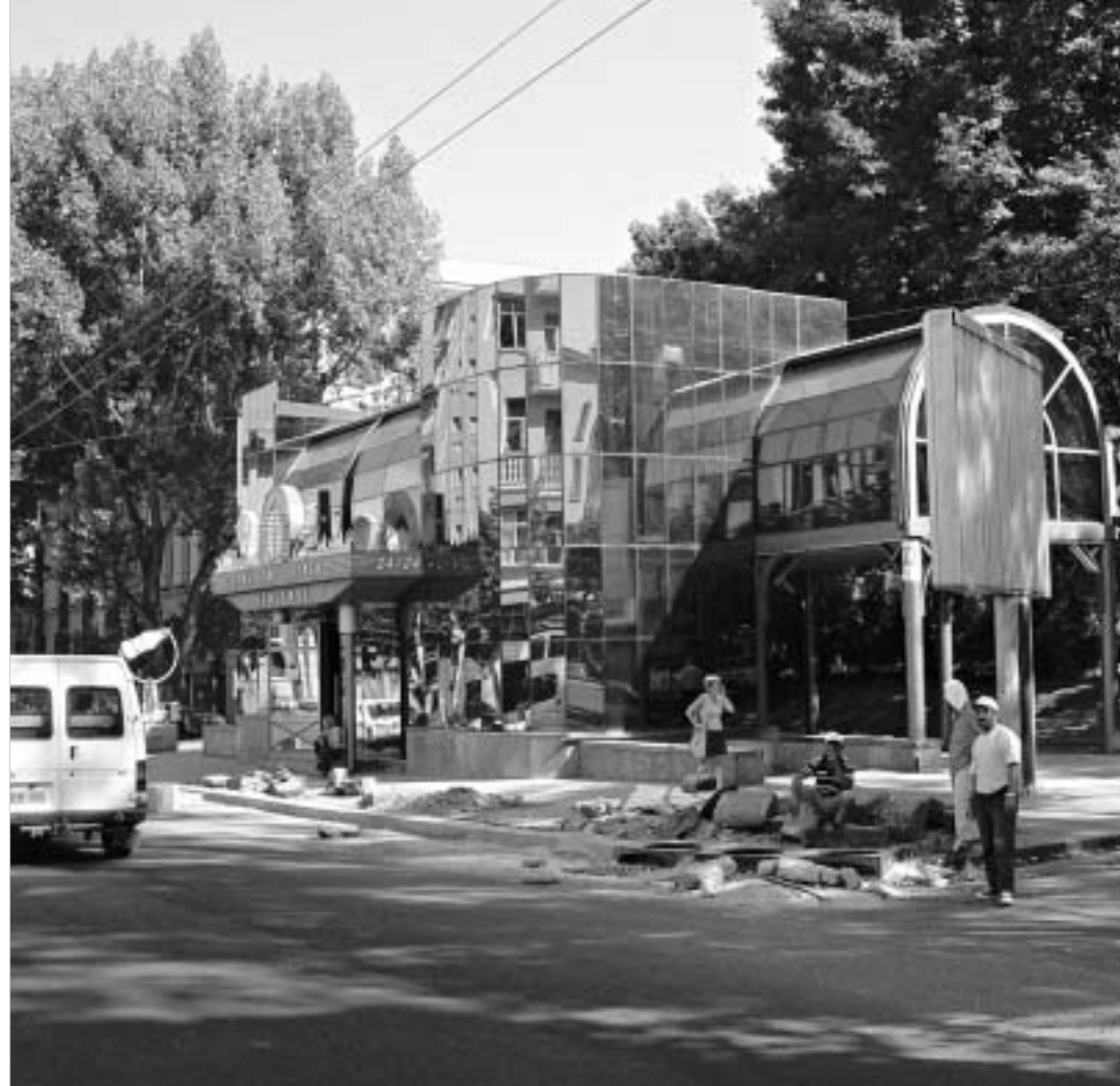
სადგომი შენობა ჭავჭავაძის გამზირზე.