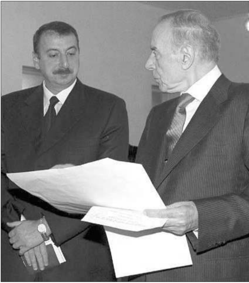
ილჰამ და ჰეიდარ ალიევი.

აზერბაიჯანულმა საინფორმაციო საშუალებებმა გუშინ გაავრცელეს ინფორმაცია, რომ პრეზიდენტი ალიევი, რომელიც ანკარაში, გულშაინეს კლინიკაში მკურნალობს, კარდიოლოგიური რეანიმაციის განყოფილებაში მოათავსეს.