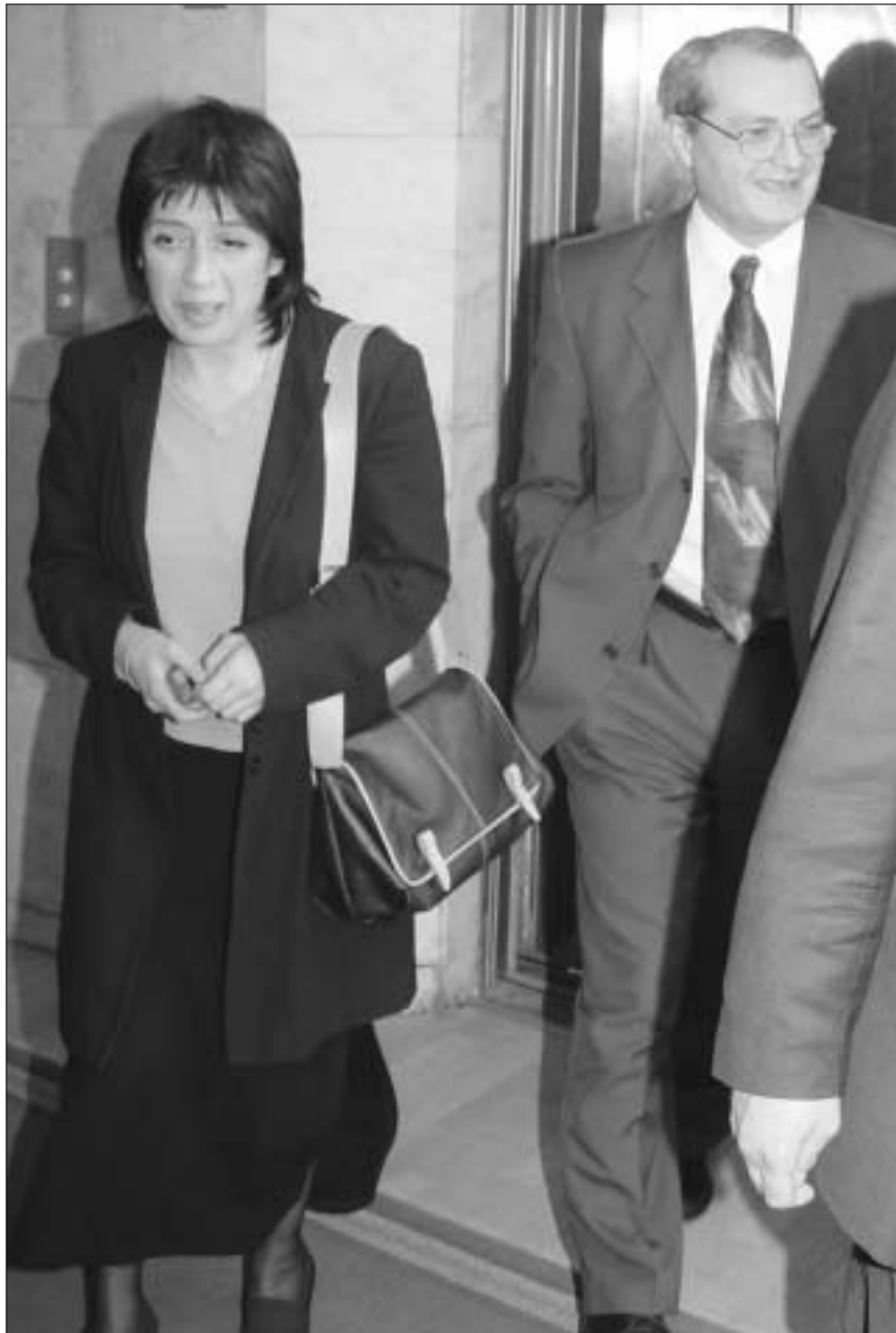
სახელისუფლებო ზღოკი სააკაშვილის ინიციატივის ირონიით შეხვდა.