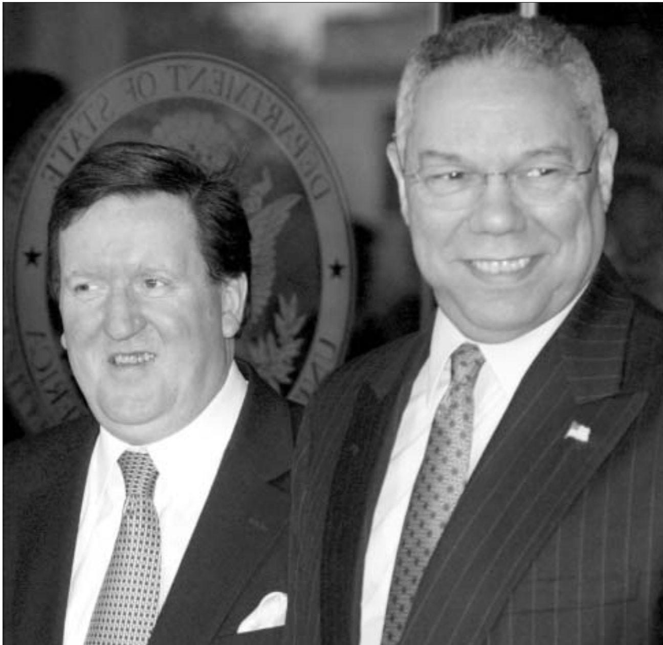
ჯორჯ რობერტსონი და კოლინ პაუელი.

იენის შუა რიცხვებში თბილისში ვიზიტს გეგმავს ყოფილი სახელმწიფო მდივანი მადლენ ოლბრატიტიც. ამერიკის პროგრესული დემოკრატიული ინსტიტუტი განაცხადებს, რომ ისინი ჯერ-ჯერობით ოფიციალურად არ ადესტურე-