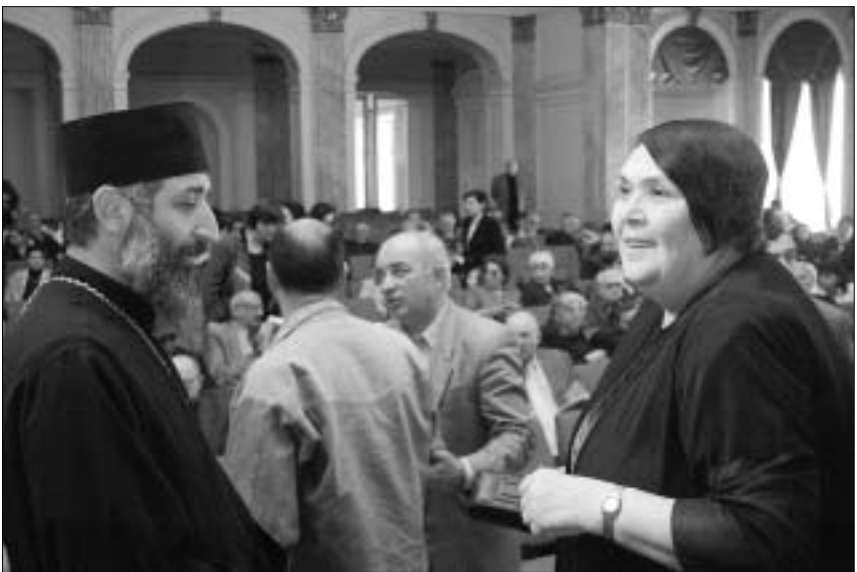
თავად-აზნაურობა მონარქისტულ მომხაველს ოპტიმისტურად უყურებს.