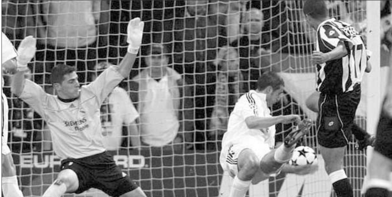
გოლი, რომელმაც შესაძლოა, გადაწყვეტი რეალი ითამაშოს.