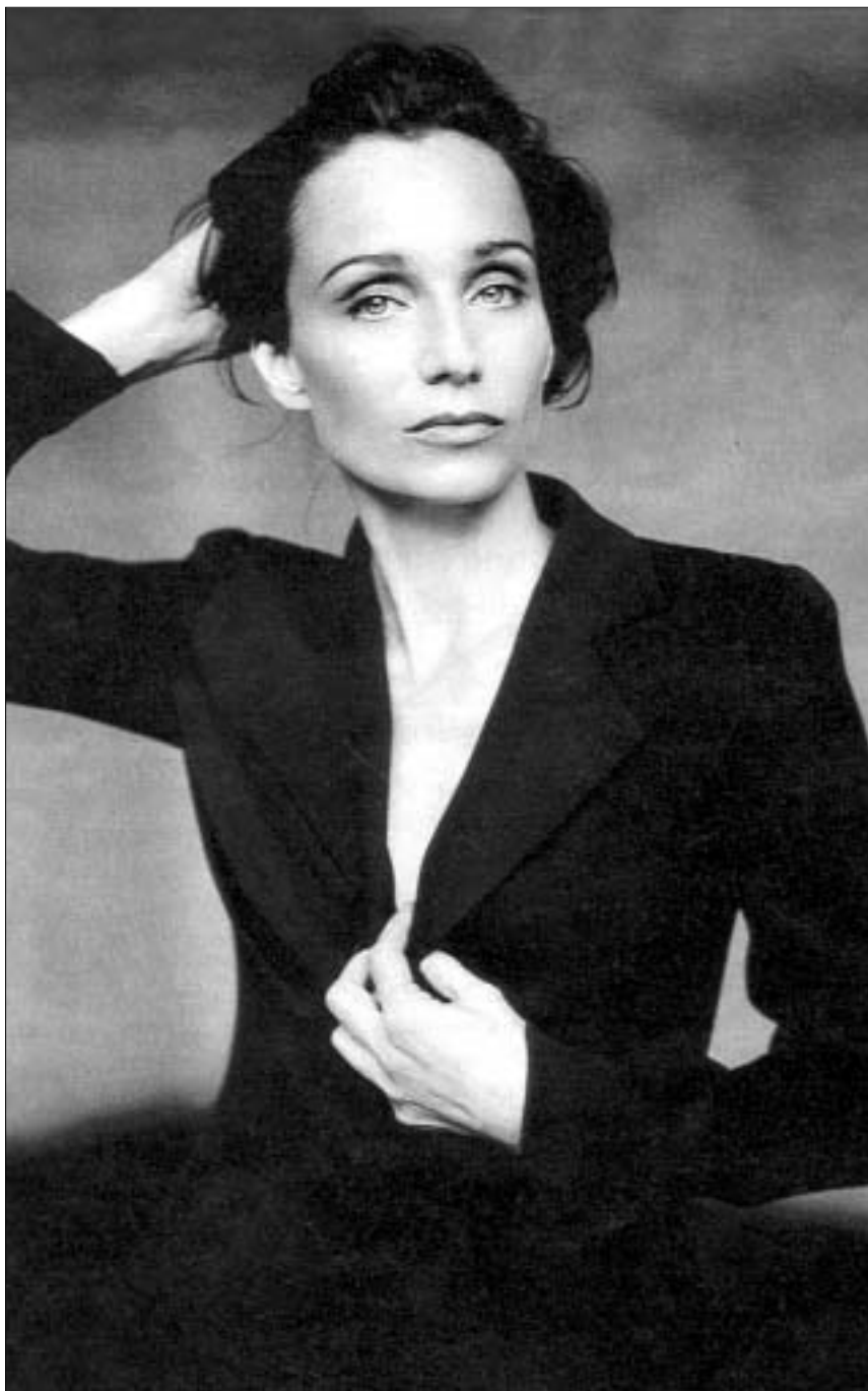
კრისტინ სკოტ-ტომასი არმანის პიჯაკით

თუმცა, ყოველდღიური ცხოვრებაში ასეთი ამაღლებული განწყობის შენარჩუნებას ვერ ახერხებს. "ძირითადად, თავს სექსუალურად ვერ გრძობ. დილას ვდევები, ვიყურები სარკეში და ვფიქრობ, ღმერთო, ეს რა საშინელებაა! როგორსაც თქვენც კერანზე მხედავთ, სინამდვილეში ისეთი არ ვარ... უფრო სწორად, ვარ მაგრამ, ჩემს გარეგნობაზე ხომ ვიზაჟისტთა მიერ ვგუფობ მუშაობს", – უყვება კრისტინი "სანდი ტაიმის"