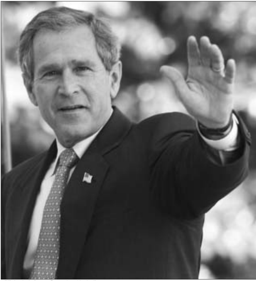
აშშ-ს პრეზიდენტი გორჯ ბუში.

პოლ ბრემერი ერაყის მართვის სადავებს არმიის გადამდგარი გენერლის ჯეი გარნერისაგან გადაიბარებს, რომელიც ბალდადში ქვეყნის ოკუპირებისთანავე იქნა გაგზავნილი. ბრემერს გარნერზე მაღალი თანამდებობა ექნება და ერაყში დემოკრატიული მთავრობის შექმნასა და ქვეყნის ეკონომიკის რესტრუქტურისთვის გაუწევს მეთვალყურეობას. ბრემერი განსაზღვრავს ერაყის პოლიტიკას და დამოორჩილება უშუალოდ ლადენს რამსფელდს. ბრემერი კრიზისების საკონსულ-