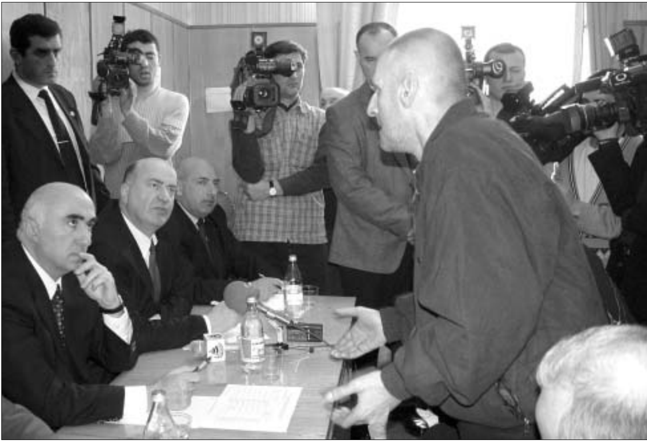
იუსტიციის მინისტრი პატიმართა პრეტენზიებს ყურადღებით ისმენს.

სარწმუნო წყაროს ცნობით, თურმე ამჟამად პატიმრებში მყოფი ე.წ. კანონიერი ქურდები ჩივიან - ფაქტებზე თუ დავებზე, დაგვაპატიმრეთ,