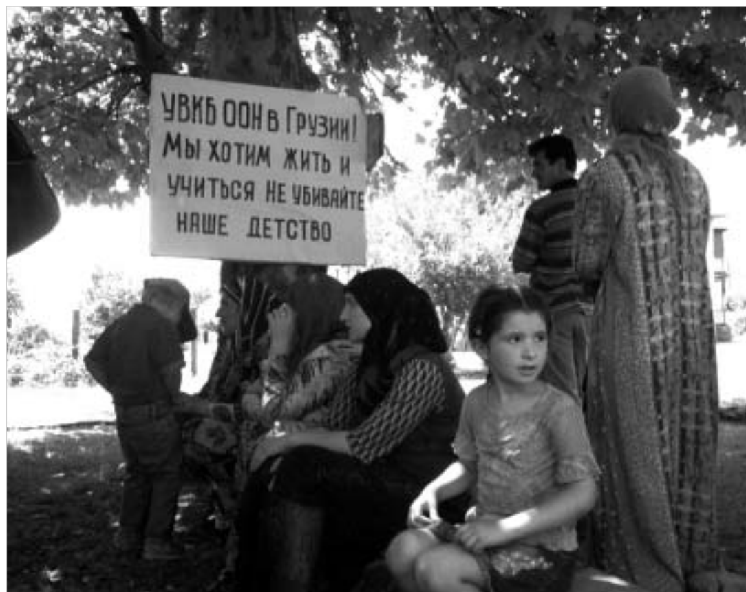
ჩივილი დევილები მიმართობს განაგრძობენ.