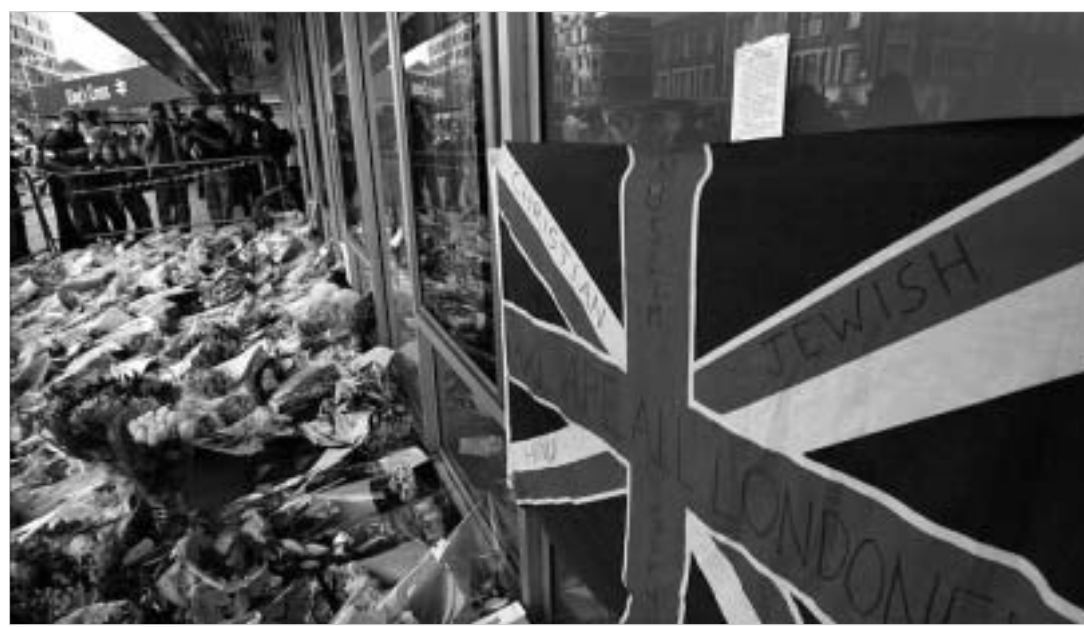
ქსტრემიზმისთვის საუკეთესო პასუხია ღია, პლიურალისტული საზოგადოების განვითარება.