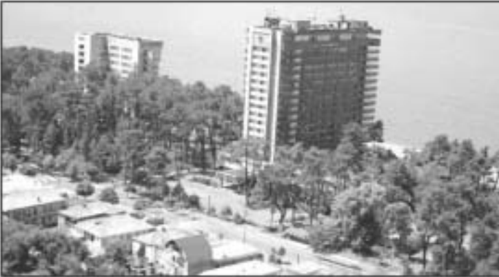
საქართველოს სოციალური ინვესტიციების ფონდის შენობა

საქართველოს სოციალური ინვესტიციების ფონდი დაარსდა 1995 წელს. მისი მიზანია საქართველოს სოციალური ინვესტიციების განვითარების ხელშეწყობა და მათი მართვა.