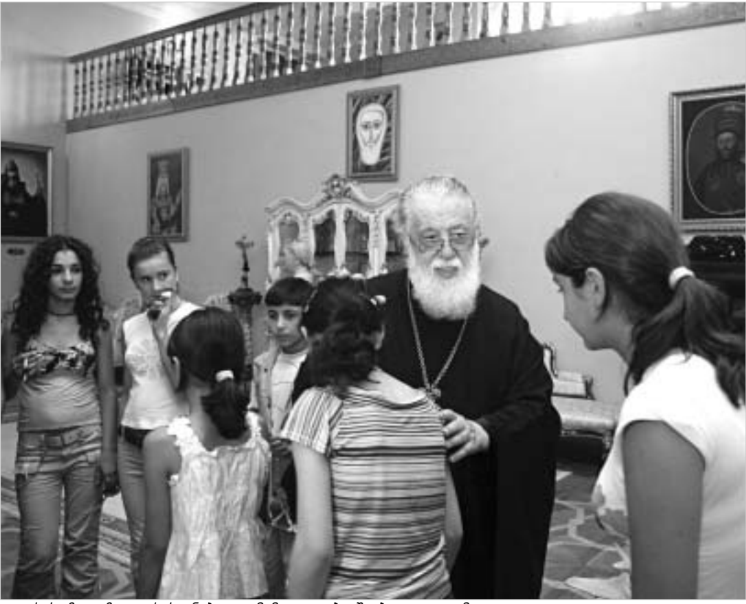
ეგვიპტის ზღვაზე დასასვენებლად მიმავალი ბავშვები ილია II-მ დალოცა.