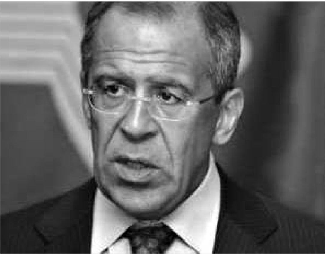
სერგეი ლავროვი კმაყოფილებას არ მალავდა.