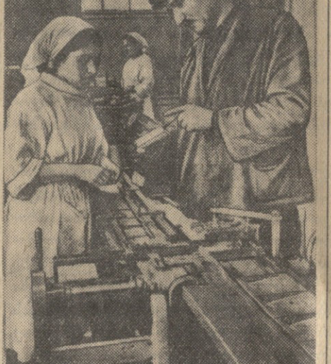
თბილისის თანამშრომელ მორეზანოვს...