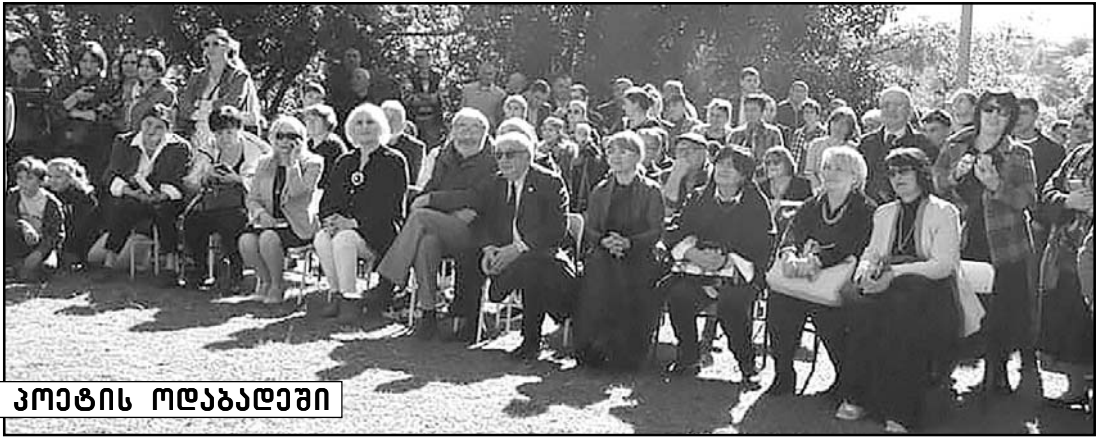
სახალხო ჯიჩი პოეტის ოდაბადევი