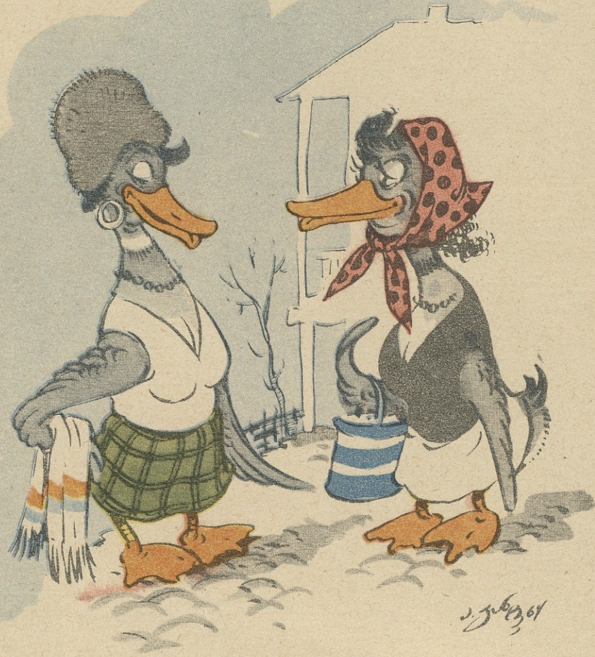
სა. ა. კანელიზაცია

— დობილო, ჩვენს უბანში ხომ არ გათხოვდი, ყოველდღე რომ აქ დადიხარ? — არა გენაცვალე, საბანაოდ დავდივარ კავშირგაბმულობის კანტორის სარდაფში!