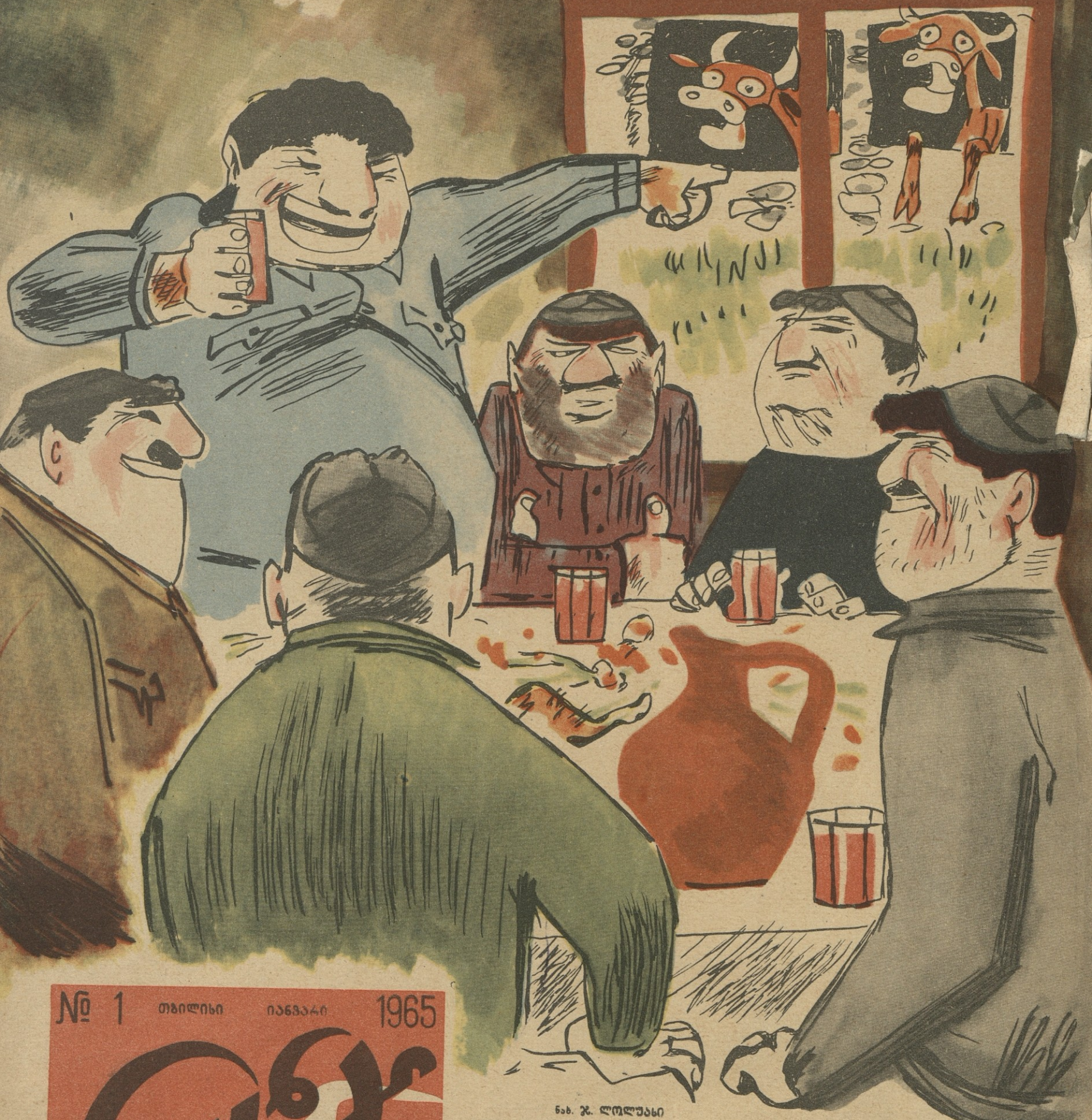
ნახ. ჯ. ლომუასი

— რა შეუგნებელი ცნობვლებია, მთელი დღე გღაპიან და სადღვრელოს თქმას არ ატლიან კაცს!