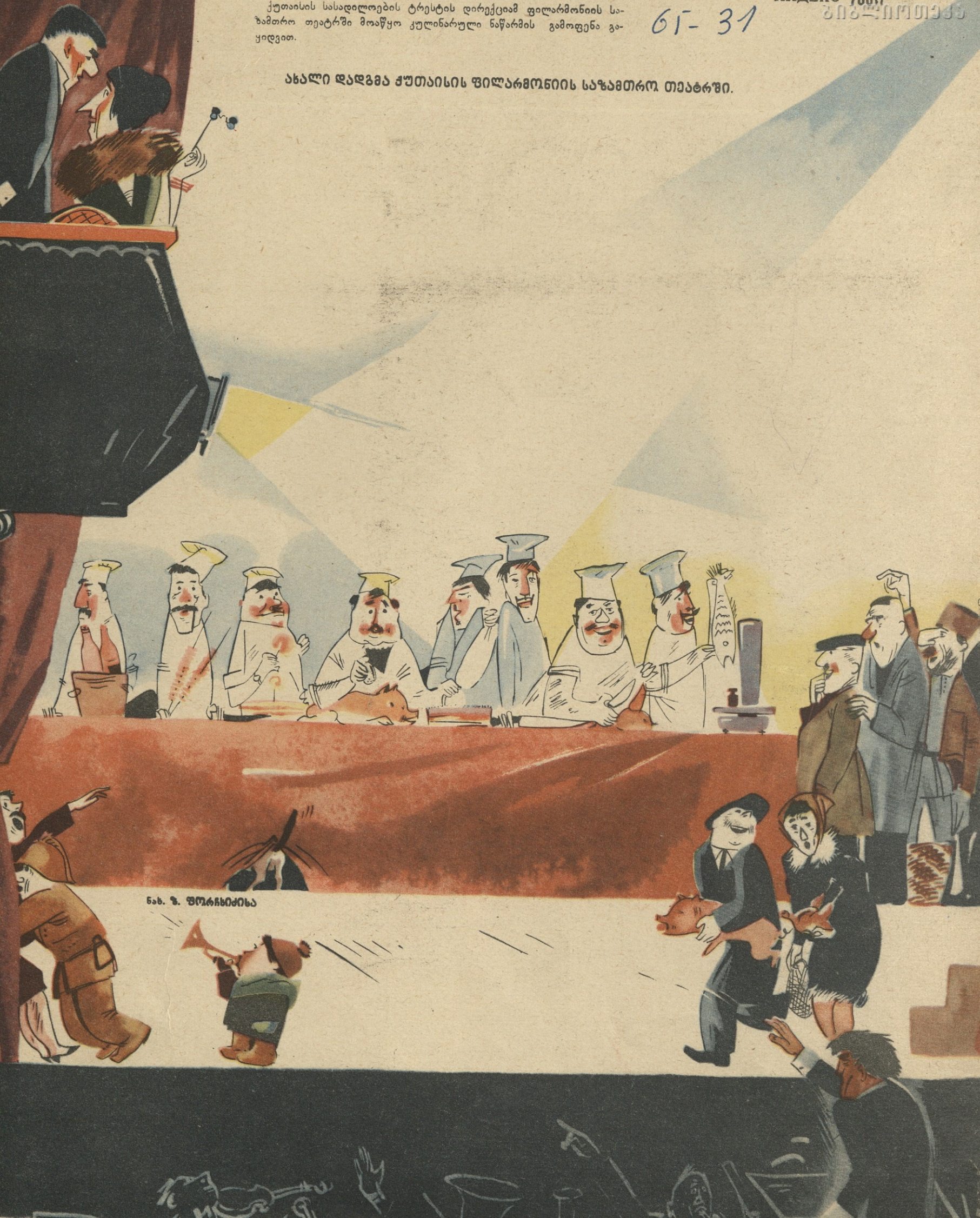
ნახ. ზ. ფორახნიძისა