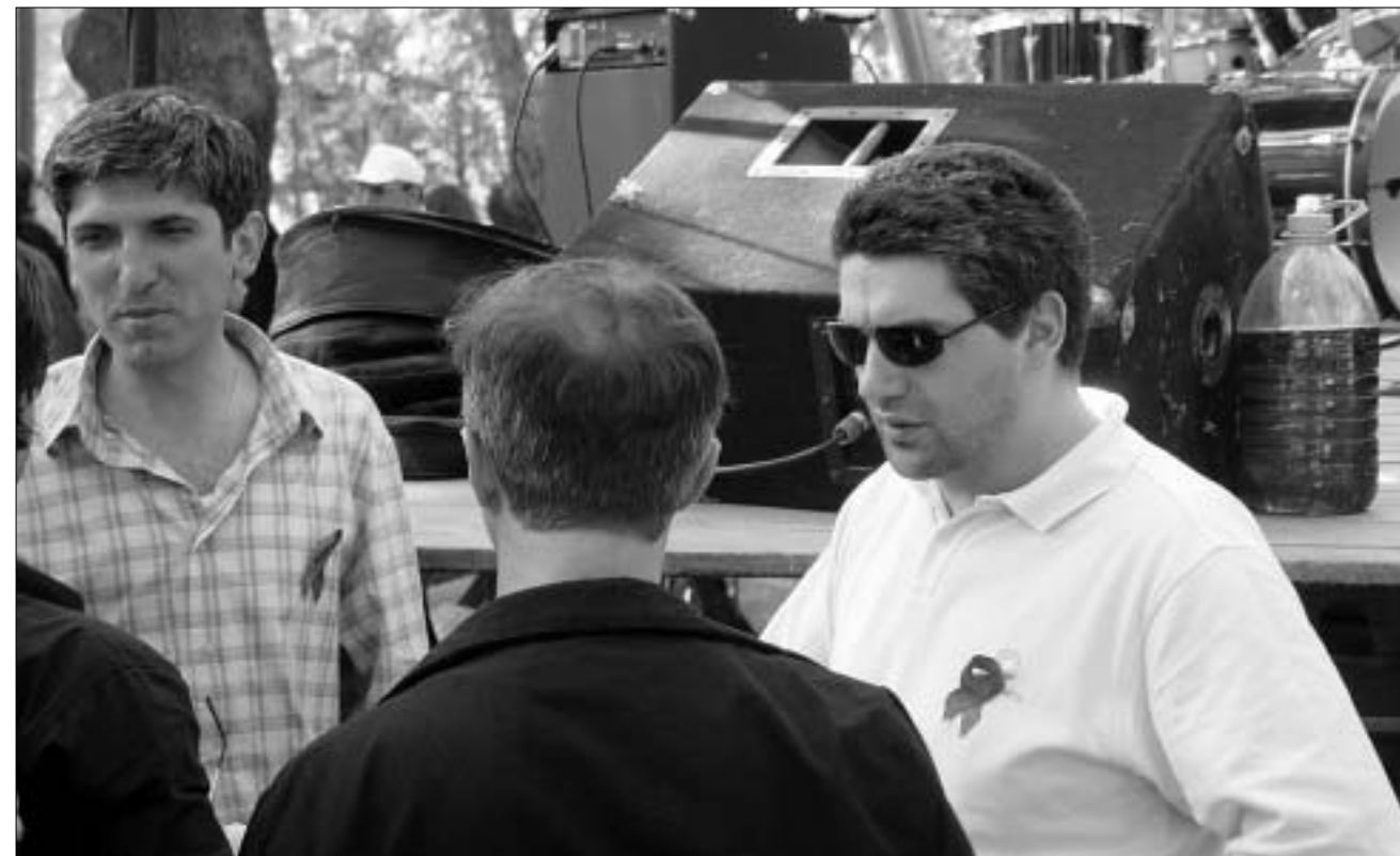
ნიუ დისამიდე კონცერტამდე: იმელია, შიდსით ინფიცირებული რიცხვი აღარ გაიზრდება

კონცერტზე, რომელიც დღუბა სხირტლადის მიზაყვდა, მსმენელები, ძირითადად, ახალგაზრდები იყვნენ. დუეტმა მათ მოკლედ განუხარტა ამ დღის მნიშვნელობა და კოფ ანანის სიტყვე-