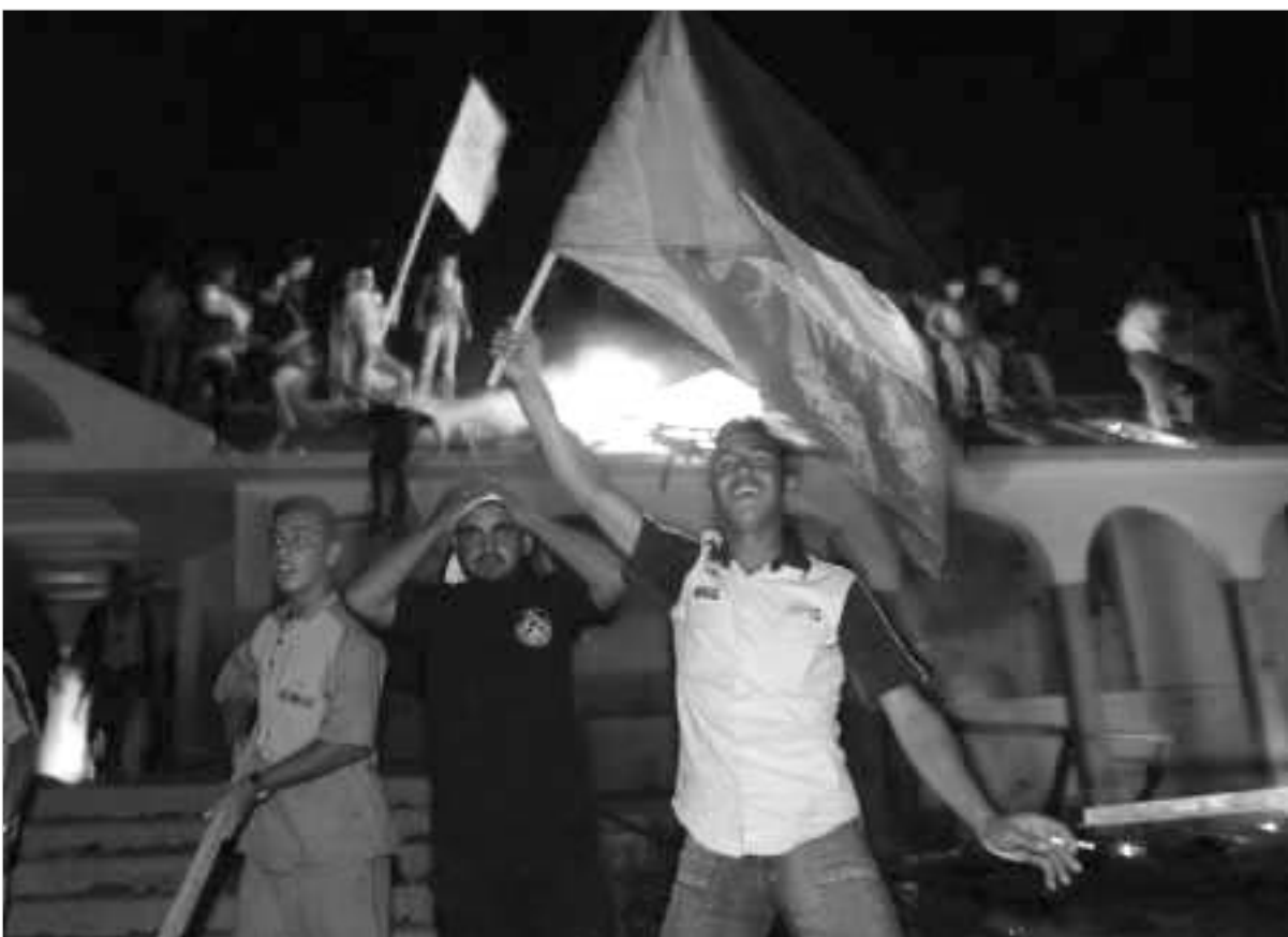
ლაზას სექტორში ოკუპაციის არც ერთი ძეგლი არ დარჩება

ოკუპაციიდან 38 წლის შემდეგ ისრაელის უკანასკნელმა ჯარისკაცმა დატოვა ლაზას სექტორი. პალესტინის ავტონომიის უსაფრთხოების ძალებმა უკვე დიკავეს ყოფილი ებრაული დასახლებები. გუშინ პალესტინის ისტორიაში სრული თვითმმართველობისკენ მიმავალი უმნიშვნელოვანესი ეტაპი დაიწყო. პარალელურად, დასრულდა არიელ შარონის ცალმხრივი დამორიშორების გეგმა. ამ გეგმამ "ალთქმულ მიწაზე" მშვიდობა უნდა მოიტანოს. თუმცა, პალესტინის დამოუკიდებელი სახელმწიფოს შენება გუშინაც ცეცხლისა და ნგრევის ფონზე მიმდინარეობდა - მოხვიე პალესტინელები და ცივილიზებული სინაგოგებსა და სხვა შენობებს წვავენ.