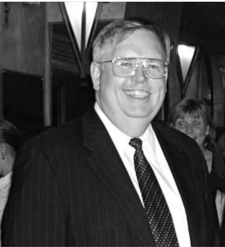
გიორგი გაჩეჩილაძე აშშ-ს ელჩი საქართველოში.