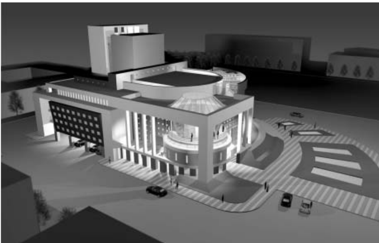
ფოტოში თეატრის მაკეტი