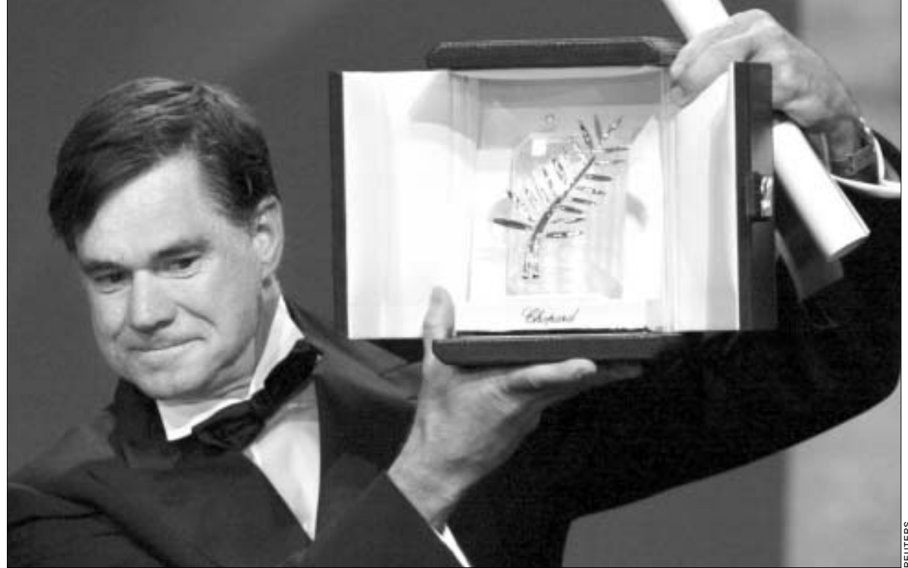
ოქროს პალმის რტო" გას ვან სენტა მილო.

25 მაისის საღამომდე, კანის ფესტივალის გამარჯვებულების გამოვლენამდე, რამდენიმე პრემია გაიცა. ჯერ იყო და პოლიეუდის ლეგენდა კლინტ ისტუუდი კანის ფესტივალის კინორეჟისორთა გილდიის პრემიის - "ოქროს ეტლის" ლაურეატი გახდა. ცოტა მოგვიანებით რუს რეჟისორს, ალექსანდრე სოკოლოვს ფილმისათვის "მამა და შვილი" კრიტიკის საერთაშორისო ფედერაციის პრესტიჟული პრემია - "ფიპრესი" მიენიჭა. კინოკრიტიკოსთა ფიურის რუსი ფურნალისტი ანდრეი პლახოვი თავმჯდომარეობდა. ეს პრემია მას კინემატოგრაფიული ოსტატობისა და ორიგინალური სიუჟეტისათვის გადაეცა. სიუჟეტი მამაშვილურ ურთიერთობაზეა აგებული. ბაზრქალაბა B1 ბავრდუა