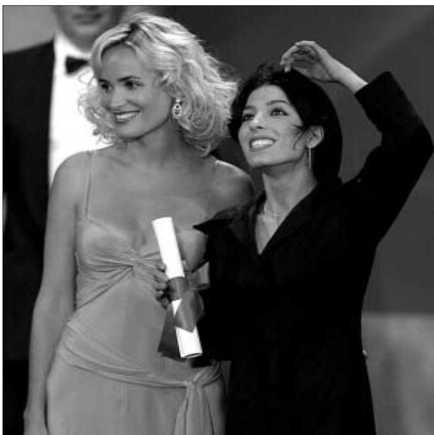
ქუდი გოდრე და სამირა მახმალბაფი

საუკეთესო ფილმი: გას ვან სენტი, "სპილო" (აშშ) საუკეთესო რეჟისორი: გას ვან სენტი, "სპილო" (აშშ) საუკეთესო სცენარი: დენის არკანი, "ბარბაროსთა შემოსევა" (კანადა) საუკეთესო მსახიობი ქალი: მარი-ჟოზე კრუზე, "ბარბაროსთა შემოსევა" (კანადა) გრან-პრი: ნური ბილგე სელიანი, "უზაკი" (თურქეთი) საუკეთესო მსახიობი მამაკაცი: მუჰამედ ოზდემირი, მეჰმეთ ემინ ტოპრაკი (სიკედლის შემდეგ), "უზაკი" (თურქეთი) ჟიურის პრიზი: სამირა მახმალბაფი, "შუადღის ხუთი საათი" (ირანი)