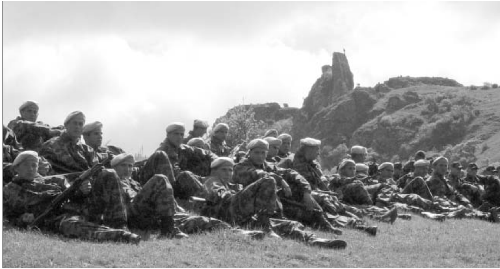
ამ მიწაზე. მათი გმირი წინაპრები - იუნკრები დაეცნენ სამშობლოს დამოუკიდებლობისათვის ბრძოლაში: რამდენიმე წუთში კი. ეს ყმაწვილები. იმავე მიწას ერთგულებას შეჰფიცავენ.