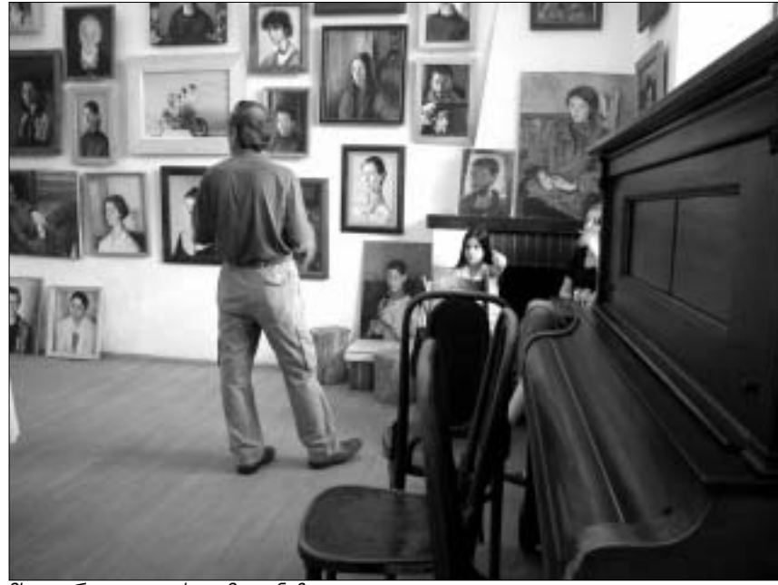
მხატვარი კოლეგის გამოფენაზე

ლევან ხარანაულის პორტრეტები "ძველ გალერეაში"