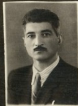
მაკანიშვილის ფილოსოფიის კ. მ. მგალობლიძე