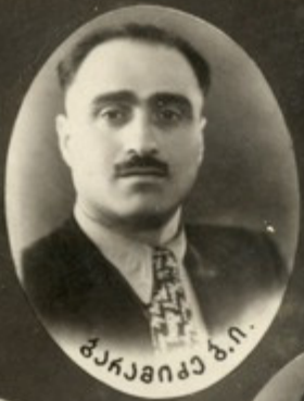
ბუაჩიანი ბ. ბ.