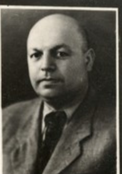
ლ. მ. ბ. მ. მანუჩიანი