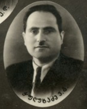
ბუაჩიანი მ. ბ.