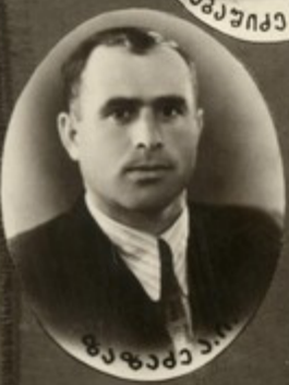
გაგაძე ა. ი.