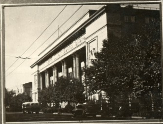
პარკ-პავილიონი-საქართველოს იუსტიციის თბილისის ფილიალი