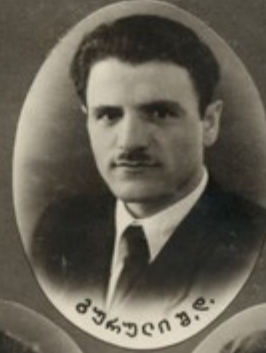
მურღვიანი ვ. დ.