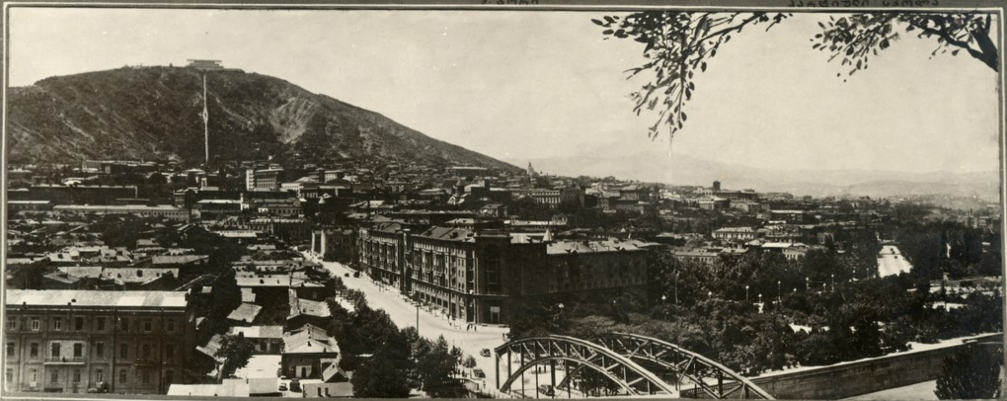
ქ. თბილისის ხედი.