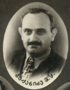
ბუაჩიანი მ. ბ.