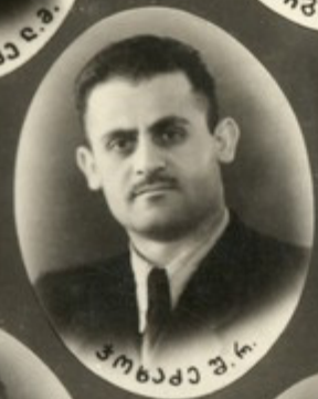
ბუაჩიანი მ. ბ.