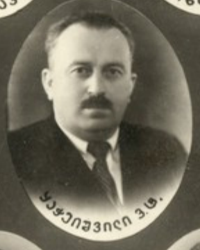
ბუაჩიანი მ. ბ.