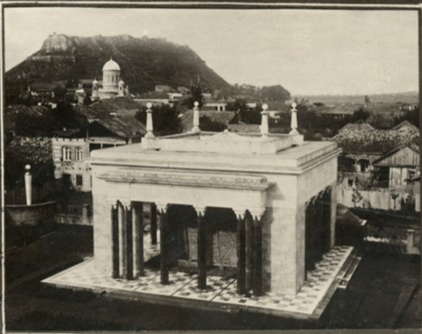
საბრძანო, სალამ-ლაიხაძის და პავლევიჩის ძეგლი და პარკ-პავილიონი ქ. თბილისი