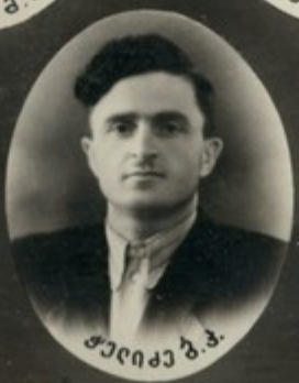
მ. მ. მარტოშვილი