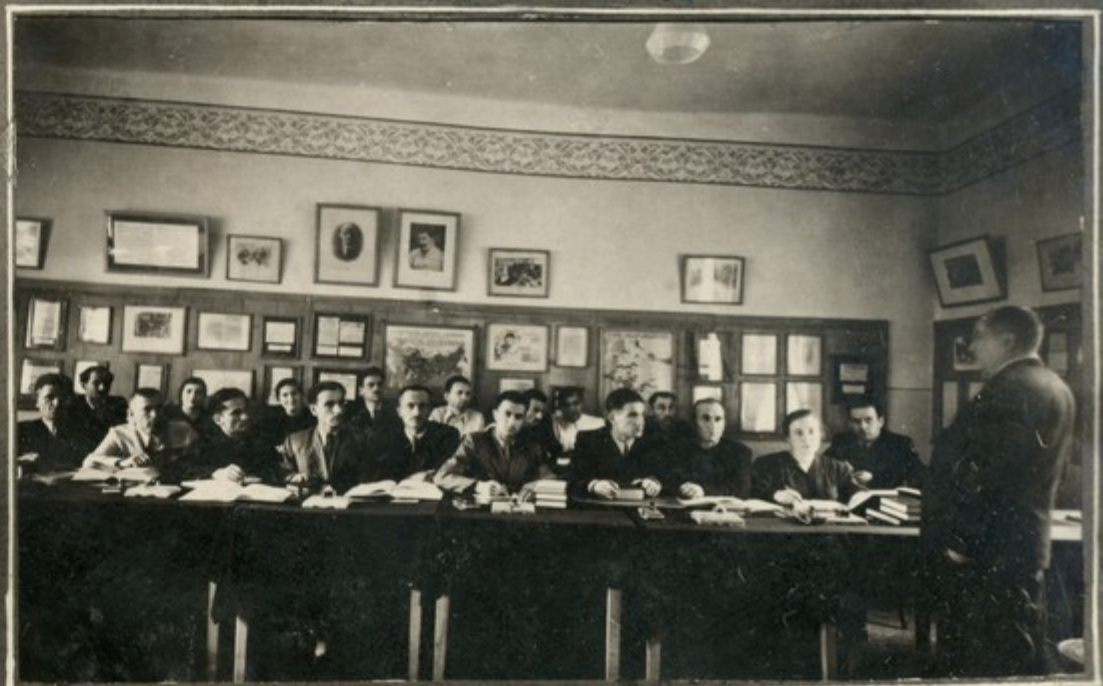
კვლევის კონსულტაცია სკკპ ინსტორიაში.