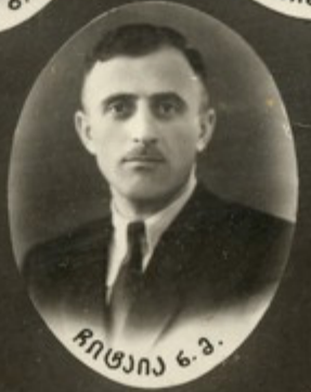
ბუაჩიანი მ. ბ.