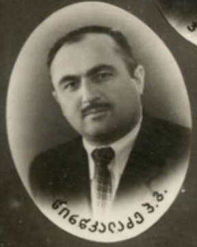
ბუაჩიანი მ. ბ.