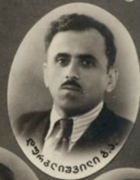
ლაგვიანი ვ. ა.