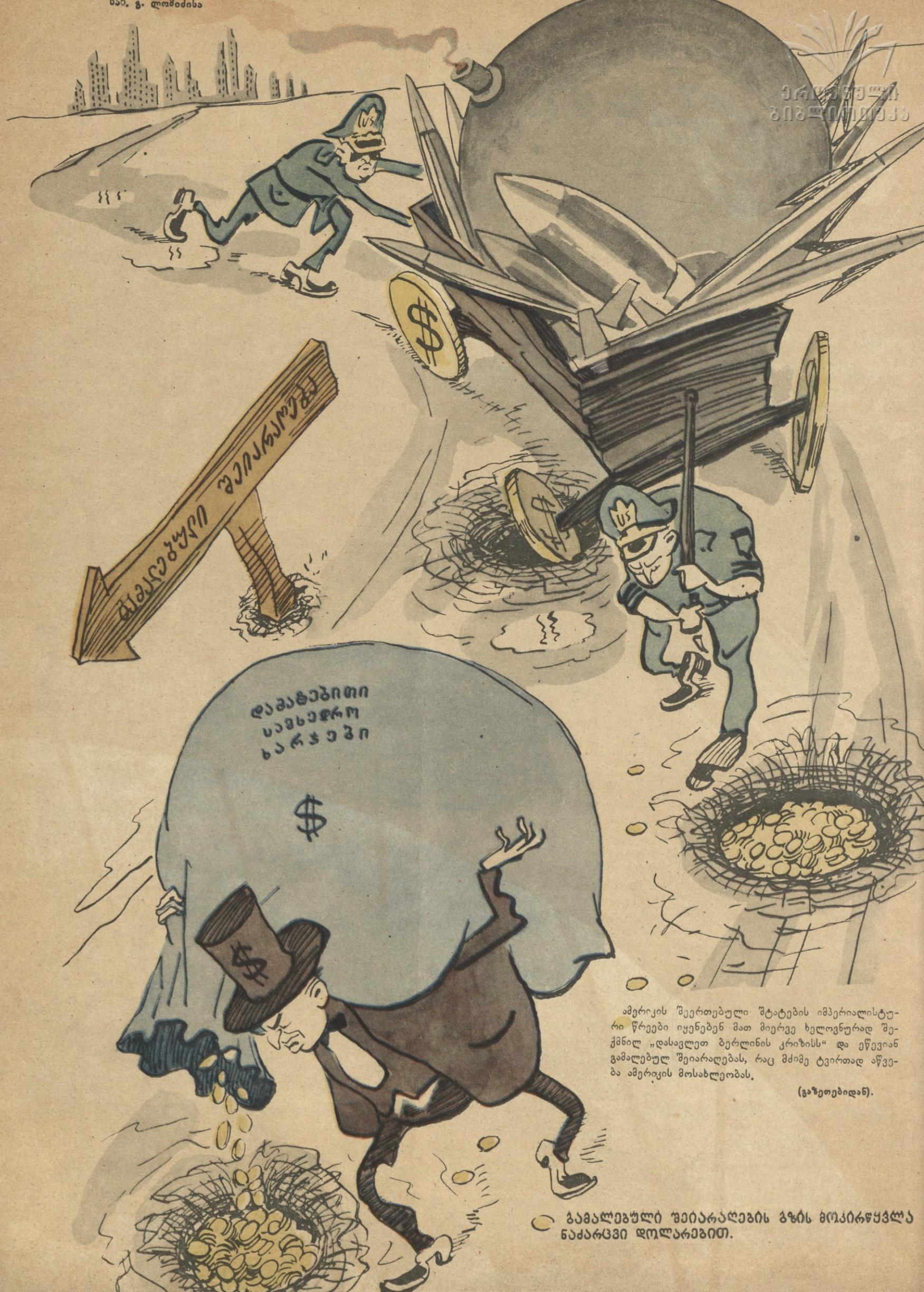
ამერიკის შეერთებული შტატების იმპერიალისტური წრეები იყენებენ მათ მიერვე ხელოვნურად შექმნილ „დასავლეთ ბერლინის კრიზისს“ და ეწევიან გამაღებულ შეიარაღებას, რაც მძიმე ტვირთად აწევა ამერიკის მოსახლეობას.