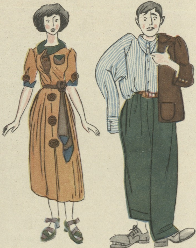
იქნებ იცნონ მათ მიერ გამოშვებული პროდუქცია.

იყო დრო, როდესაც დაწყებული სკოლის მასწავლებელი გაღიმებული ეკითხებოდა სკოლაში პირველად მოსულ და მერხებზე ბარტყებივით შემომსხდარ გაბრუნებულ მოსწავლეებს: