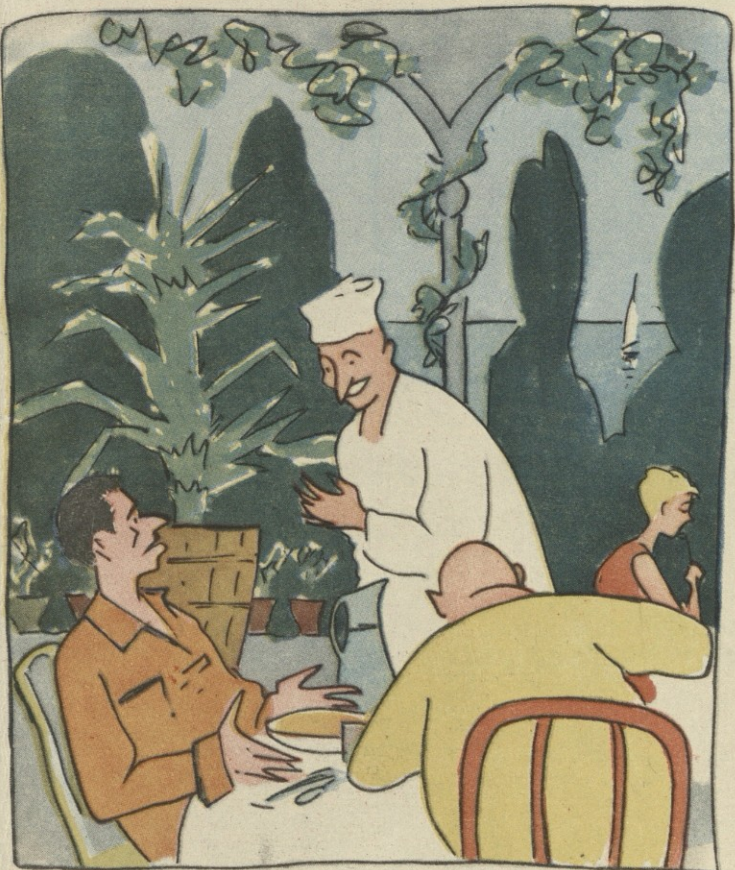
ნან. ზ. ლევაჯი

რესპუბლიკის მთელ რიგ სანატორიუმებსა და დასასვენებელ სახლებს არ ამარაგებენ ახალი ბოსტნეულით.